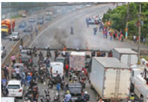
Cotia - Rodovia Raposo Tavares também foi alvo dos manifestantes na Grande São Paulo