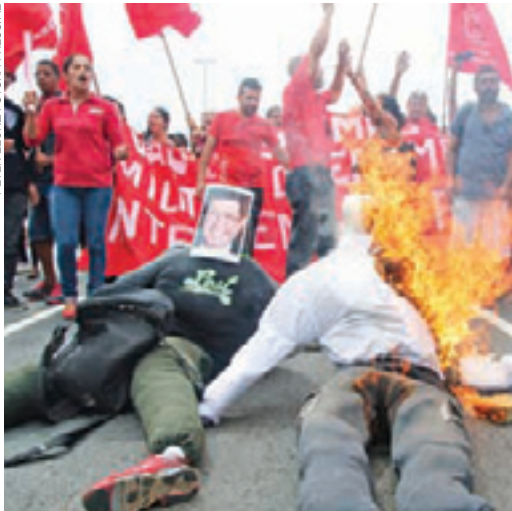
Itaquera - Manifestantes queimam bonecos de políticos perto da estação do Metrô