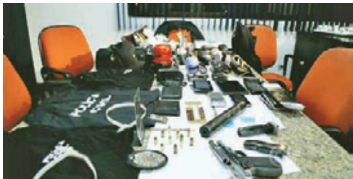
Apreendido - Armas e algemas estavam com os falsos policiais

Segundo a polícia de Mauá, a delegacia da cidade tem cerca de 50 boletins de ocorrência de pessoas que foram vítimas de sequestros-relâmpago em falsas abordagens policiais na região.