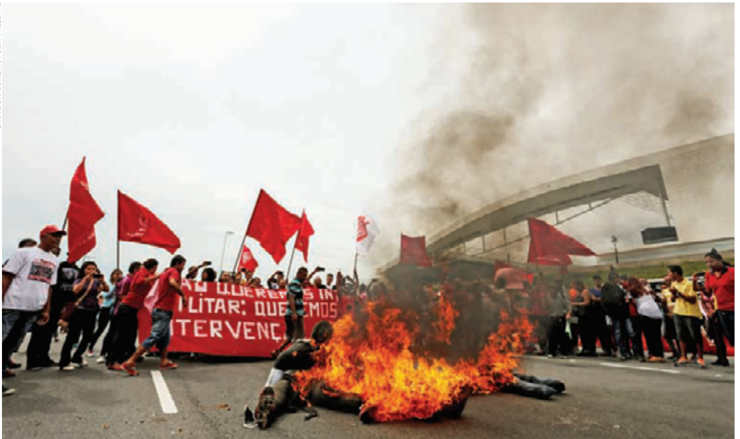
Na Zona Leste - Manifestantes atearam fogo em pneus e bloquearam os dois sentidos da Avenida Radial Leste, provocando congestionamentos