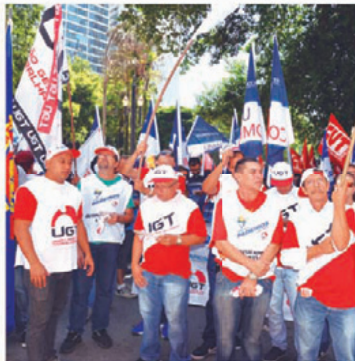
Padeiros de São Paulo, organizados pelo Sindicato, participam da Jornada de protestos contra as MP's que prejudicam 8 milhões de trabalhadores

Segundo estimativas, cerca de 8 milhões de trabalhadores serão prejudicados com as Medidas Provisórias 664 e 665. O Sindicato dos Padeiros e a UGT vêm exigindo a revogação dessas propostas lançadas pelo Governo por entenderem que restringem o acesso a direitos trabalhistas e previdenciários.