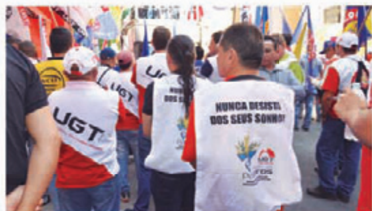
Dia Nacional de Lutas por Emprego e Direitos, promovido pela UGT e pelo Sindicato, dia 28-03

Dia 24/03, a UGT organiza o protesto no Congresso