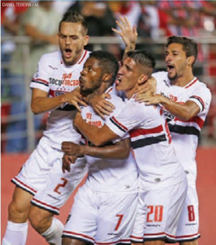
Alívio - São Paulo jogou bem, mas merecido gol da vitória só veio no fim