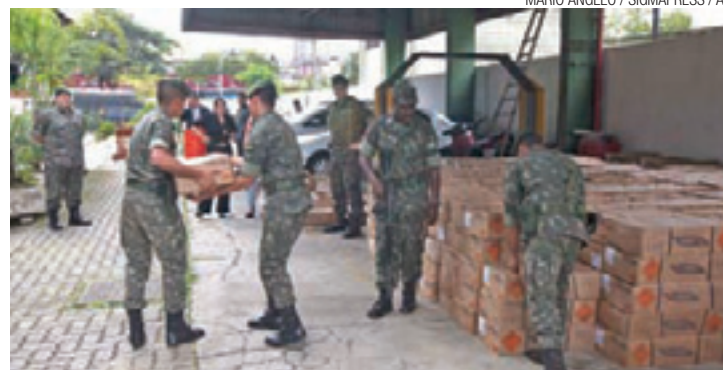
Descarregando - Homens do Exército transportam a dinamite roubada

DA REDAÇÃO - Investigadores do Departamento de Investigações sobre o Crime Organizado (Deic), da Polícia Civil, localizaram por volta das 22h desta terça-feira, 17, uma carga roubada de dinamites. Os artefatos estavam dentro de um galpão de difícil acesso, na altura do número 2.400 da Estrada de Bonsucesso, no limite entre Guarulhos e Itaquaquecetuba (Grande São Paulo).