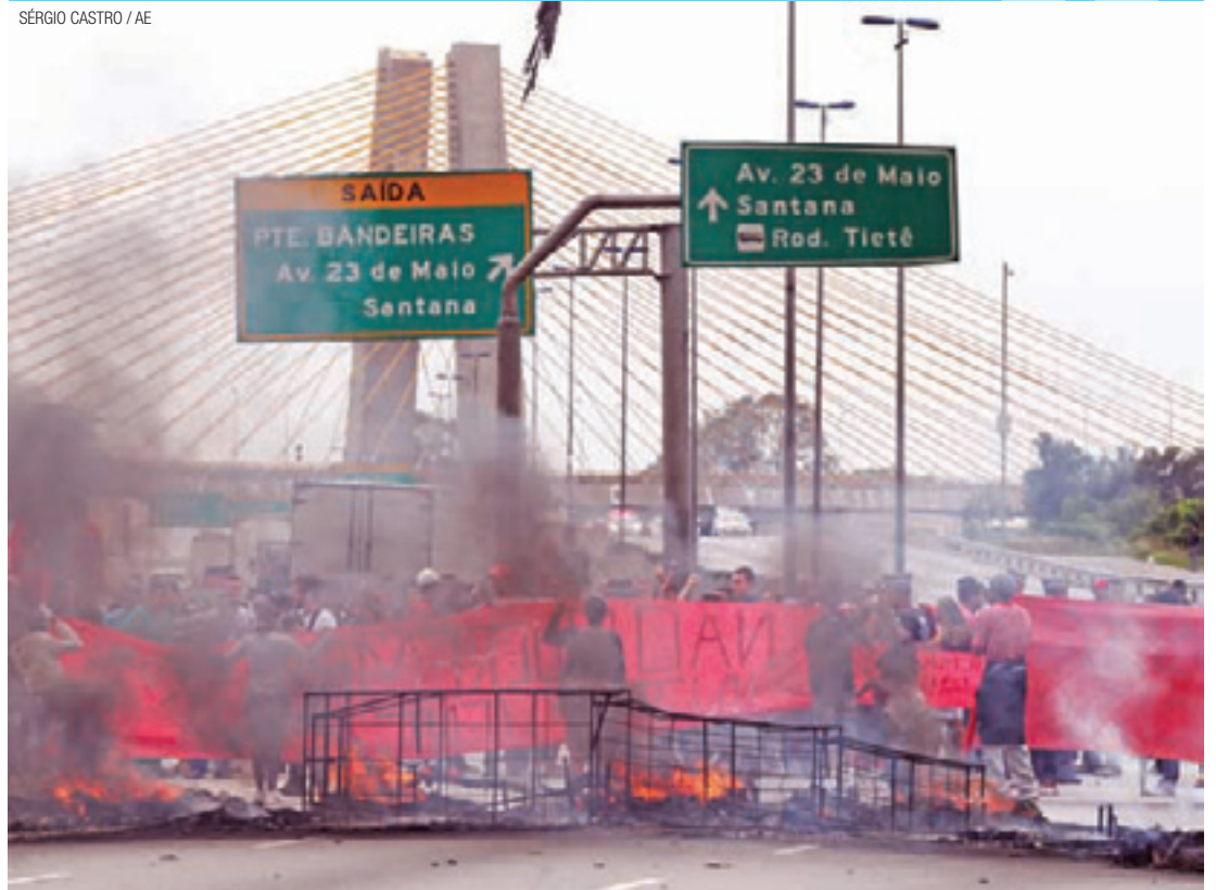
Caos - Manifestantes interditaram várias vias e pediram implementação imediata do 'Minha Casa, Minha Vida 3'