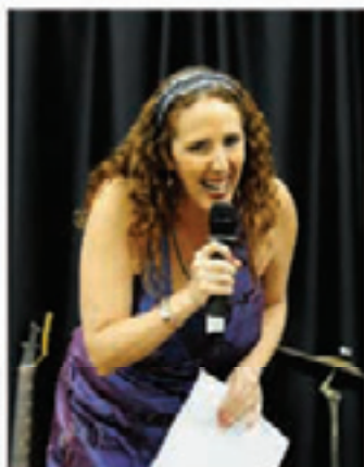
Sánchez: "Saber Inglês valoriza o currículo, aumenta as oportunidades no mercado de trabalho"

Inscrições abertas para novas turmas no Projeto Inglês para São Paulo