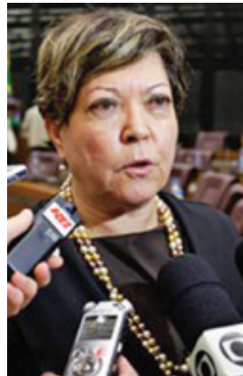
Desembargadora - Ivani Bramante suspendeu demissões