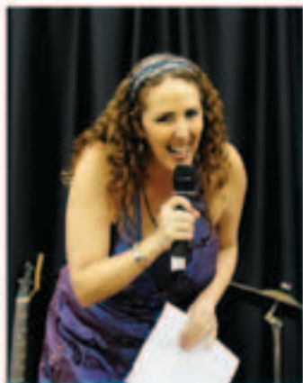
Sánchez: "Saber Inglês valoriza o currículo, aumenta as oportunidades no mercado de trabalho"

Aprender Inglês com facilidade em pouco tempo é um desejo que se transforma em realidade para os alunos do Projeto Inglês para São Paulo, que comemora este ano o seu 16º aniversário.