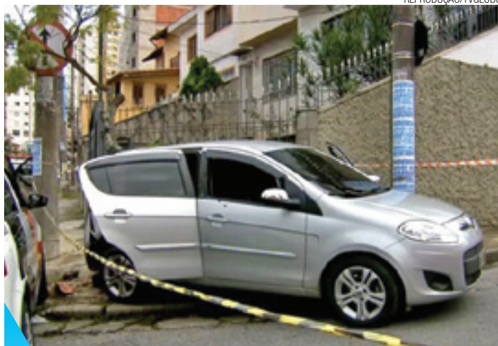
Batida - Na fuga, criminosos cabaram batendo o carro

Os policiais encontraram o primeiro suspeito na Rua Soldado Almir Bernardino, no Parque Novo Mundo, na Zona Norte. Já o segundo foi pego na Zona Leste, na Rua São Felipe, região do Parque São Jorge. Uma pistola calibre 765 também foi apreendida. Os dois suspeitos foram presos em flagrante e levados para o 39º Distrito Policial (Vila Gustavo, na Zona Norte).