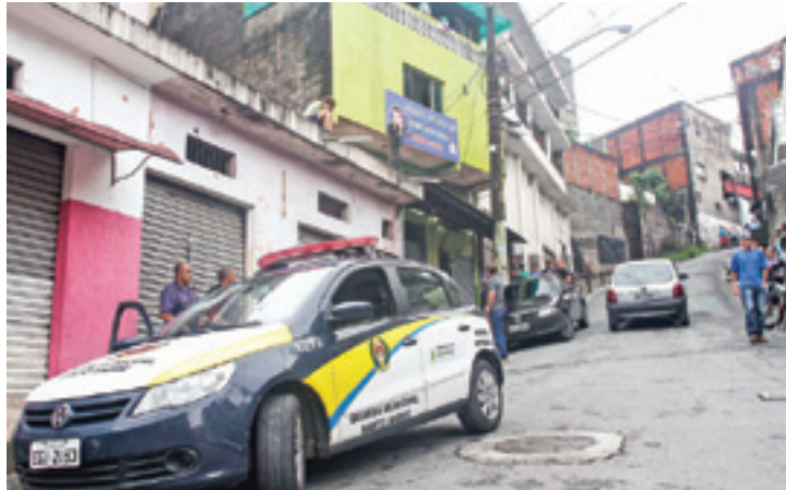
Dia do crime - Carro da GCM parado em frente à casa do vereador