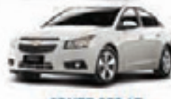
CRUZE SED LT 1.8 16V MEC. 12 PL-2899 - COMPL. R$ 49.900,