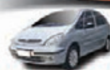
PICASSO EXCLUSIVE 1.6 FLEX 08 PL-8687 - AR/DH/DIG/RD/SOM R$ 22.990,