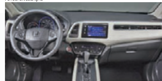
Interior - Esportivo e moderno, cockpit é luxuoso

upswept. Maçanetas traseiras escondidas aumentam ainda mais a sua aparência de coupe-like.