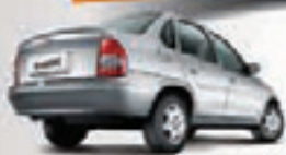
CORSA SEDAN CLASSIC 08 HIK0205 - COMPLETO R$ 15.990,