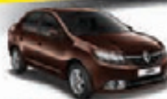
LOGAN AUTHENTIQUE 1.0 16V FLEX 13 PL-8205 - DH/APENAS 10.700 KM R$ 23.500,