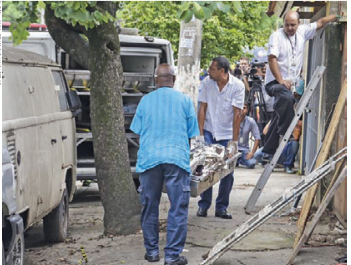
Tragédia - Corpo do comerciante, de 45 anos, acabou sendo retirado do quintal da casa da própria mãe