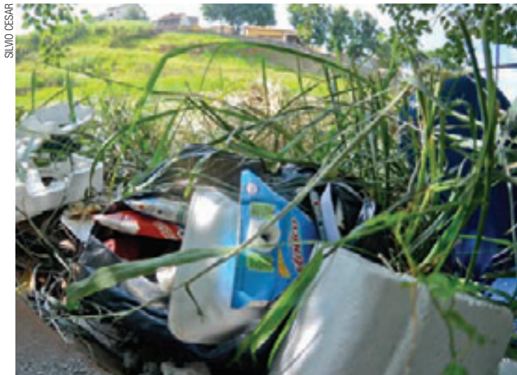
Sujeira - Acúmulo de plásticos e garrafas é um criadouro em potencial

cidades analisadas estão em situação de risco ou alerta. A situação é muito grave pelo País