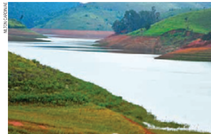
Em alta - Com março chuvoso, o sistema não para de subir todo dia

Antes da crise, o Cantareira abastecia 8,8 milhões de pessoas, mas hoje produz água para 5,6 milhões de clientes.