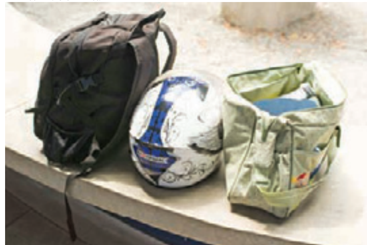
Preparado - Menor foi apreendido com as malas que iria usar na fuga

outro menor, todos de Santo André. A polícia pedirá à Justiça mandados de prisão contra os outros suspeitos. Os nomes deles não foram divulgados para não atrapalhar a investigação.