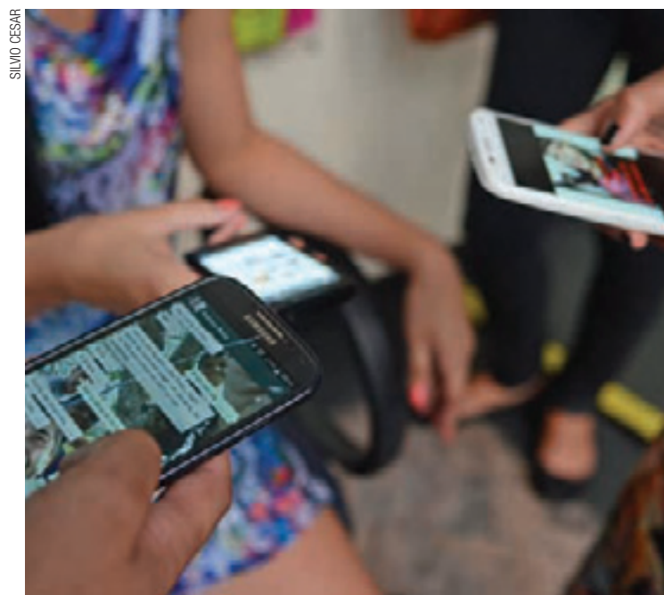
Telefonia - Empresas do setor são as campeãs em reclamações

foi o índice de reclamações contra empresas de telefonia registrado no Idecon