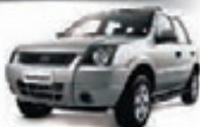
ECOSPORT XLS 1.6 05 DHD4650 - COMPLETA R$ 18.990,