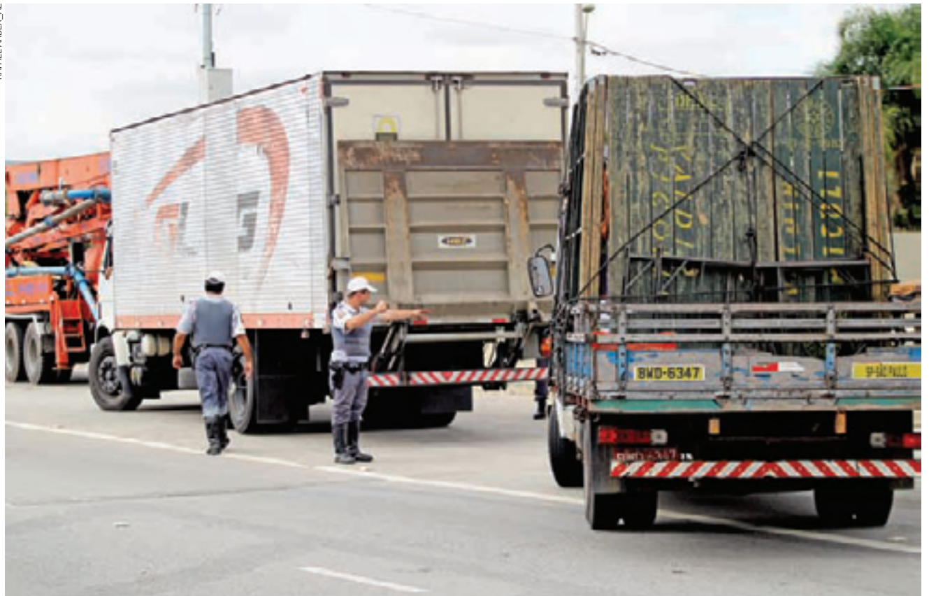
Produtividade - Polícia reteve 68 caminhões que apresentavam irregularidades e encaminhou três motoristas para delegacias

Um caminhão roubado, que transportava R$ 600 mil em produtos químicos, foi um dos primeiros veículos a serem abordados pela PM, por volta das 5h. O suspeito que guiava o caminhão conseguiu fugir.