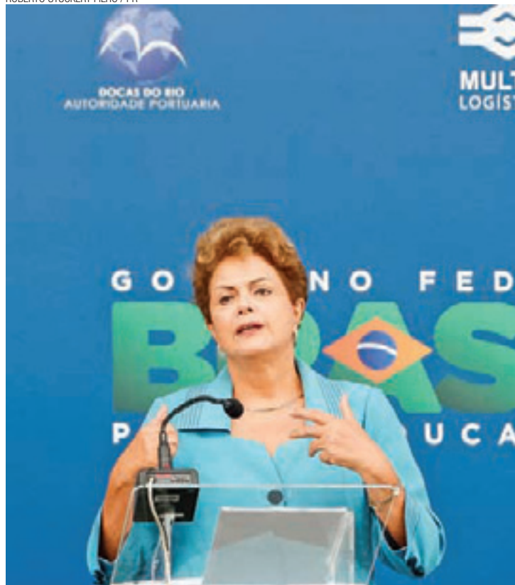
No Rio - Dilma participou da inauguração do terminal portuário