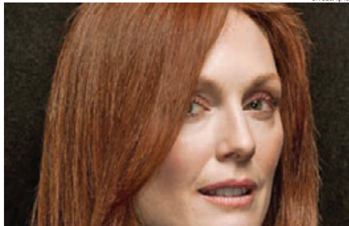
Julianne Moore - Ganhou o Oscar pelo conjunto da sua obra