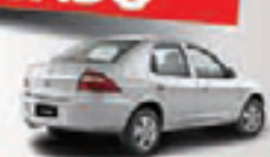
PRISMA MAXX 1.4 11 225 - AR/DH/CONJ. ELETR. R$ 23.900,