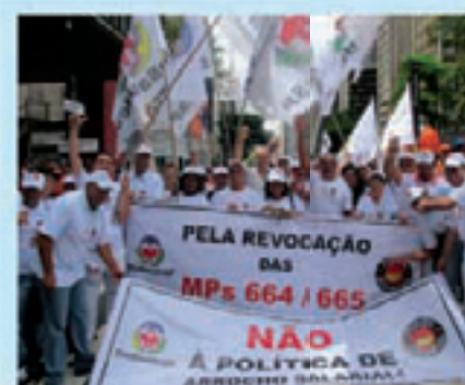
SinSaudeSP em defesa dos trabalhadores