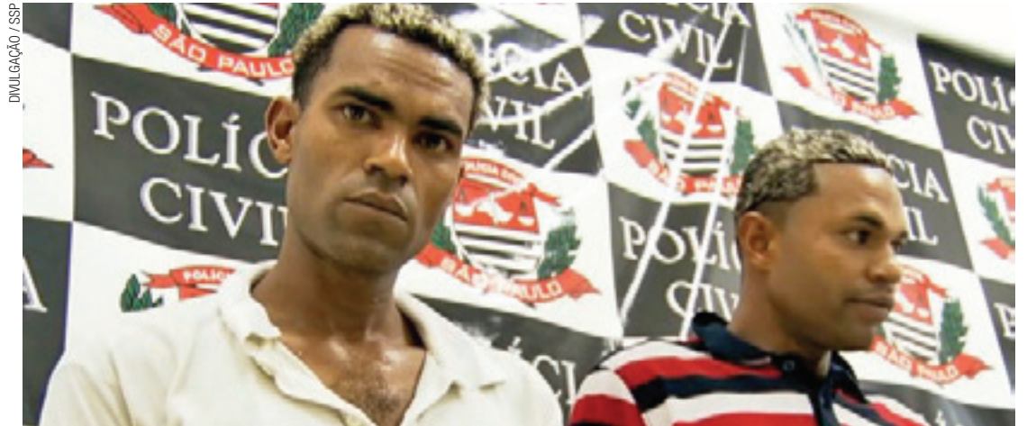
Reconhecidos - Pelo menos 15 pessoas foram à delegacia de Campo Grande e reconheceram os assaltantes

A polícia rastreou o aparelho e chegou até a casa deles, na região de Interlagos, onde foram encontradas carteiras, documentos e cartões roubados. “Cada crime é um inquérito, cada inquérito, um processo, um julgamento”, disse o delegado Francisco Solano de Santana. “Pode chegar a 15 anos por cada delito.”