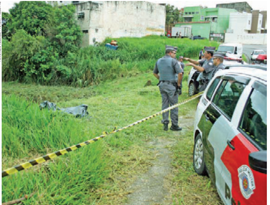
Encontrado - Para grande desespero dos familiares, o aposentado de 75 anos foi localizado sem vida