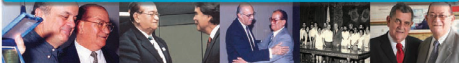
Momentos da luta política: Com o Senador José Serra, e na sequência com os Ministros da Saúde José Gomes Temporão e Dr. Adib Jatene; Governador Franco Montoro, e Deputado Federal Arnaldo Faria de Sá.