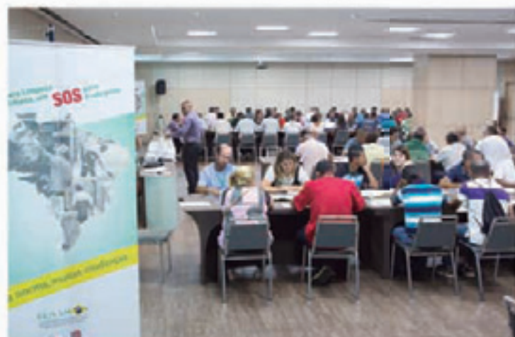
Em São Paulo, os esforços para elaboração do texto participativo

Segurança do Trabalho da Construrban começou como varredor, passou para coletor, até sofrer um acidente de trabalho. O membro inferior da perna direita foi esmagado pela prensa e a toxicidade