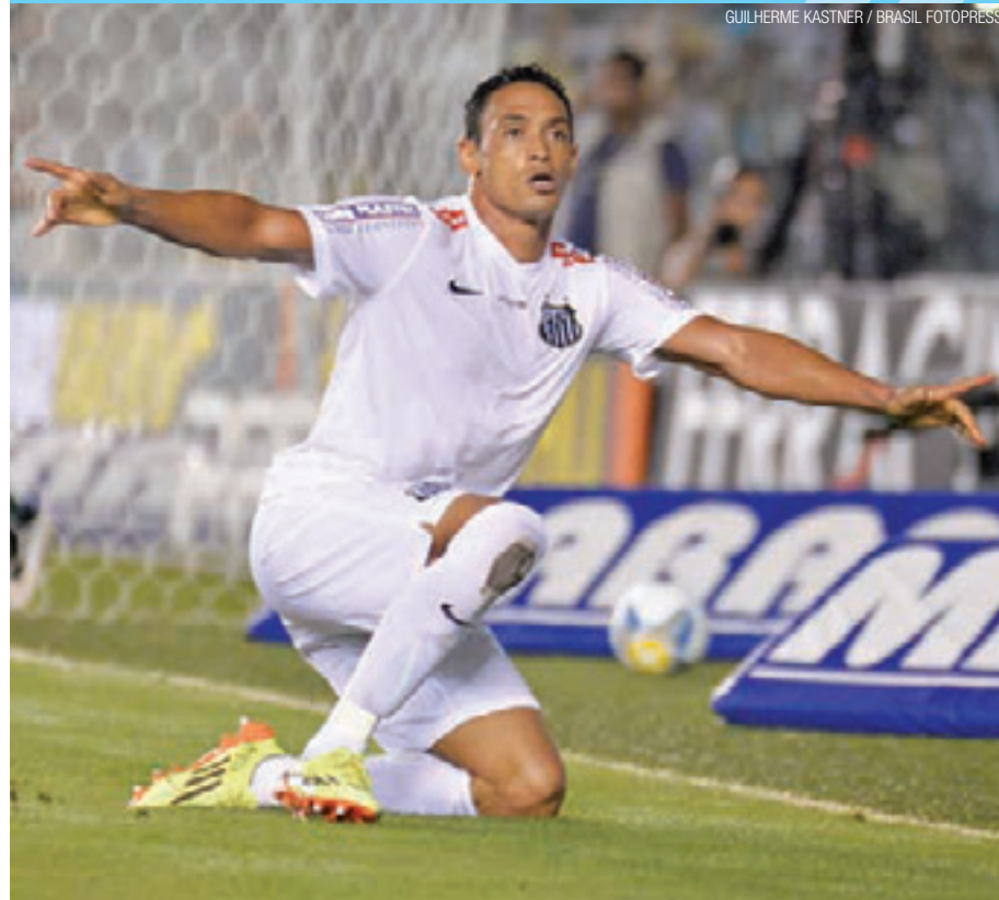
Artilheiro - Ricardo Oliveira espantou de vez a má fase: um gol e uma assistência ontem