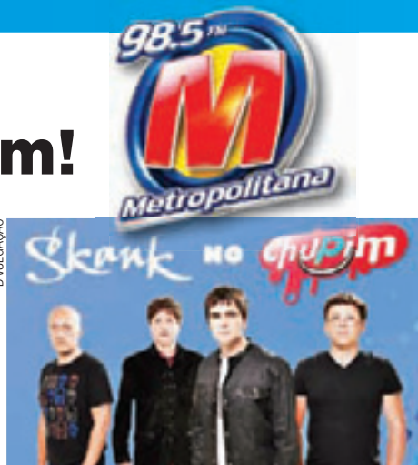
A banda mineira Skank participará ao vivo do Chupim!