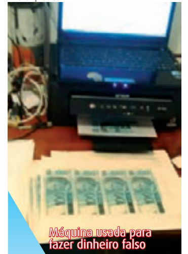
Máquina usada para fazer dinheiro falso