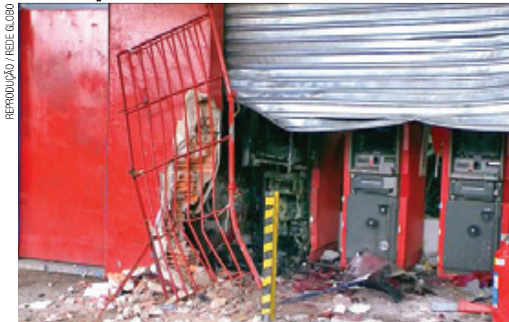
Jardim Varginha - Caixas eletrônicos do supermercado foram pelos ares

Na fuga, os criminosos fizeram disparos com um fuzil em direção a uma viatura da