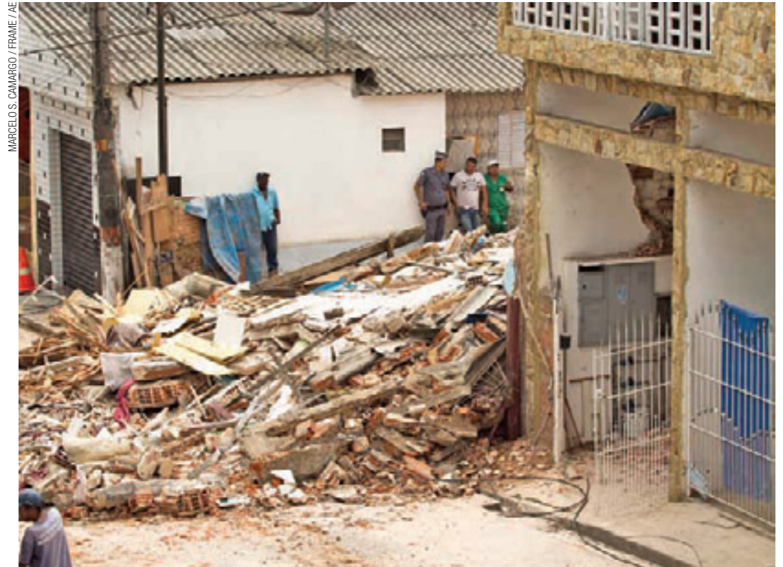
Só entulho - Retroescavadeira de obra vizinha bateu contra o imóvel, que desabou em menos de 3 minutos