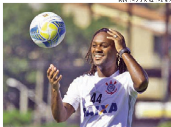
Titular - Love tem outra chance hoje, contra o São Bernardo, em casa

Tite tomou essa medida porque o confronto contra o São Bernardo tem pouco peso para a sua equipe. O Corinthians lidera o Grupo B do Campeonato Paulista e deve se classificar com sobras para a segunda fase. O treinador, inclusive, vai dar