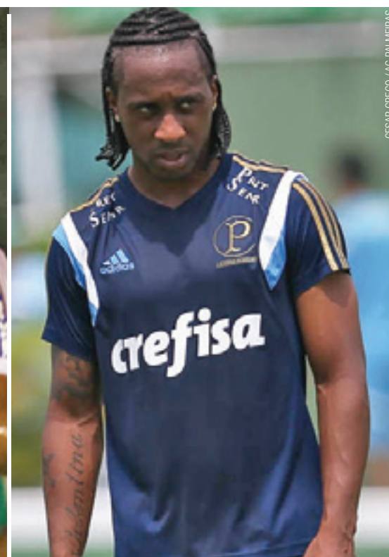
Na cola - Arouca vai grudar no artilheiro do Peixe