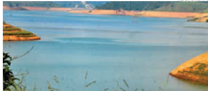
Subindo - Cantareira teve a quarta alta seguida no mês de março