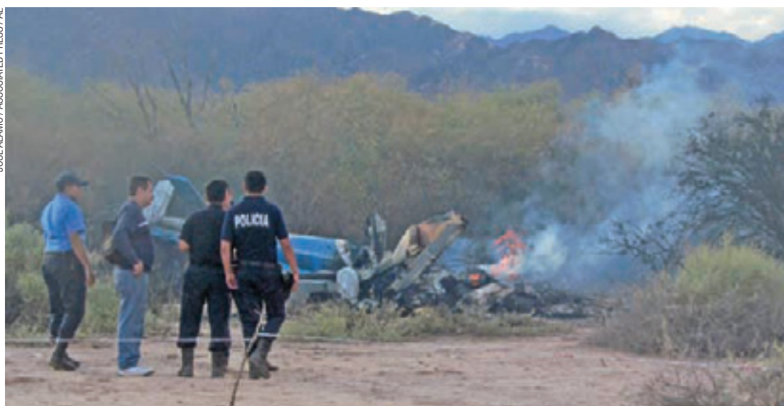
Mistério - Aeronaves se chocaram em pelo voo sem nenhuma razão aparente; clima é de consternação

Acredita-se que o acidente seja um dos piores relacionados à gravação de reality shows