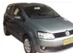
Fox 1.0 Completo - cinza - 10/11 R$ 29.900