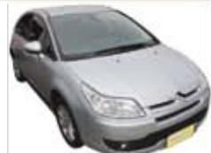
C4 GLX Hatch 1.6 Completo + Couro + ABS + Air Bag - prata - 13/13 R$ 37.990