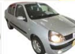
Clio 1.0 Expression 16V Flex Completo - prata - 13/14 R$ 25.990