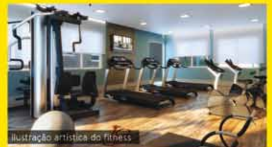
Ilustração artística do fitness

O MELHOR PREÇO POR M 2 VOCÊ SÓ ENCONTRA NO VILLA SÃO PAULO.