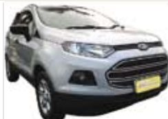
Ecosport SE Auto Power Shift 2.0 Completo - prata - 13/14 R$ 59.990