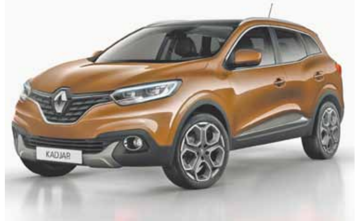
Renault Kadjar - Cheio de atitude, com conectividade e segurança

A comercialização do Kadjar se inicia em meados de 2015 na Europa e em vários países de África e da Baía do Mediterrâneo.