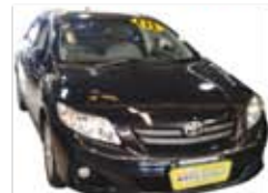
Corolla GLI 1.8 Automático Completo + Couro - preto - 10/10 R$ 47.900