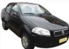
Siena 1.4 Flex Completo - preto - 12/13 R$ 32.900