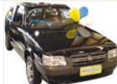
Uno Mile Fire 1.0 Básico - preto - 09/09 R$ 16.900