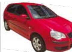
Polo Hatch 1.6 Completo - vermelho - 09/09 R$ 27.500