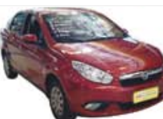
Grand Siena Completo - vermelho - 12/13 R$ 34.900