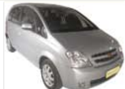
Meriva Premium Automático Completo - prata - 11/11 R$ 31.900

Fácil acesso pelo Rodoanel Saída Mauá Santo André