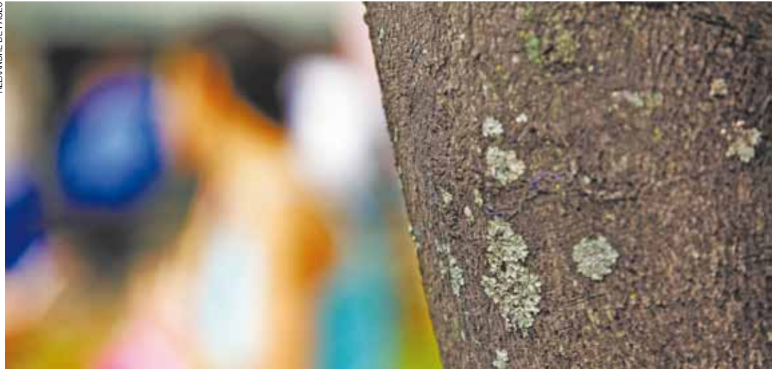
Medo - Agredidas, as vítimas preferem não mostrar o rosto, pois se sentem desprotegidas e envergonhadas