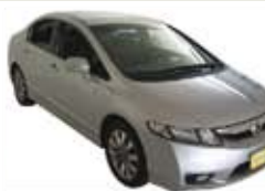
Civic LXL Automático Completo - prata - 10/11 R$ 49.900