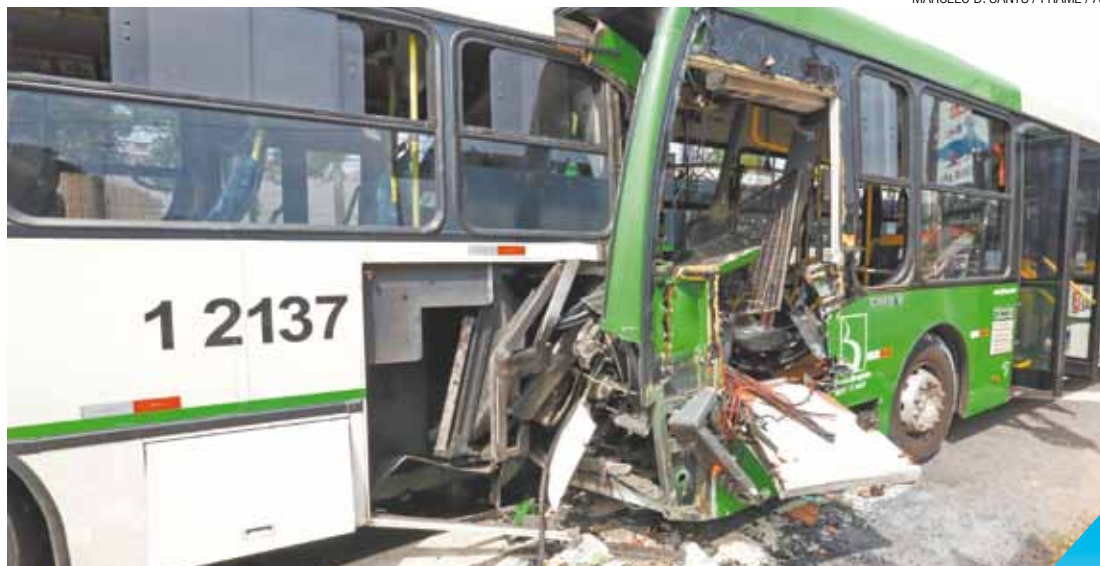
Batida feia - Ônibus perdeu o freio e colidiu de forma violenta na traseira do que estava parado

Trata-se da segunda ocorrência em que o freio do ônibus pode estar relacionado ao acidente em menos de duas semanas na capital paulista.