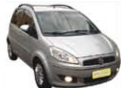
Essence Idea 1.6 Completo + Air Bag + ABS - prata - 11/12 R$ 34.900