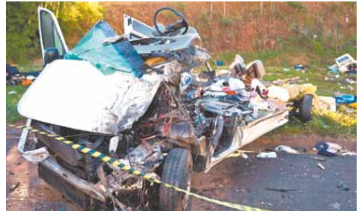
Destruição - Van ficou irreconhecível após ser "amassada" pela carreta

Somente o motorista da van sobreviveu, mas está internado em estado grave