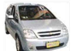
Meriva Premium Easytronic Auto 1.8 Flex - Completo - prata - 11/11 R$ 31.900