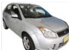
Fiesta Sedan 1.0 Completo + Som + Alarme - prata - 08/09 R$ 23.900