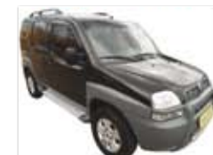
Doblo HLX 1.8 Completo - preto - 10/10 R$ 38.900