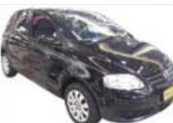
Fox 1.0 Flex Completo - preto - 09/10 R$ 24.900