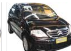
C3 1.4 Completo - preto - 11/11 R$ 26.900

(11) 4977-9000 autoshoppingglobal.com.br