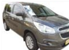
Spin LT Automático Air Bag + ABS + Rodas - cinza - 12/13 R$ 43.900