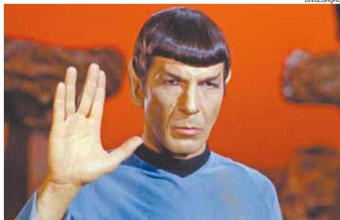
Leonard Nimoy - O célebre Spock, da série "Jornada nas Estrelas"

Com as mãos levantadas e abertas em V entre o anular e o médio, Nimoy/Spock eternizou a saudação vulcana, que ele disse ser baseada nos gestos usados por clérigos judeus para dar as bênçãos. Em seu último registro escrito, Nimoy tuitou: "A vida é como um jardim. Momentos perfeitos podem ter acontecido, mas não preservados, exceto na memória". Vida longa e próspera, Mr. Spock!