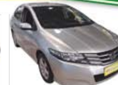
City LX 1.5 Mecânico Completo - prata - 10/11 R$ 39.900