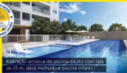
Ilustração artística da piscina adulto com rala de 25 m, deck molhado e piscina infantil.