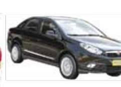
Gran Siena Direção + Vidro - preto - 12/13 R$ 35.900