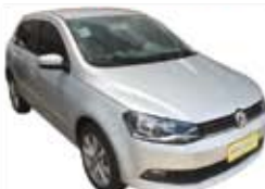
Gol G6 1.0 Flex Completo - prata - 12/13 R$ 28.990