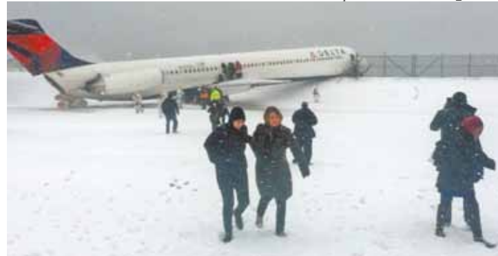
Correndo - Passageiros se afastam rapidamente do avião pela neve

O Corpo de Bombeiros de Nova Iorque informou que alguns passageiros apresentavam ferimentos leves, que eram tratados no local, mas que ninguém havia sido levado ao hospital. Os passageiros foram retirados da aeronave pelos escorregadores e levados de ônibus para o terminal. A empresa não havia informado se havia ou não feridos.