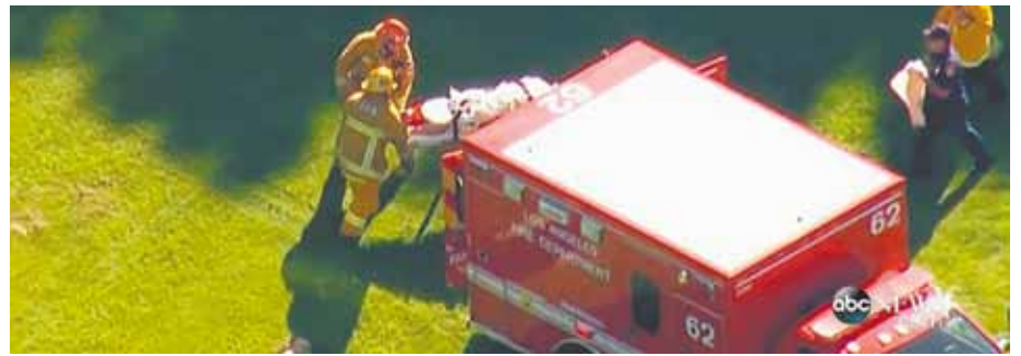
Acidente - O Vintage espatifado no campo de golfe; Ford é socorrido pelos bombeiros