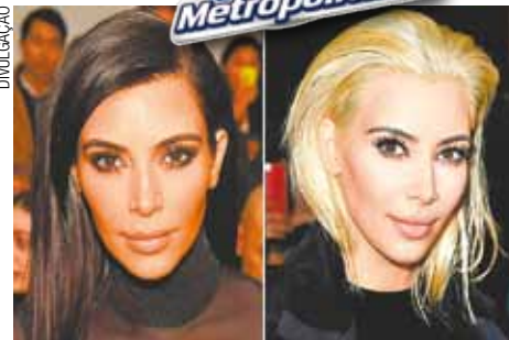
Kim Kardashian radicalizou!!!