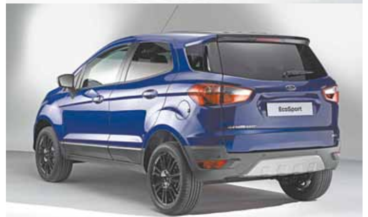
Novidade - Versão europeia do EcoSport não possui o estepe traseiro e a porta foi revisada para facilitar a abertura parcial em espaços limitados

Linha passará a oferecer sistema de navegação e câmera de ré