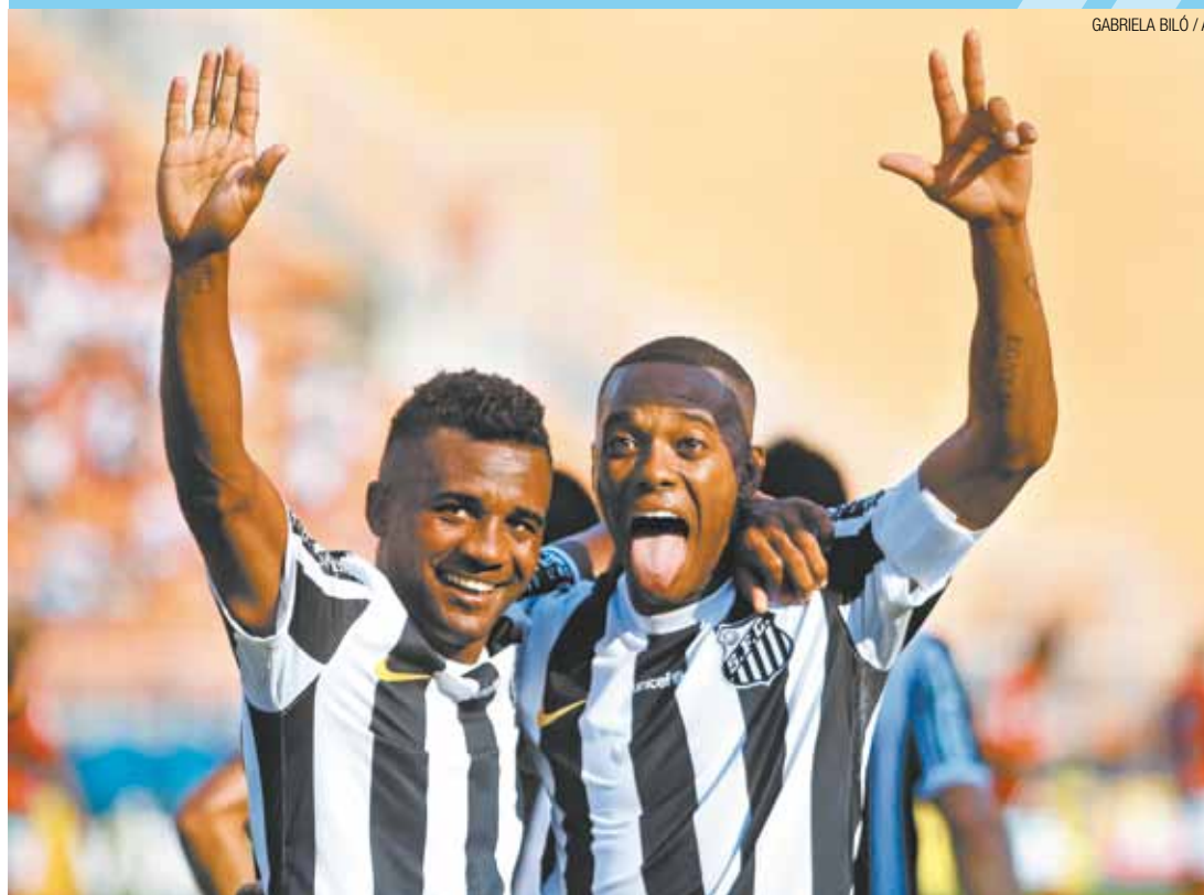
Botou na roda - O craque santista pintou e bordou na vitória de 3 a 1 sobre a Portuguesa ontem pelo Paulistão

Prepare sua família para a crise econômica de 2015