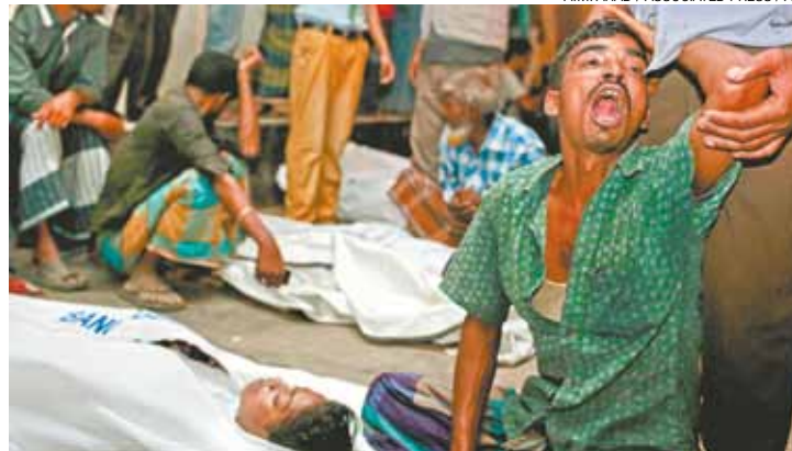
Perda - Familiares das vítimas lamentavam a fatalidade com a embarcação