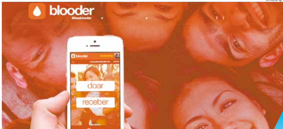
Eficiência - Estudantes criaram o aplicativo para unificar dados dos bancos de sangue da Grande SP e Rio

A Fundação Pró-Sangue, instituição pública ligada à SES, mantém um "placar" eletrônico no site ( http://www.prosangue.sp.gov.br/ ), onde informa seu estoque de sangue diário. No dia da realização desta reportagem os estoques de sangue O+, O- e A- eram críticos. Para efeito de comparação a quantidade de bolsas de O- ideal é 65 e o estado é considerado grave quando este número é menor do que 44 bolsas/dia.