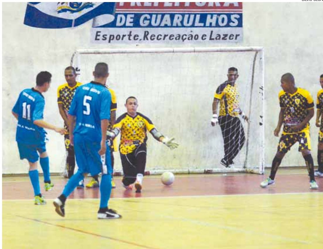
Carimbo - Camisa 11 Bolacha abriu caminho do time da Vila Maria para a finalíssima da 6ª edição do torneio

Depois de mais de um mês com 60 jogos de futsal, a Copa Montana chega ao fim, com uma grande decisão. Neste ano, o torneio beneficente que tem o apoio da Folha Metropolitana e da Secretaria de Esportes, reuniu 62 equipes. Cada uma doou pelo menos três cestas básicas. Os alimentos serão entregues ao Fundo Social de Solidariedade, ao Grupo Espírita Esperança e à Igreja Betel de Guarulhos.