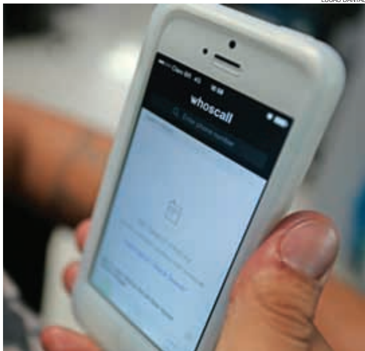
Novidade - Aplicativo deve ser utilizado por 10 milhões de brasileiros

“No Brasil, percebemos que há uma grande demanda para proteção de privacidade nas ligações móveis: telemarketing, golpes ou trotes ofensivos”, declarou Marcos Gomes, representante da Camp Mobile no País. A base de dados é formada por números disponíveis em listas telefônicas, na internet, em bancos de dados públicos e por tags relacionadas pelos próprios