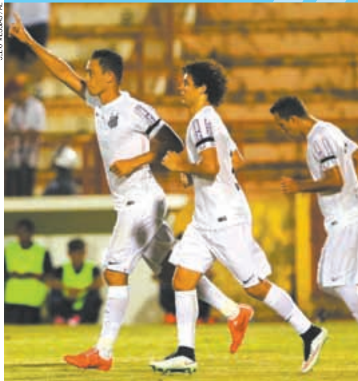
Fora de casa - Peixe bateu o Red Bull Brasil em Ribeirão Preto