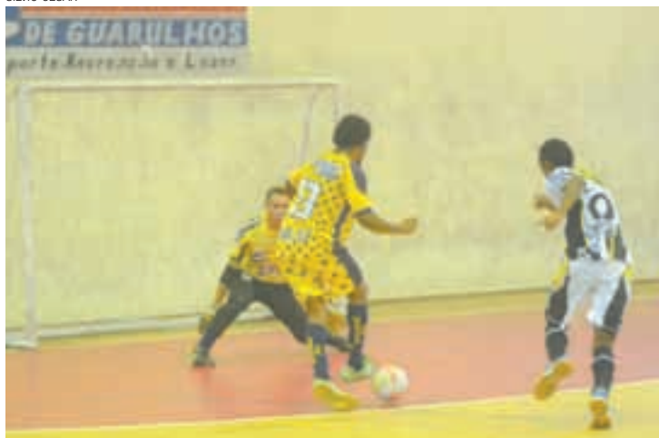
Pedreira - Jogador do Pilantras (amarelo) dribla o goleiro do Barra Mansa

disputa uma vaga na grande final será entre Sem Opção e Cosmos. Os dois times golearam equipes guarulhenses nas quartas. O Sem Opção eliminou o Sacode por 7 a 3; e o Cosmos ganhou do Bizas/Moôloko por 6 a 2. As semifinais acontecem no dia 21 de fevereiro. O horário ainda não está definido.