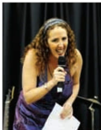
Sánchez: "Saber Inglês valoriza o currículo, aumenta as oportunidades no mercado de trabalho"

Inscrições abertas para novas turmas no Projeto Inglês para São Paulo