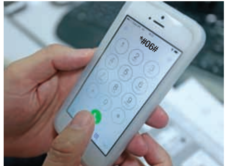
Digite o código - E depois guarde o número do Imei em lugar seguro

Agora o bloqueio poderá ser feito diretamente junto à autoridade policial. Para isso, o usuário deverá fornecer o número do Imei do seu celular