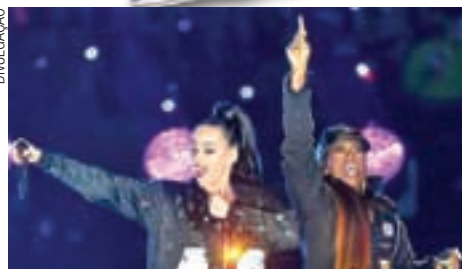
Sucesso absoluto depois do Super Bowl