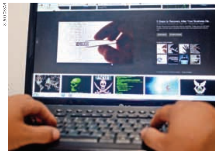
Cuidado - Preste muita atenção no golpe das falsas promoções