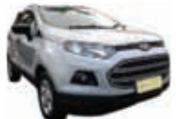
Ecosport SE Auto Power Shift 2.0 Completo - prata - 13/14 R$ 59.990