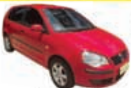
Polo Hatch 1.6 Completo - vermelho - 09/09 R$ 27.500