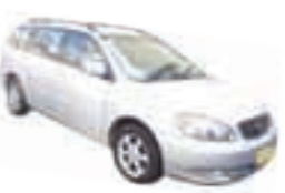
Fielder XE1 1.8 Completo - prata - 07/07 R$ 29.900