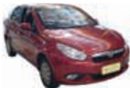
Grand Siena Completo - vermelho - 12/13 R$ 34.900