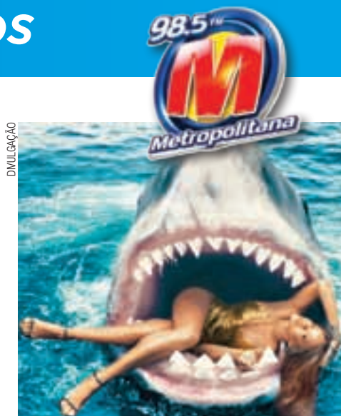
Rihanna faz ensaio fotográfico em homenagem ao filme "Tubarões"

O ensaio foi feito em homenagem aos 40 anos do filme "Tubarões" e a revista chega às bancas americanas no dia 17 de fevereiro.