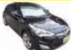
Veloster Automatic Top de Linha + Couro - preto - 12/12 R$ 57.900