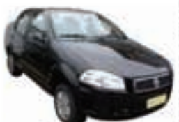
Siena 1.4 Flex Completo - preto - 12/13 R$ 32.900

(11) 4977-9000 autoshoppingglobal.com.br