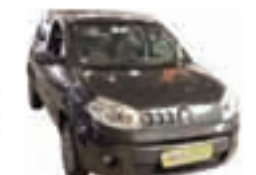
Uno Vivace 1.0 Completo - cinza 13/13 R$ 25.900