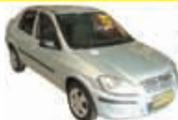
Prisma MAXX 1.4 Completo - prata - 10/10 R$ 23.900