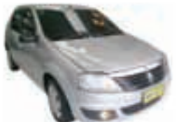
Logan Expression 1.0 Completo - prata - 12/12 R$ 24.900