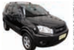
Ecosport XLT 1.6 Completo + Rodas - preto - 08/09 R$ 33.900