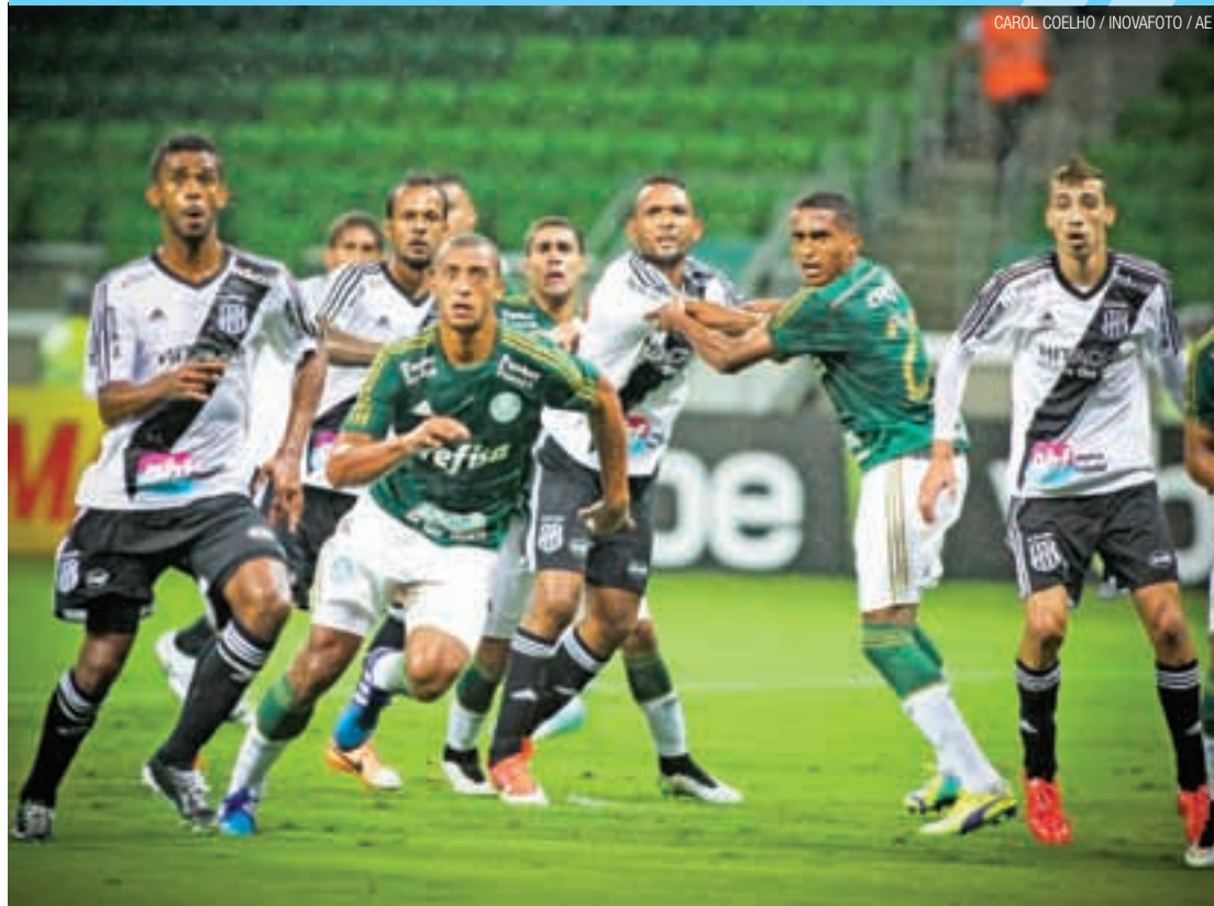
CAROL COELHO / INOVAFO / AE