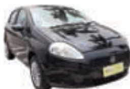
Punto 1.4 DH + VE + TE + LDT - preto - 09/10 R$ 25.990