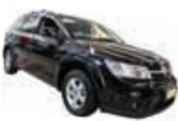
Freemont Emotion Auto 2.4 Completo - preto - 12/12 R$ 66.900