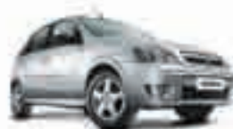
CORSA 50 WIND - 04 PL-2142 - VE/TE/LTT R$ 13.590,