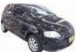
Fox 1.0 Flex Completo - preto - 09/10 R$ 24.900