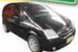
Meriva Joy Completo - preto - 12/12 R$ 30.980