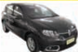
Sandero Expression Easy Auto 1.6 Completo - preto - 14/15 R$ 43.000