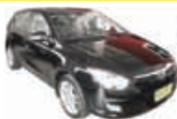
i-30 Manual Completo - preto - 11/12 R$ 41.890