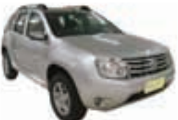
Duster 4X2 1.6 Completo - prata - 12/13 R$ 46.900