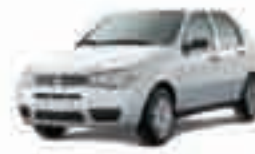
PALIO FIRE 4 P - 09 PL-7804 - AR/DH/CONJ. ELÉTR. R$ 18.900,