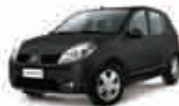
SANDERO EXPRESS 1.0 16V FLEX - 11 PL-3681 - DH R$ 20.900,