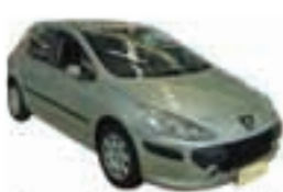
Peugeot 307 Presence Pack 1.6 Completo - prata - 07/08 R$ 23.900