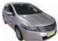
City LX 1.5 Mecânico Completo - prata - 10/11 R$ 39.900