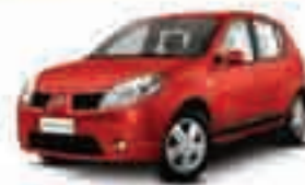
SANDERO - 11 PL-3728 - SEM ENTRADA R$ 18.900,