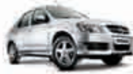
PRISMA JOY 1.0 - 11 PL-2517 - IMPECÁVEL R$ 18.800,