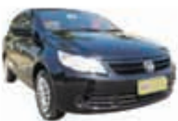
Voyage Trend 1.6 Completo - preto - 13/14 R$ 35.990