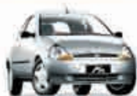
KA GL 1.0 - 07 PL-8442 - CONJ. ELÉTR. R$ 10.990,