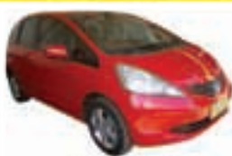
Fit LX 1.4 Flex Completo - vermelho - 08/09 R$ 33.900