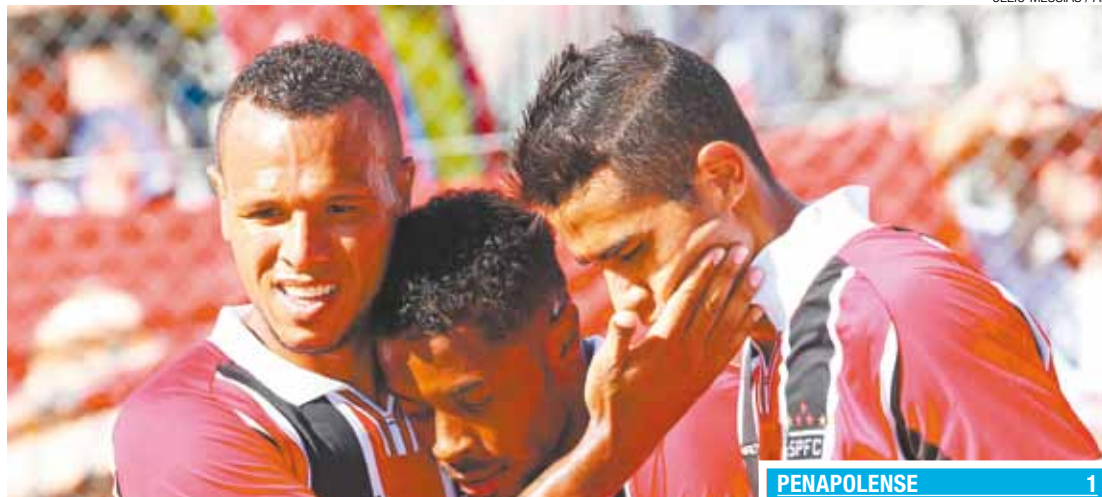
Matador - Atacante do Tricolor marcou um dos gols e mira história do clube

Na volta para o 2º tempo, Muricy substituiu Alan Kardec por Jonathan Cafu. O