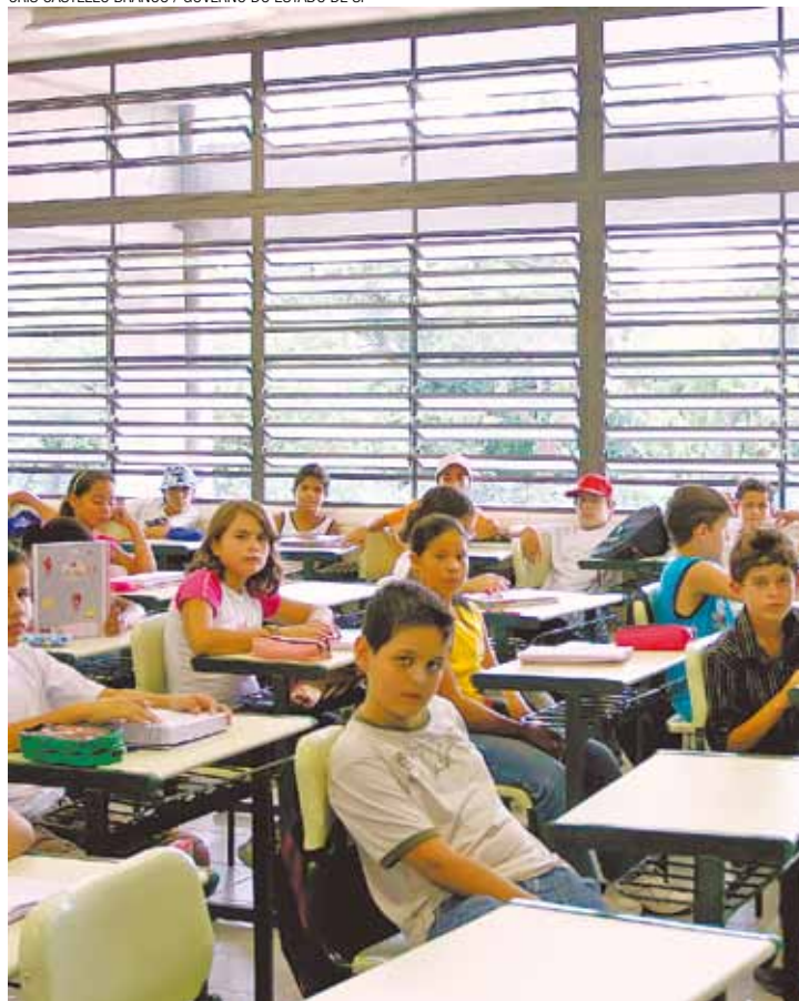
Fim das férias - Alunos voltam quarta-feira à rede municipal de ensino