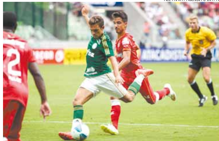
Nas graças - Desempenho do argentino agradou técnico do Palmeiras