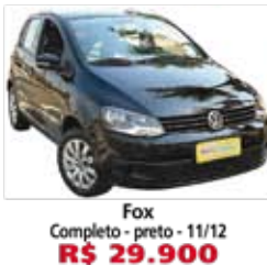
Fox Completo - preto - 11/12 R$ 29.900