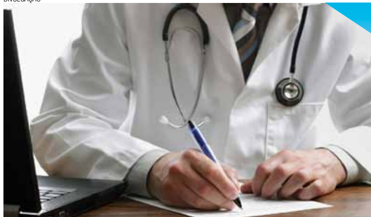
Novos médicos - Mais da metade é reprovada no exame da Cremesp