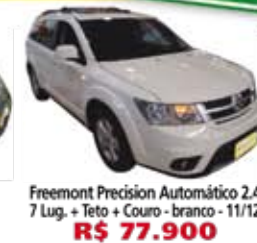
Freemont Precision Automático 2.4 7 Lug. + Teto + Couro - branco - 11/12 R$ 77.900