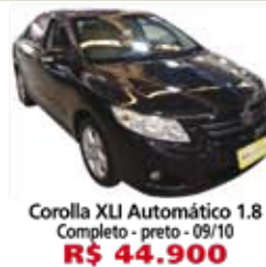
Corolla XLI Automático 1.8 Completo - preto - 09/10 R$ 44.900