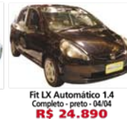
Fit LX Automático 1.4 Completo - preto - 04/04 R$ 24.890