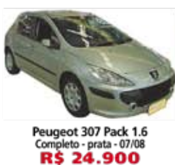
Peugeot 307 Pack 1.6 Completo - prata - 07/08 R$ 24.900