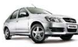
PRISMA JOY 1.0 11 PL-2517 - IMPECÁVEL R$ 18.800,