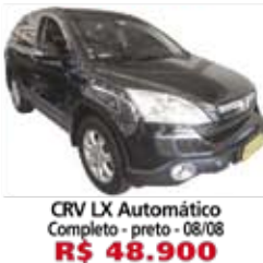
CRV LX Automático Completo - preto - 08/08 R$ 48.900