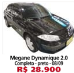
Megane Dynamique 2.0 Completo - preto - 08/09 R$ 28.900