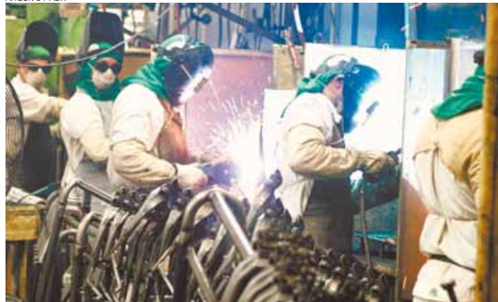
Metalurgia - Setor promete muitas demissões para o ano de 2016