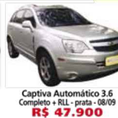
Captiva Automático 3.6 Completo + RLL - prata - 08/09 R$ 47.900