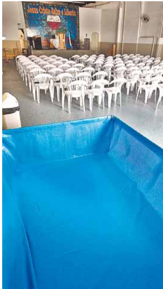
Saída drástica - Piscina está dentro da igreja