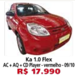
Ka 1.0 Flex AC + AQ + CD Player - vermelho - 09/10 R$ 17.990

Fácil acesso pelo Rodoanel Saída Mauá Santo André