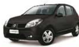
SANDERO EXPRES. 1.0 FLEX 11 PL-3681 - DH R$ 20.900,