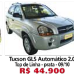
Tucson GLS Automático 2.0 Top de Linha - prata - 09/10 R$ 44.900