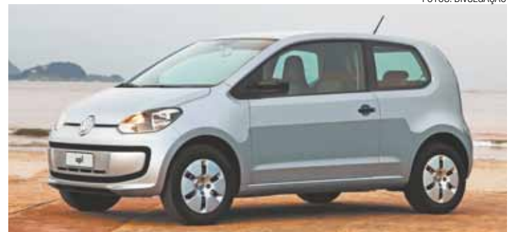
Volks Up! – Subcompacto com motor 1.0 de três cilindros: mais econômico

veículo classe 'A' pode ter uma economia superior a R$ 957 no período de um ano. Em cinco anos, o valor fica superior a R$ 4,8 mil, o que representa de 10% a 15% do valor do próprio veículo.