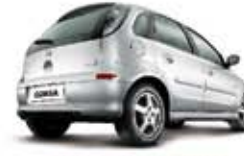
CORSA HATCH 02 PL-8389 R$ 13.990,