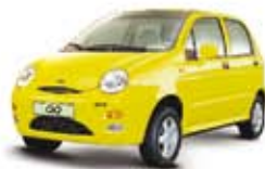
QQ 1.1 11 PL-1391 COMPL. R$ 14.990,