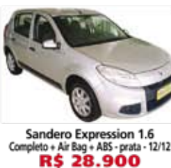
Sandero Expression 1.6 Completo + Air Bag + ABS - prata - 12/12 R$ 28.900