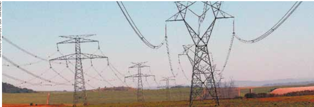
Atraso - O governo não confirma, mas a falta de mais linhas de transmissão também influenciaram

Banco Central se manifestou oficialmente sobre o aumento da energia elétrica em todo o País para 2015