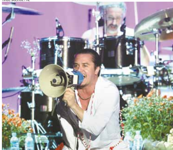
Irreverência - Os shows da banda são marcados pela descontração