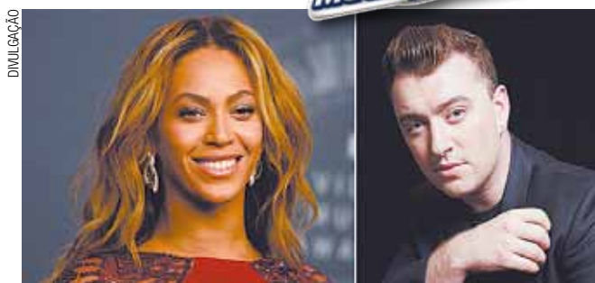
“Ela merece muito mais do que eu”

Sam concorre em cinco categorias, e pode ser um dos grandes vencedores da noite do Grammy 2015.