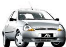
KA GL 1.0 07 PL-8442 - CONJ. ELÉTR. R$ 12.990,