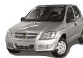
CELTA 3P 07 PL-6095 - SUPER OFERTA R$ 13.990,