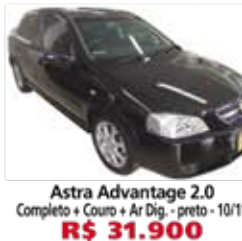
Astra Advantage 2.0 Completo + Couro + Ar Dig. - preto - 10/11 R$ 31.900