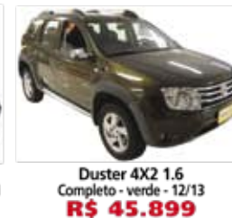
Duster 4X2 1.6 Completo - verde - 12/13 R$ 45.899

(11) 4977-9000 autoshoppingglobal.com.br