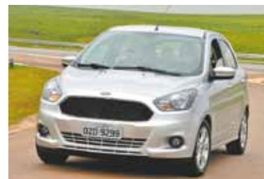
Ford Ka – Também com motor de três cilindros, está entre os mais eficientes