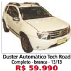
Duster Automático Tech Road Completo - branca - 13/13 R$ 59.990