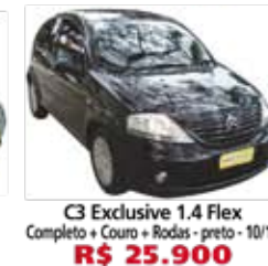
C3 Exclusive 1.4 Flex Completo + Couro + Rodas - preto - 10/11 R$ 25.900