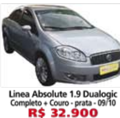
Linea Absolute 1.9 Dualogic Completo + Couro - prata - 09/10 R$ 32.900