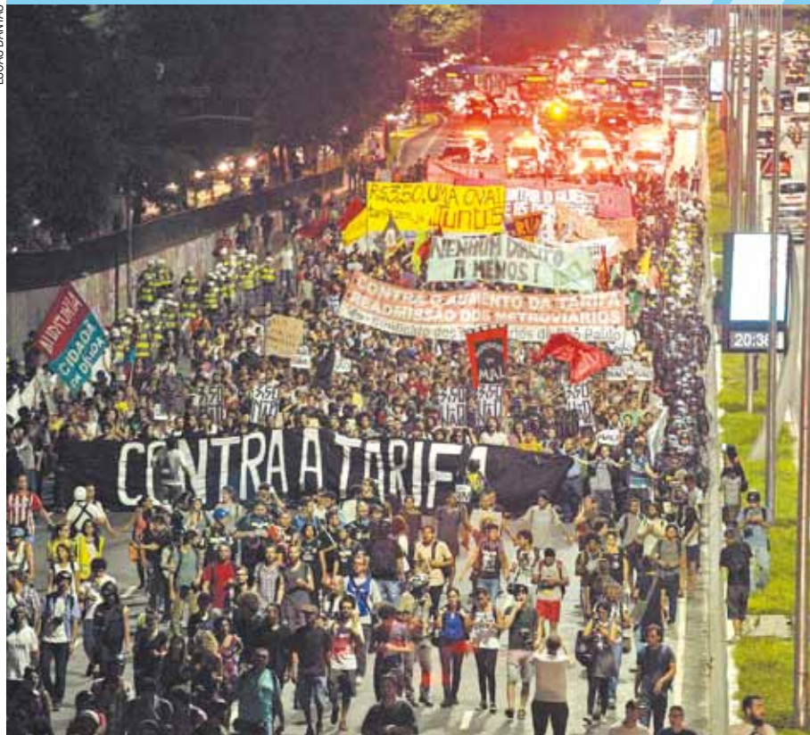
Protesto - Após passarem pela casa do prefeito, manifestantes tomam Viaduto Tutóia