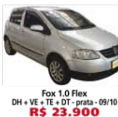
Fox 1.0 Flex DH + VE + TE + DT - prata - 09/10 R$ 23.900