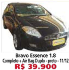
Bravo Essence 1.8 Completo + Air Bag Duplo - preto - 11/12 R$ 39.900