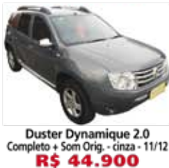
Duster Dynamique 2.0 Completo + Som Orig. - cinza - 11/12 R$ 44.900