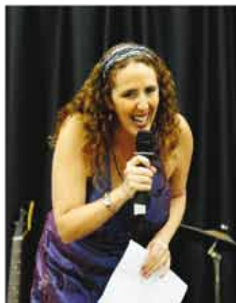
Sánchez: “Saber Inglês valoriza o currículo, aumenta as oportunidades no mercado de trabalho”

Inscrições abertas para novas turmas no Projeto Inglês para São Paulo