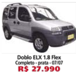
Doblo ELX 1.8 Flex Completo - prata - 07/07 R$ 27.990