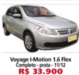
Voyage I-Motion 1.6 Flex Completo - prata - 11/12 R$ 33.900