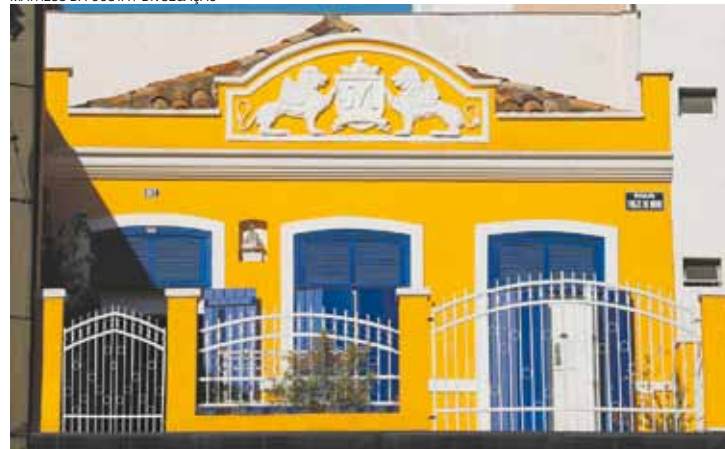
Casa Amarela - No Bixiga, uma réplica da casa dos anos 1930