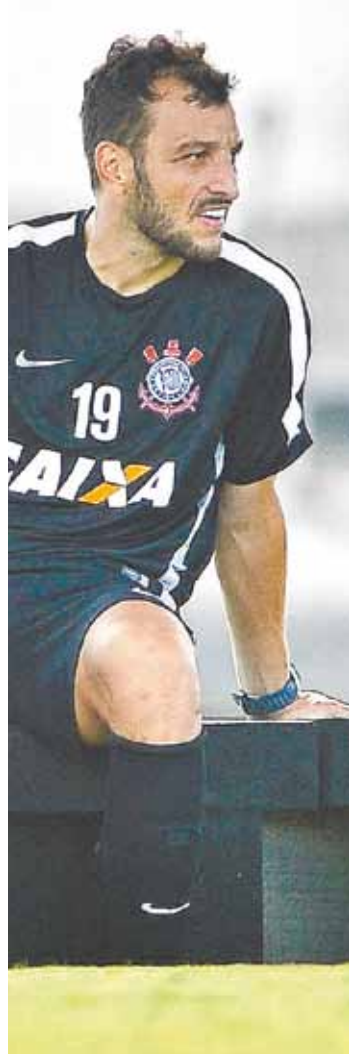
Dracena - Torção no tornozelo pode tirar o zagueiro do time