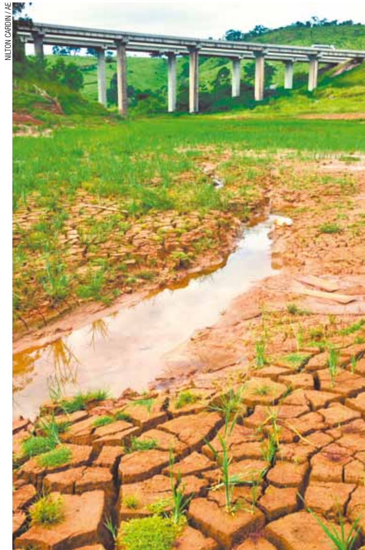
Atibainha - Represa do Sistema Cantareira está em ponto muito crítico