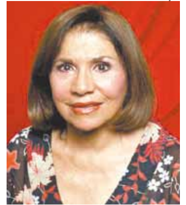
Sucessos - Vanja também cantou Meu Limão, Meu Limoeiro

Ela será enterrada hoje, no Cemitério São João Batista, em Botafogo (zona sul do Rio de Janeiro).