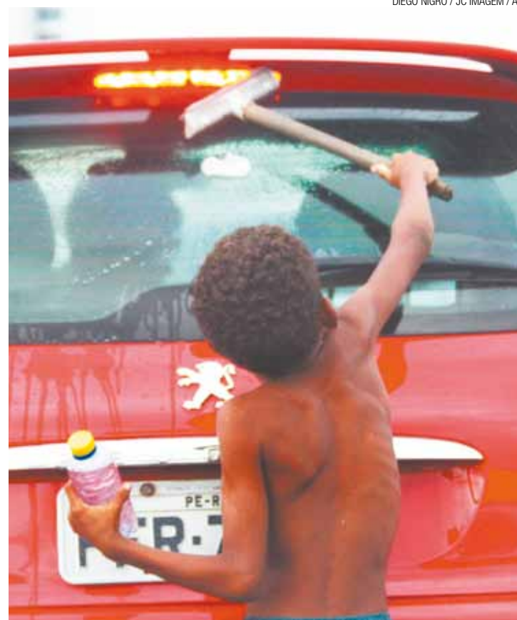
Trabalho infantil - Exploração é caminho dos mais curtos para o crime