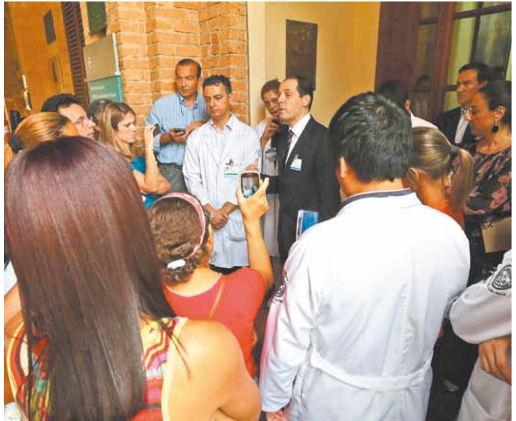
Na luta - Funcionários se reuniram para pedir a saída do provedor da Santa Casa de São Paulo

Procurada pela reportagem, a Santa Casa de São Paulo preferiu não se pronunciar sobre o protesto ocorrido ontem.