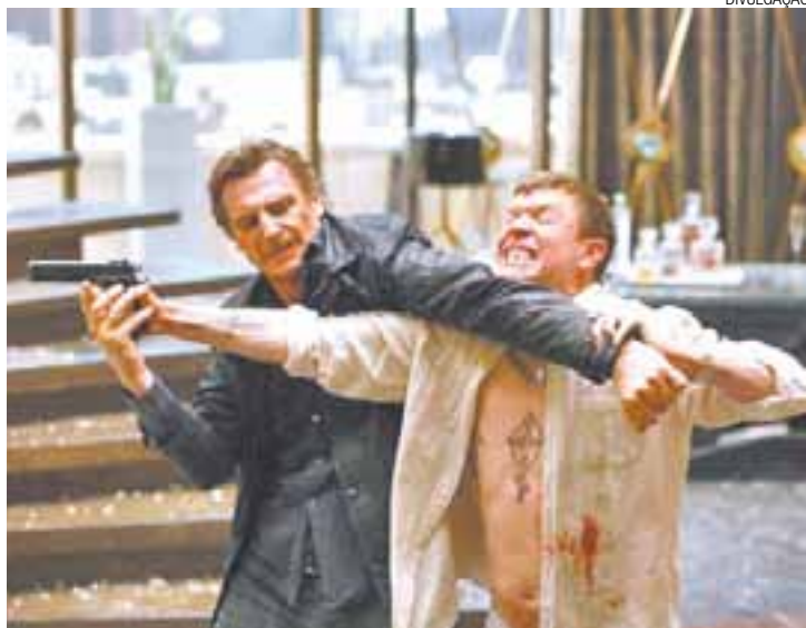
Pancararia - Liam Neeson em ação; novo filme deve repetir sucesso dos outros

ESTADÃO CONTEÚDO - Liam Neeson já tinha 15 anos de carreira, batendo e apanhando na TV e no cinema, quando Steven Spielberg fez dele o protagonista de A Lista de Schindler. Foi a primeira grande reviravolta na trajetória do ator irlandês, mas houve outra, 15 anos depois, quando ele fez Busca Implacável, em 2008. Neeson, aos 56 anos (nasceu em 1952), virou astro de ação. O filme arrebitou, mas o sucesso não se repetiu com Esquadrão Classe A, que tinha o reforço de outro queridinho do público (Bradley Cooper). Detestado pelos críticos, Busca 2 confirmou o apelo do astro na bilheteria – como Bryan Mills.