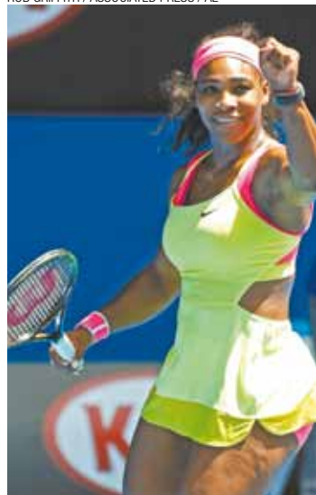
Serena - Ela arrasou a eslovaca Cibulkova com um duplo 6/2