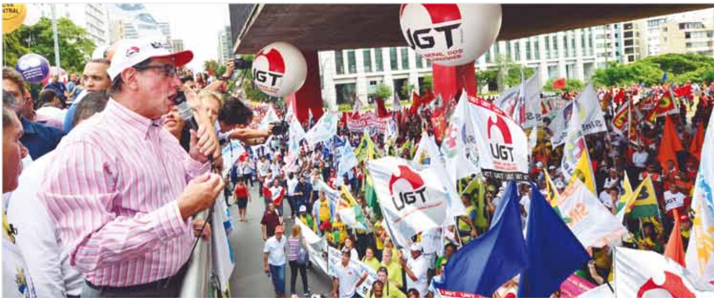
População vai às ruas exigir que o Governo Federal respeite os trabalhadores e revogue as Medidas Provisórias que retiram direitos já garantidos

O Sindicato dos Comerciários participou ativamente do Dia Nacional de Luta em Defesa dos Direitos e Emprego, que ocorreu nesta quarta-feira (28), em São Paulo, na Avenida Paulista. O ato também aconteceu em outras capitais do País e reuniu milhares de trabalhadores. A manifestação, que uniu as centrais sindicais União Geral dos Trabalhadores (UGT), CSB, CUT, CTB, Força Sindical e Nova Central, tem como objetivo pressionar o Governo Federal a revogar as Medidas Provisórias (MPs) 664 e 665, que retiram direitos assegurados dos trabalhadores, além de