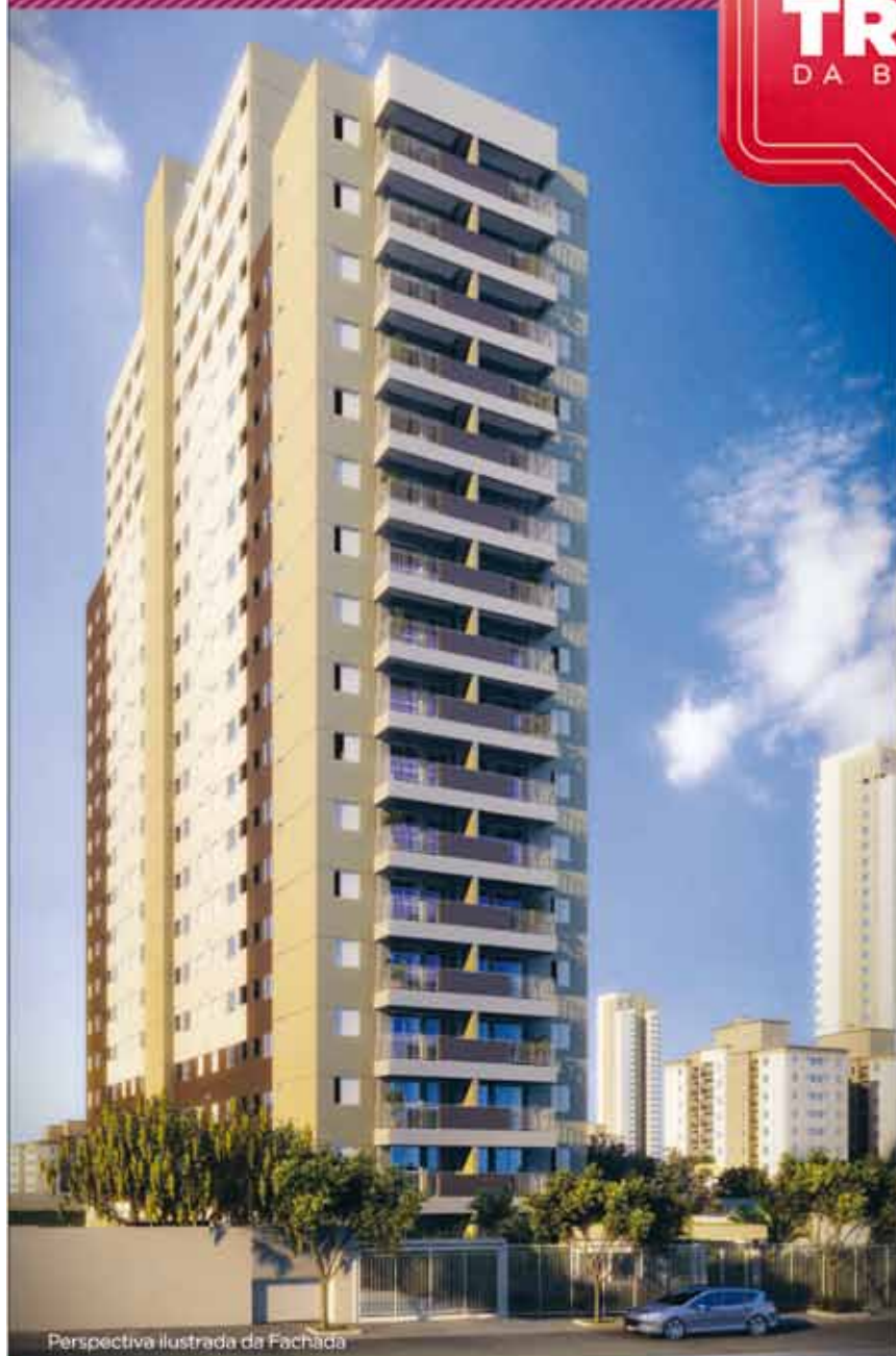
Perspectiva ilustrada da Fachada