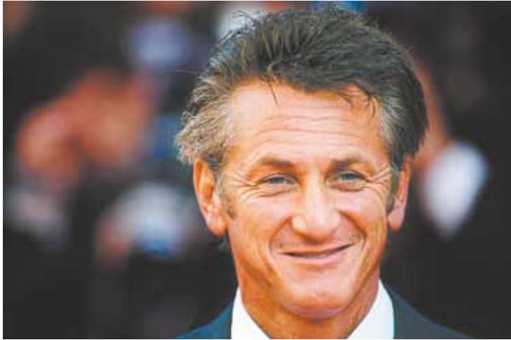
Elogios - Franceses dizem que americano é lenda viva do cinema