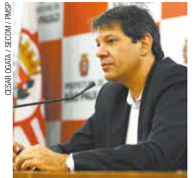
Prefeito - Diz que margens do Tietê são o futuro da cidade

Segundo o prefeito Fernando Haddad (PT), a ideia surgiu do próprio setor privado, após a empresa Time For Fun apresentar um projeto semelhante à administração municipal, orçado em R$ 140 milhões. “A nossa