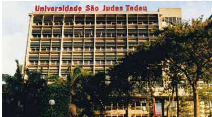
Ampliação - Universidade está com oito novos cursos de graduação

De acordo com o MEC, a São Judas é uma das cinco melhores instituições de ensino de São Paulo. “A cada avaliação, nossos indicadores avançam em qualidade acadêmica.