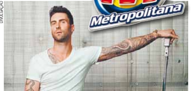
Adam Levine confirma apresentação no Oscar