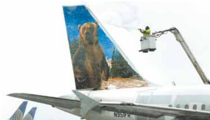
Nova Iorque - No aeroporto, funcionários retiram gelo de avião

A United Airlines cancelou todos os voos em Boston, Nova Iorque e Filadélfia. A JetBlue, que tem a maioria dos voos na região nordeste norte-americana, já cancelou cerca de um terço de toda a