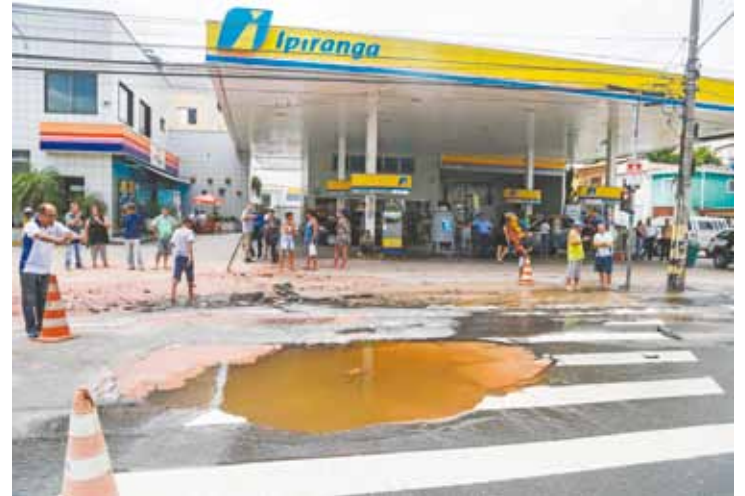
Cratera - Um motociclista caiu com a moto no buraco, mas não se feriu

A motocicleta foi retirada depois por uma escava-