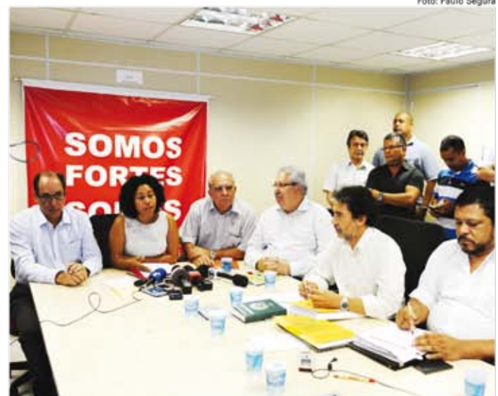
Em reunião conjunta, as Centrais Sindicais se manifestaram contra a redução de direitos trabalhistas

Mas o governo precisa respeitar os acordos firmados, e não pode transferir o ônus da crise econômica para os trabalhadores.