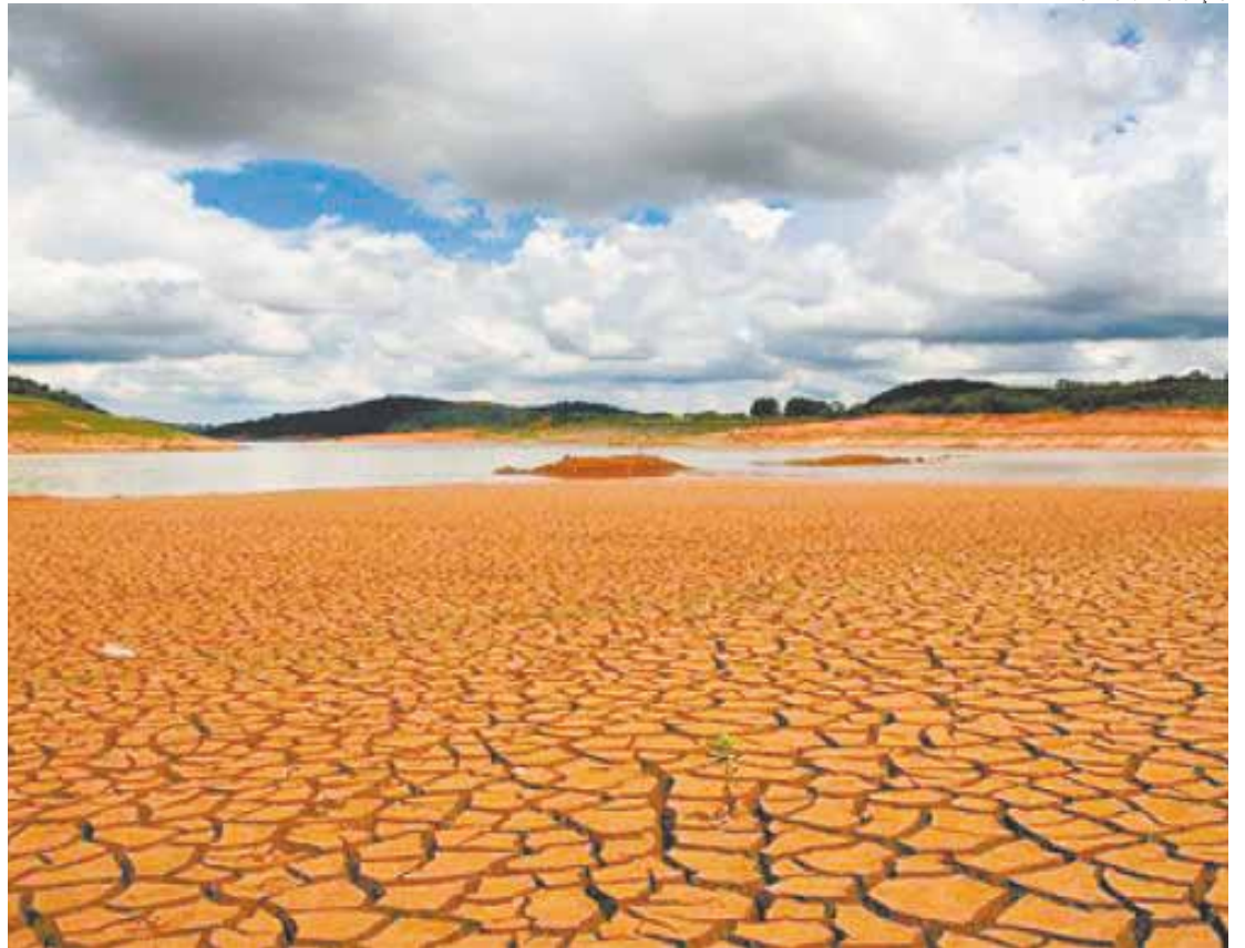
Boa notícia - Nos reservatórios que formam o Sistema Cantareira o nível ficou estável ontem em 51%

Pela quinta vez ocorreu elevação no nível do Sistema Rio Claro que passou de 27,3% para 27,4%. A retenção de água de chuva está em 156,1 mm ante a média histórica de 298,9 mm.