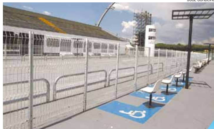
Assentos garantidos - Foliões podem comprar pela internet