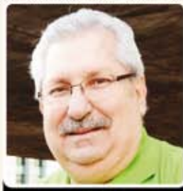
Antonio Neto Presidente da CSB

Milhares de trabalhadores vão às ruas em todo o País para protestar contra as medidas provisórias que alteram e limitam a concessão de benefícios como pensão por morte, auxílio-doença e seguro-desemprego, entre outros. Tomada na calada da noite, a decisão é infeliz e vai contra as promessas do governo de manter o diálogo e não mexer nos direitos trabalhistas. Além disso, as medidas não vão reduzir as desigualdades sociais.