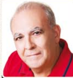
Miguel Torres Presidente da Força Sindical

Nós, trabalhadores e trabalhadoras, estamos atentos e dispostos a lutar por empregos e direitos. Ou seja: onde houver demissões, haverá manifestações e, se necessário, greves. Defendemos o diálogo e a negociação, mas não vamos aceitar que empresas multinacionais, que receberam enormes benefícios fiscais do governo e remeteram bilhões em lucro as suas matrizes no exterior, ao primeiro sinal de dificuldade demitam em massa.