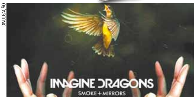
"Shots" é a música que abre o novo CD do Imagine Dragons

"Smoke + Mirrors" chega às lojas em 17 de fevereiro com 13 faixas inéditas.