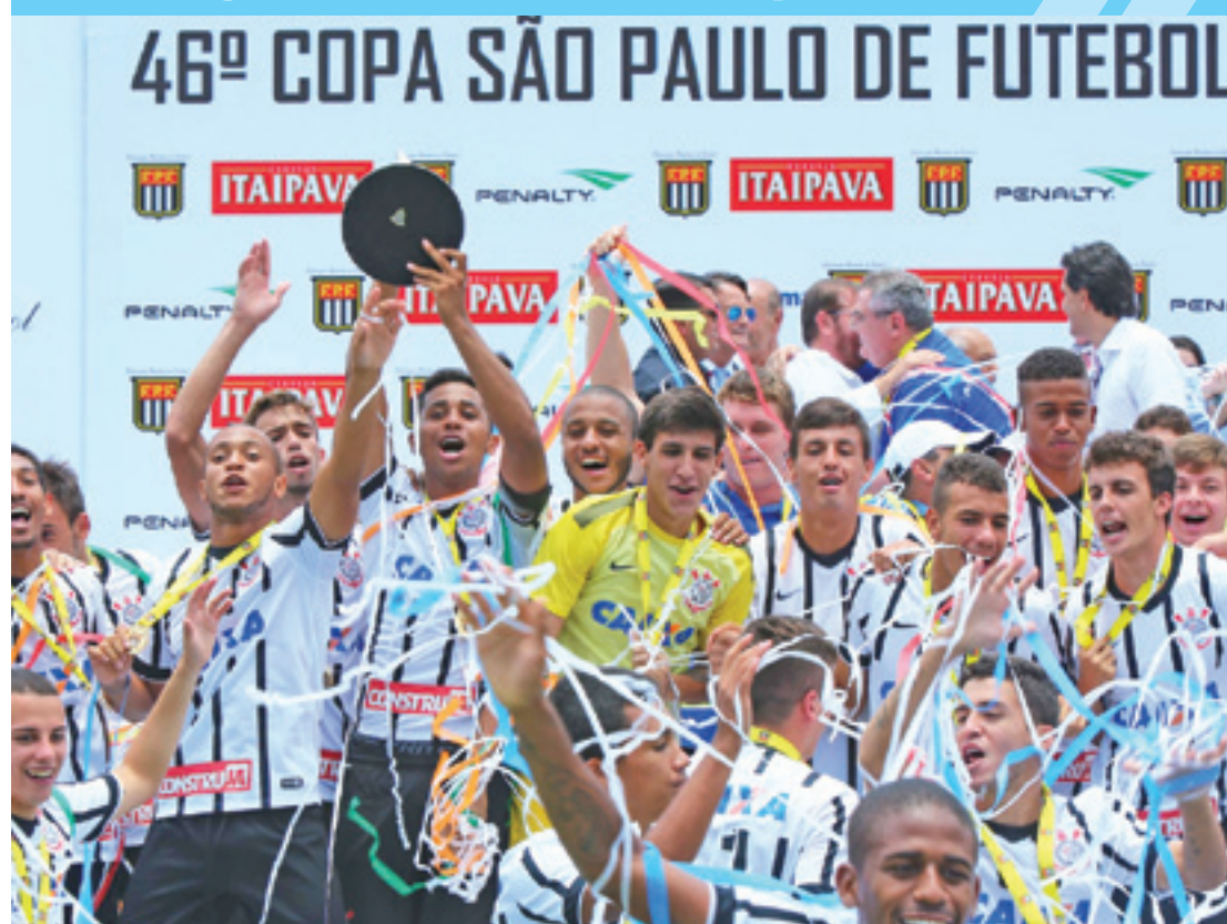
Comemoração - Jogadores corintianos erguem o troféu e vibram com o título da Copa São Paulo

Timão ganha 9º título da Copinha Pág. 16