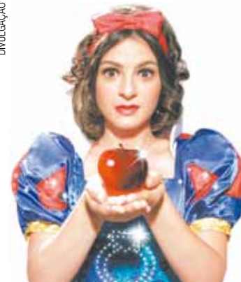
Musical - Adaptação teatral fiel ao desenho original de Walt Disney