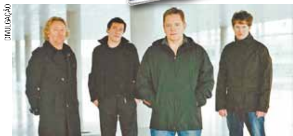
Para a alegria dos fãs, New Order lança novo álbum no segundo semestre de 2015

Em entrevista a banda revelou que já existem duas faixas prontas, "Plastic" e "Restless".