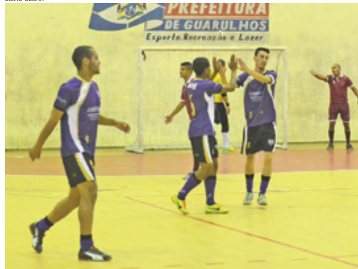
Vitória - Jogadores do Bizas comemoram primeiro gol contra Kry Kry