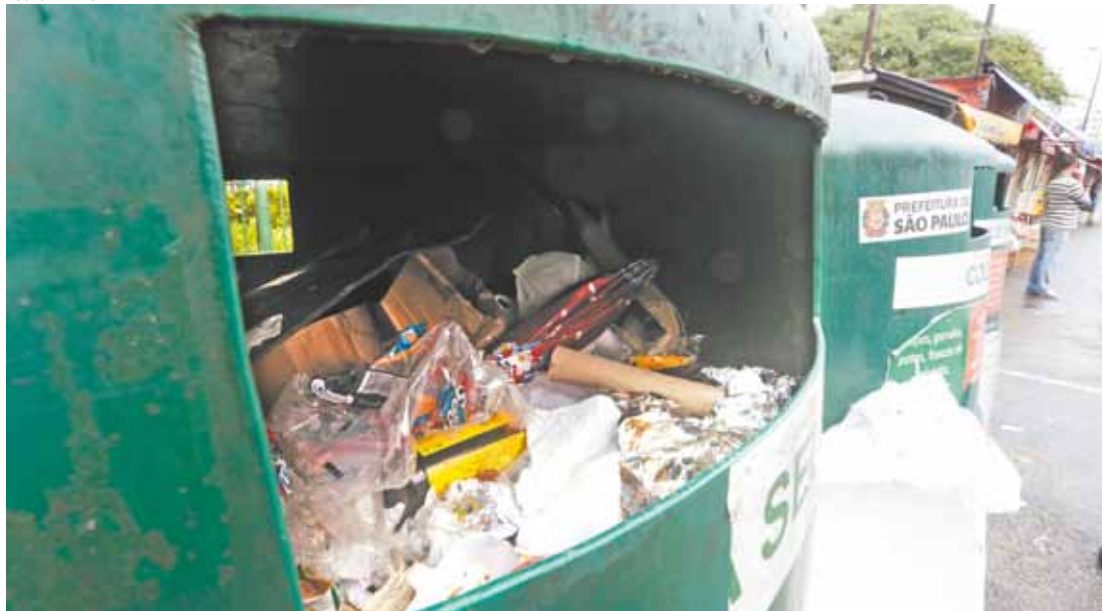
Junto e misturado - Lixo orgânico e material não reciclável vão parar em PEV do Terminal Jabaquara