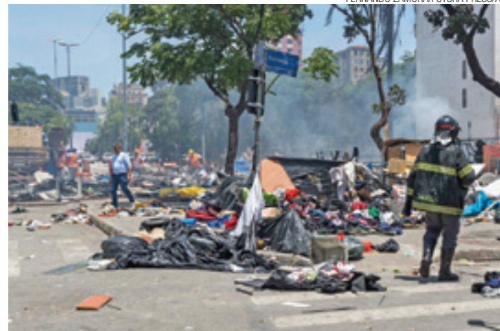
Destruição - Barracos foram incendiados como forma de protesto