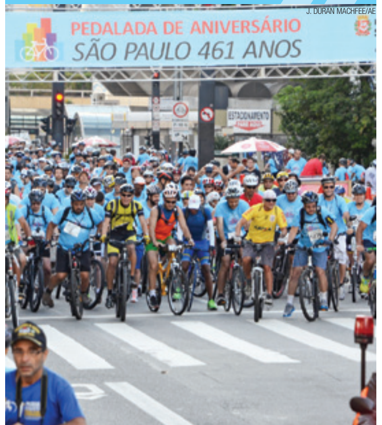
461 anos - Pedalada na Avenida Paulista pelo aniversário da cidade

No período de férias é preciso ter cuidado com as crianças