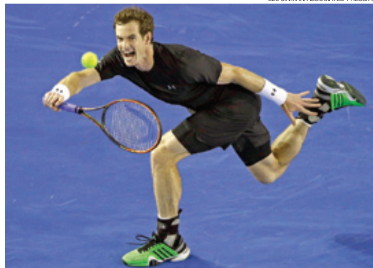
Dureza - Andy Murray sofreu para derrotar o búlgaro Grigor Dimitrov