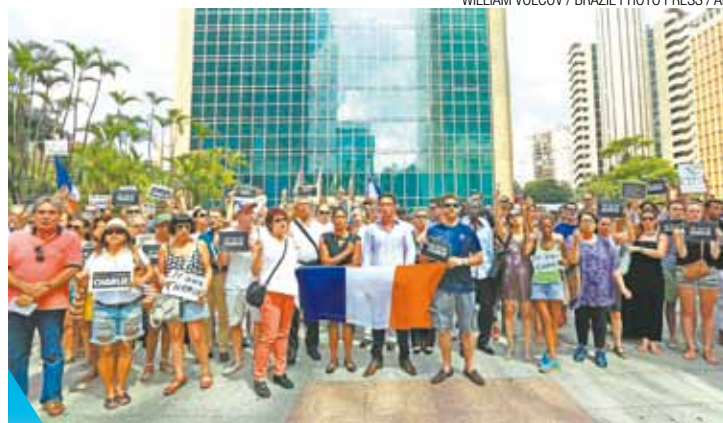
Ato - Passeata solidária em São Paulo foi tranquila e silenciosa