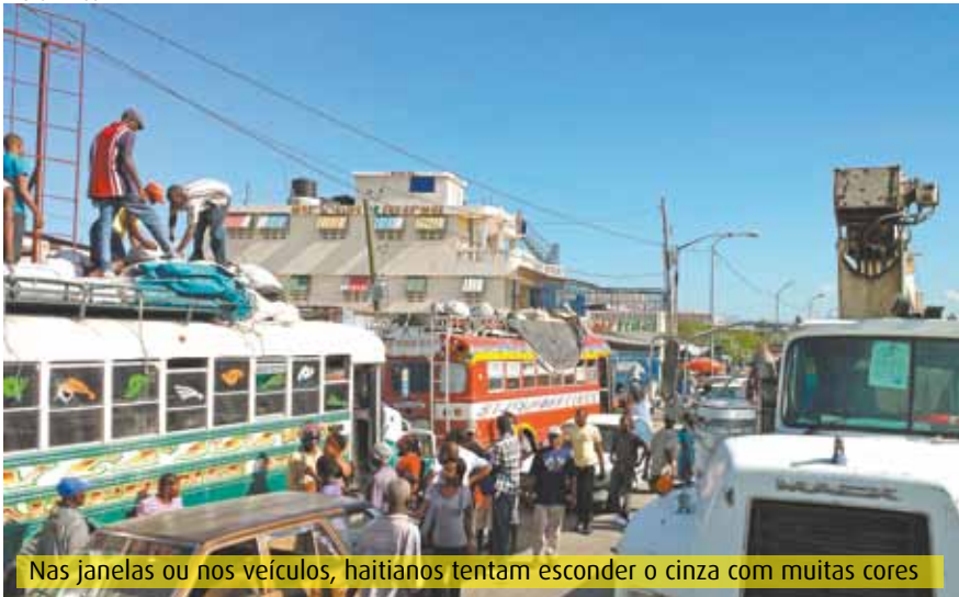
Nas janelas ou nos veículos, haitianos tentam esconder o cinza com muitas cores