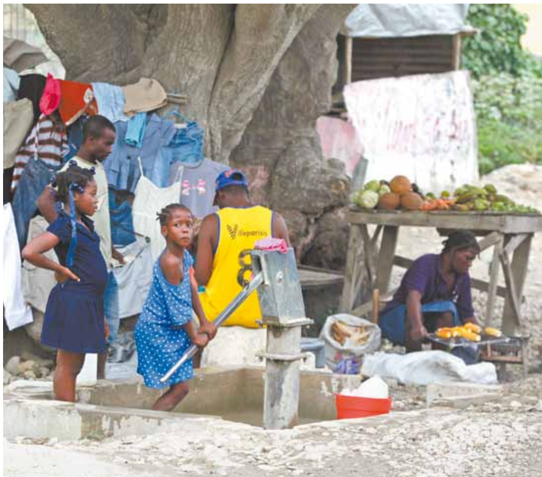
Garota bombeia água imprópria para consumo: lençol freático está poluído