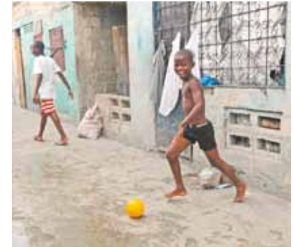
Garoto joga bola nas ruas sujas