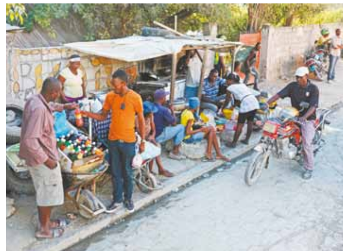
Bons de papo, ambulantes vendem de tudo em suas barracas