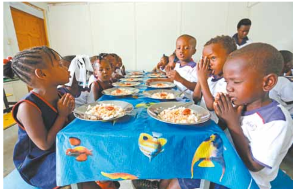
Freiras do Sagrado Coração de Jesus oferecem instrução e duas refeições diárias a 170 crianças