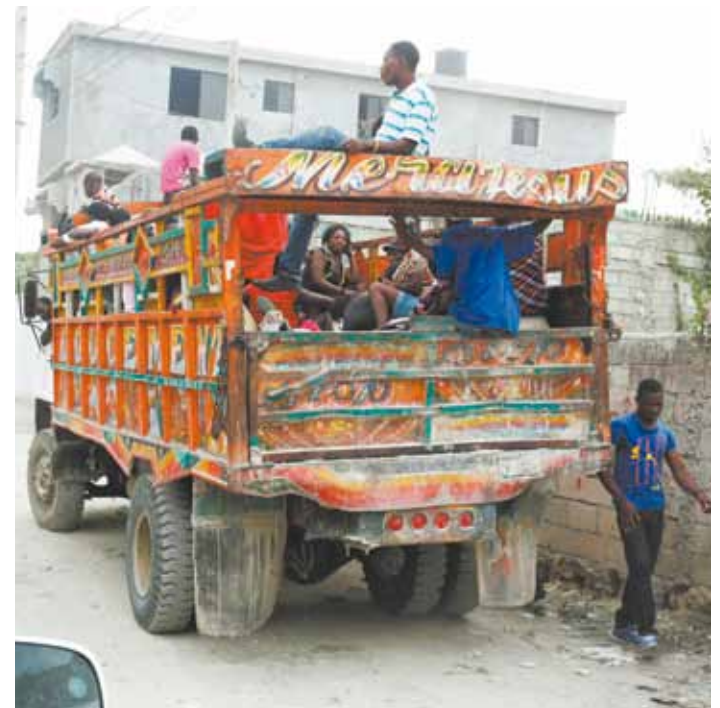
Improvisado, sistema de transporte é bastante perigoso