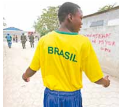
Jovem haitiano exhibe as cores do Brasil