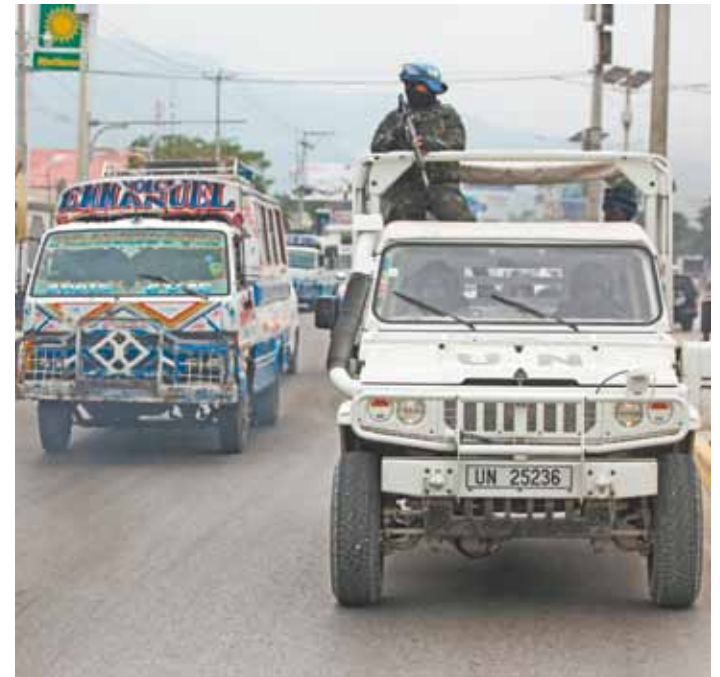
Haitianos parecem acostumados com soldados armados nas ruas