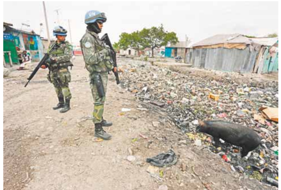
Militares fazem patrulhas diárias em áreas violentas para manter sensação de segurança