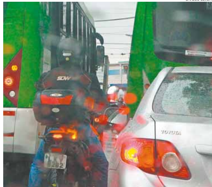
Retomada - Hoje voltam as restrições para circulação de veículos

Operação estava suspensa desde o dia 24 de dezembro