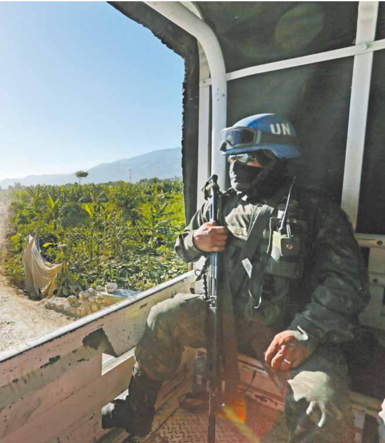
Intensa poeira, ambiente fica insalubre para pedestres e soldados durante as patrulhas