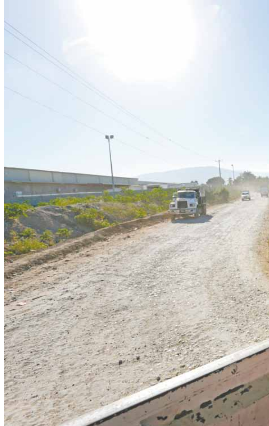
Sol escaldante já nas primeiras horas da manhã; nas esburacadas ruas de terra, sob