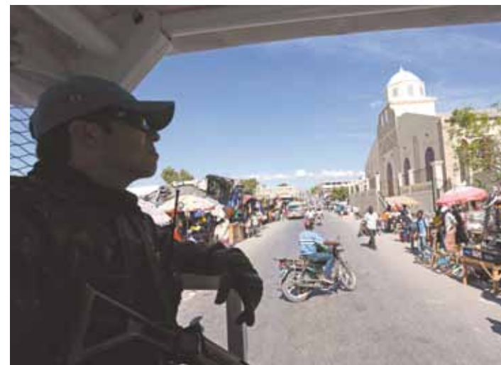
Comércio ambulante e precário é intenso durante todos os dias