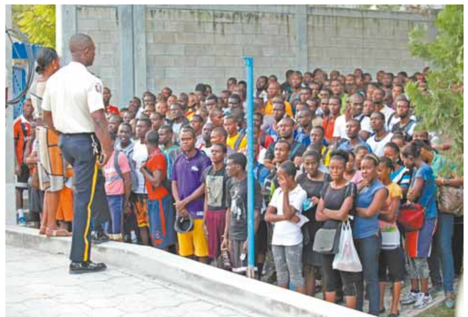
Civis encaram seleção por vagas na Polícia Nacional do Haiti: processo de fortalecimento