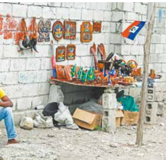
Arte e cultura local e lembra terremoto e revolução