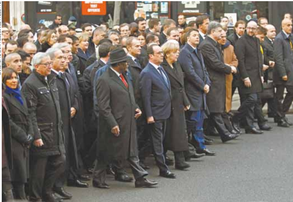
Iguais - Chefes de Estado de todo o mundo participaram da marcha em Paris em protesto contra o terrorismo