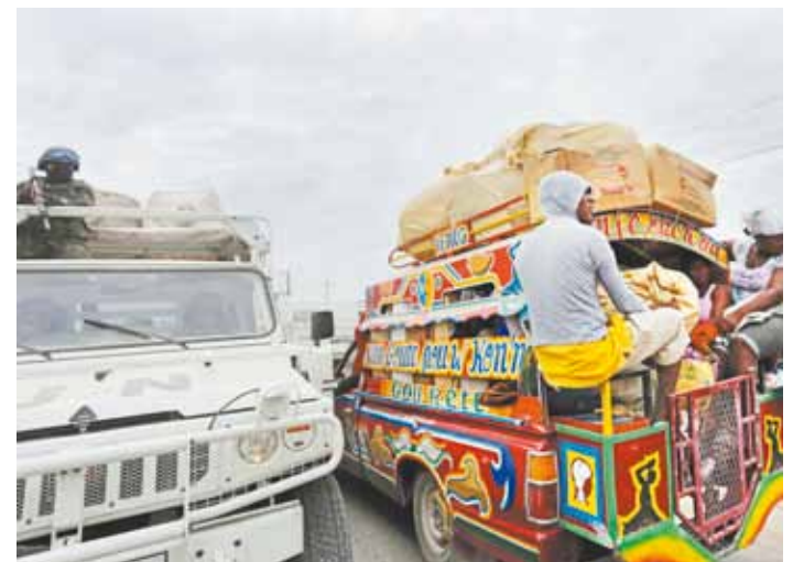
Trânsito "maluco" é prova de fogo para motoristas estrangeiros