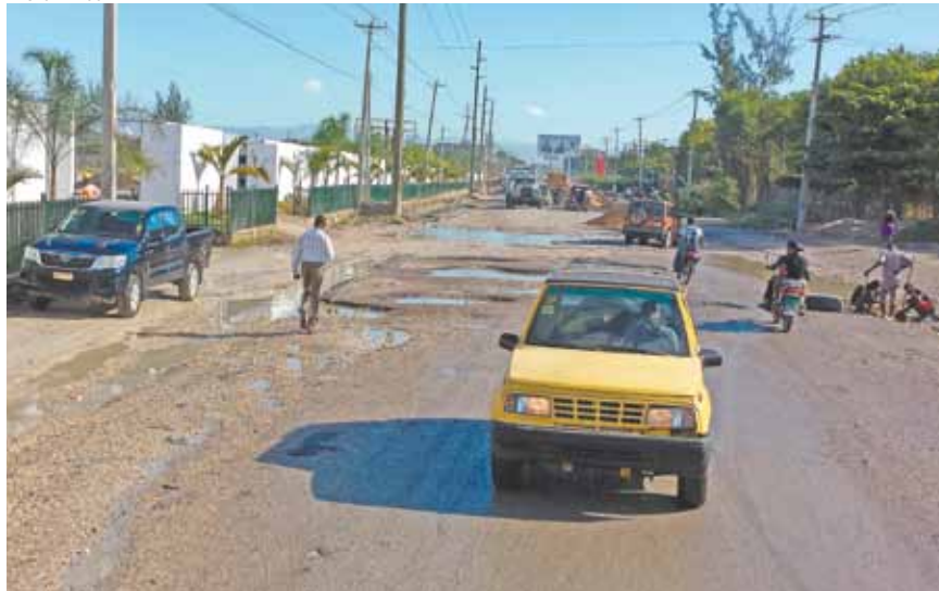
Ruas sujas, com esgoto a céu aberto e cheiro forte: rotina dos moradores de Porto Príncipe