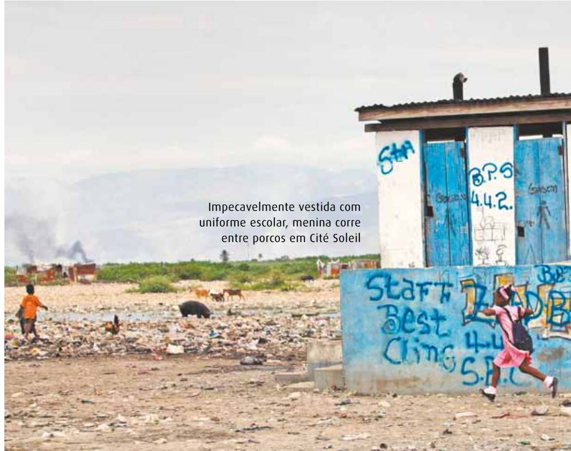
Impecavelmente vestida com uniforme escolar, menina corre entre porcos em Cité Soleil