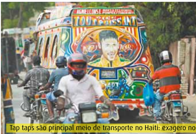
Tap taps são principal meio de transporte no Haiti: exagero nos enfeites e na precariedade; à direita, vista da Base Militar General Bacellar, onde ficamos hospedados em Porto Príncipe