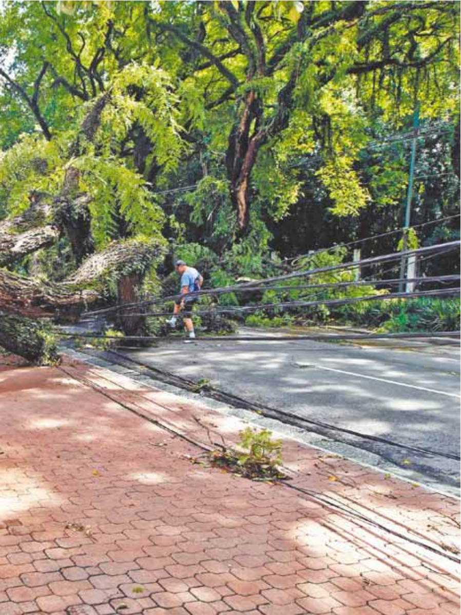
Ipiranga, a forte chuva causou a queda da árvore e deixou a região sem energia elétrica