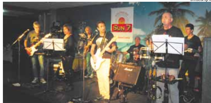
Família - Banda Sun 7 promete sucessos de rock de diversas épocas