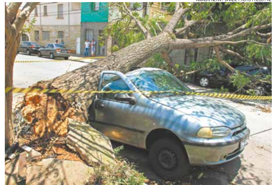
Xavier de Almeida - Rua no Ipiranga, bairro que teve maior índice de chuva