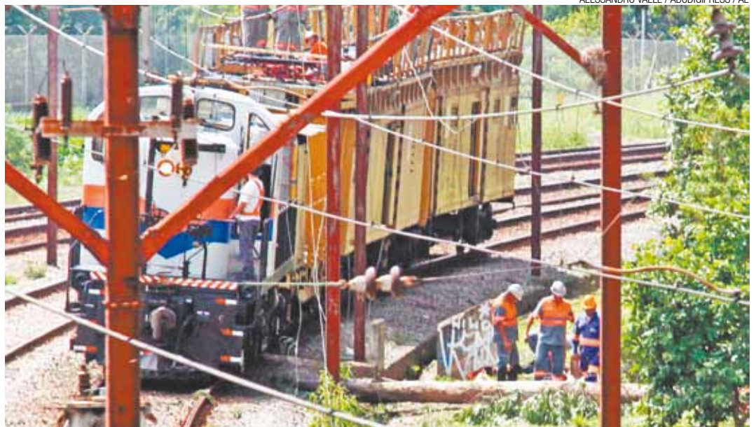
CPTM - Linha 10-Turquesa teve nove estações fechadas depois de um tronco cair sobre o ramal