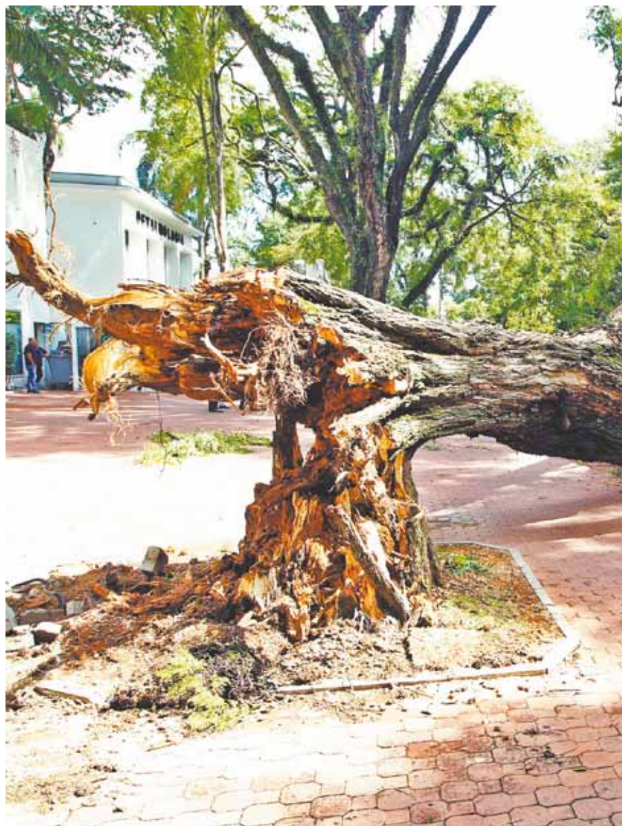
República do Líbano - Na altura do número 920 da avenida, sentido aeroporto, no Ibirapuera

O Parque do Ibirapuera voltou a funcionar parcialmente ontem, com a reabertura dos portões 2, 3 e 9, depois de ficar fechado no período da manhã em razão dos danos provocados por um temporal na madrugada de ontem, quando 25 árvores caíram no local. A Secretaria do Verde e Meio Ambiente, responsável pelo parque, informou em nota que ele só deve voltar a ser reaberto totalmente amanhã. A interdição, segundo a secretaria, ocorre para a realização dos trabalhos de remoção das árvores.