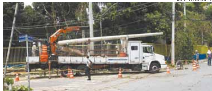
Caos - Áreas mais afetadas, segundo a empresa, foram zonas Sul e Norte

segundo a Eletropaulo, foram as zonas Sul e Norte. A companhia não informou, contudo, quantos e quais bairros ainda enfrentam problemas de abastecimento de energia neste momento. Com base em relatórios de meteorologia, a companhia informa que mais de 3 mil raios atingiram sua área de concessão desde a madrugada. Os trabalhos da Ele-