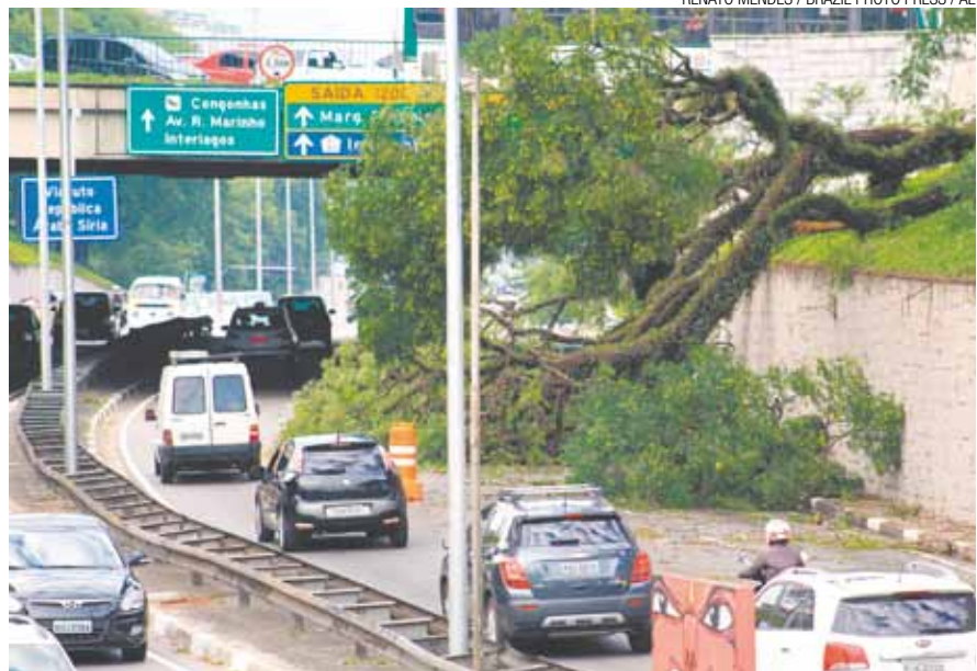
Rubem Berta - Galhos sobre a via provocaram congestionamento e transtorno