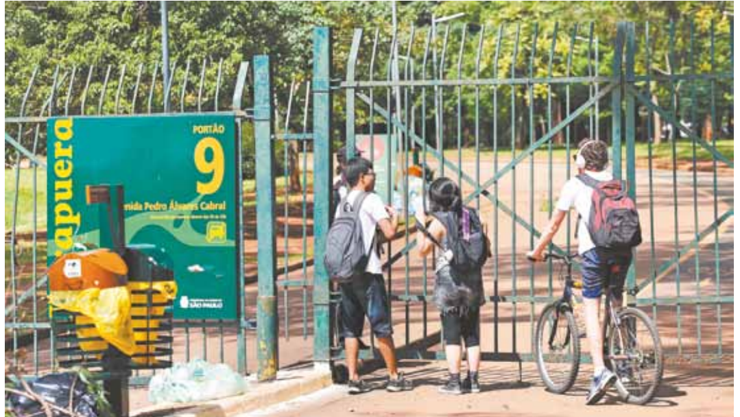
Ibirapuera - Portão 9 do parque foi reaberto ontem à tarde depois dos danos provocados pelo temporal