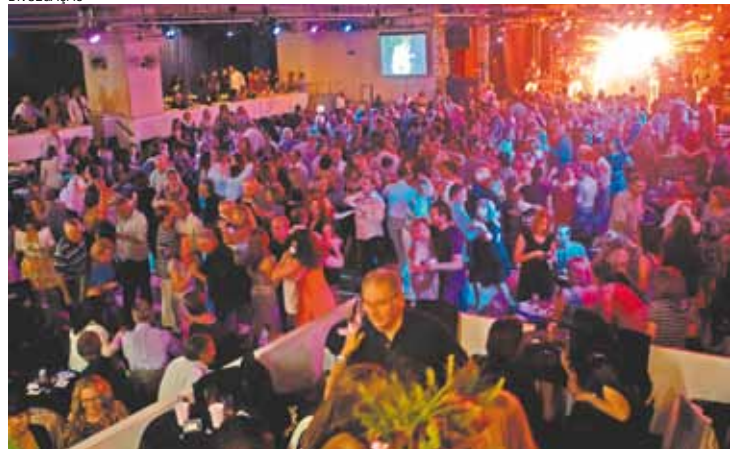
Animação - Público é formado por pessoas de variadas faixas etárias

nópolis (3666-0376). A programação está marcada para iniciar às 22h de amanhã. Às 23h59 terá início a festa da virada, com contagem regressiva, fogos e efeitos especiais. Nas mesas haverá kit alegria, tábua de frios, espumante e