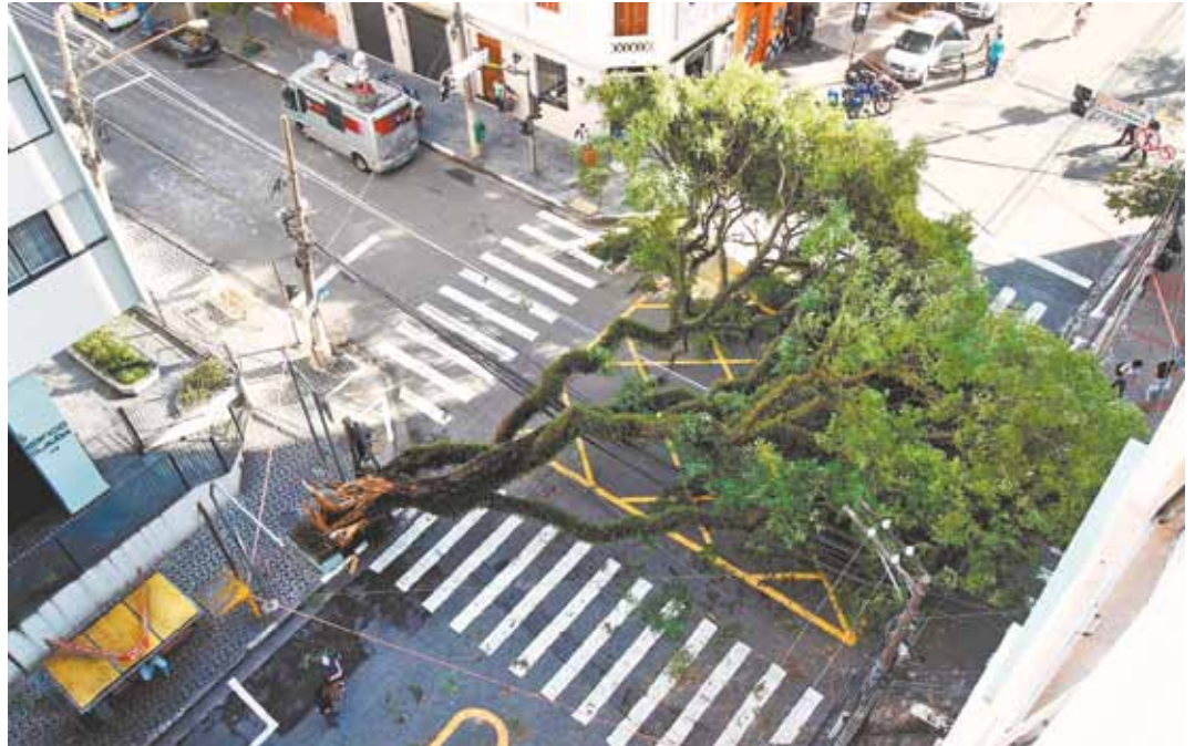
Vila Mariana - Árvore não resistiu e caiu ontem na esquina das ruas Cubatão e Eça de Queiroz