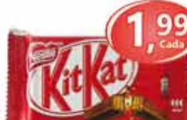
Kit Kat - 45g