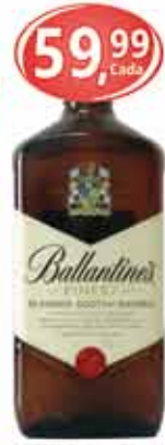
Whisky 1L Ballantine's Finest