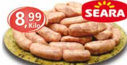
Linguiça Toscana Seara - 1kg