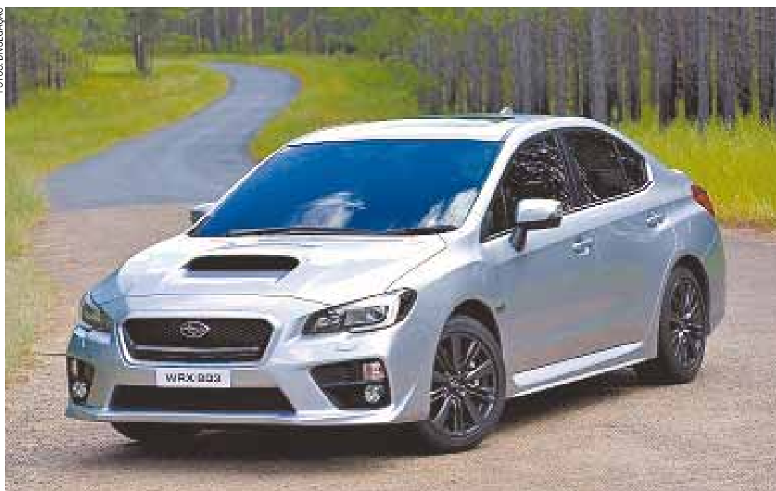
WRX – Design agressivo é destacado por grande abertura no capô dianteiro: potência e equilíbrio dinâmico