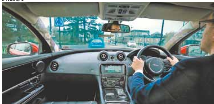
Volante à direita – Britânicos estudam o benefício de colunas com telas