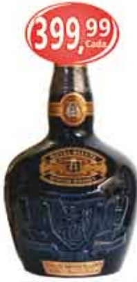
Whisky 21 Anos Royal Salute 700ml