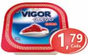
Iogurte Vigor Grego Sabores - 100g