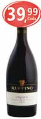
Vinho Italiano Ruffino