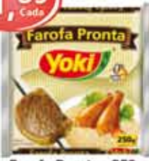
Farofa Pronta Yoki