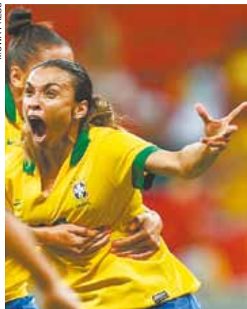
Marta - Eleita pela Fifa a melhor jogadora do mundo cinco vezes