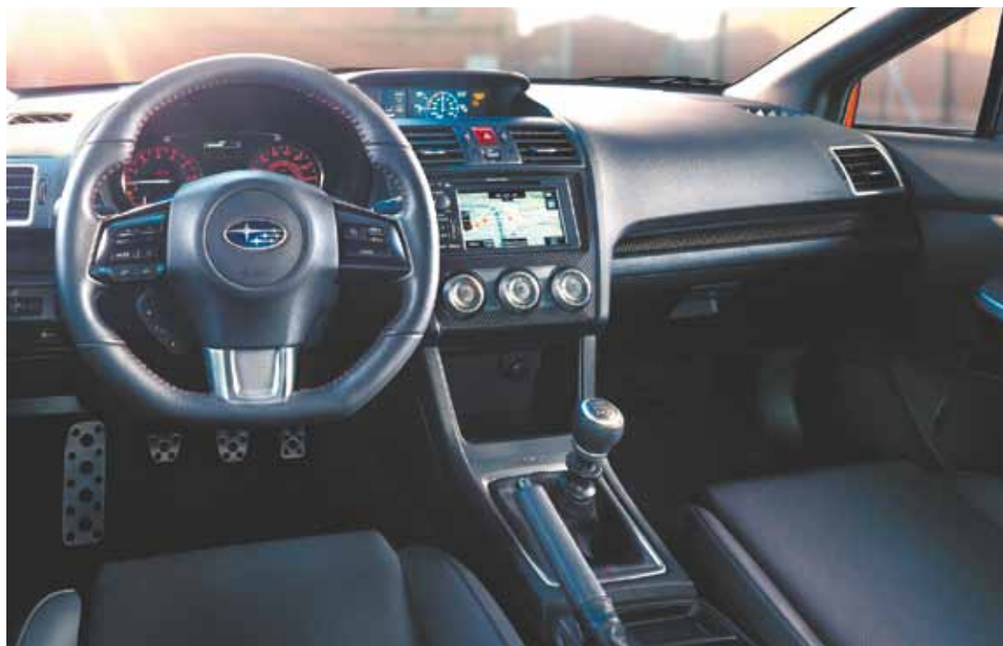
Interior – Bom acabamento, revestimentos em couro e opção de câmbio manual: mais esportividade