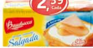
Torrada Bauducco - 180g