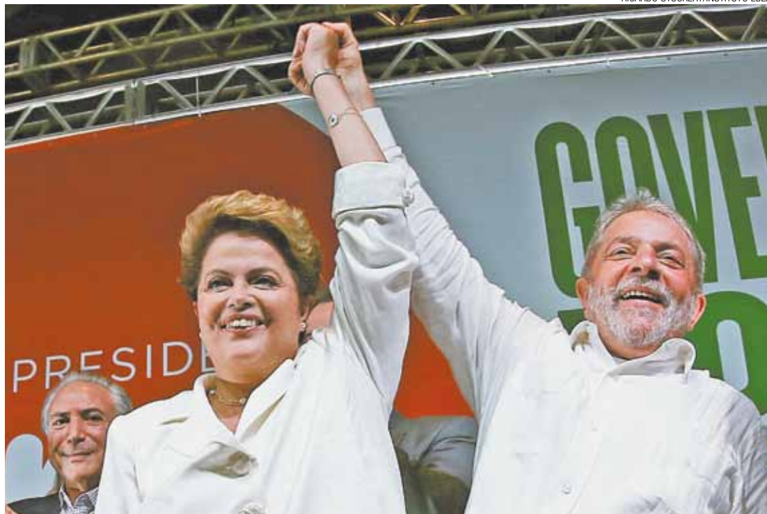
Pura felicidade - Ex-presidente Lula levanta os braços da presidente reeleita, Dilma Rousseff

É o dobro do tempo do PSDB no Palácio do Planalto, que teve dois mandatos presidenciais com Fernando Henrique Cardoso (1995-1998 e 1999-2002).