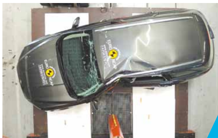
Colisão lateral – Hidroformagem proporciona proteção