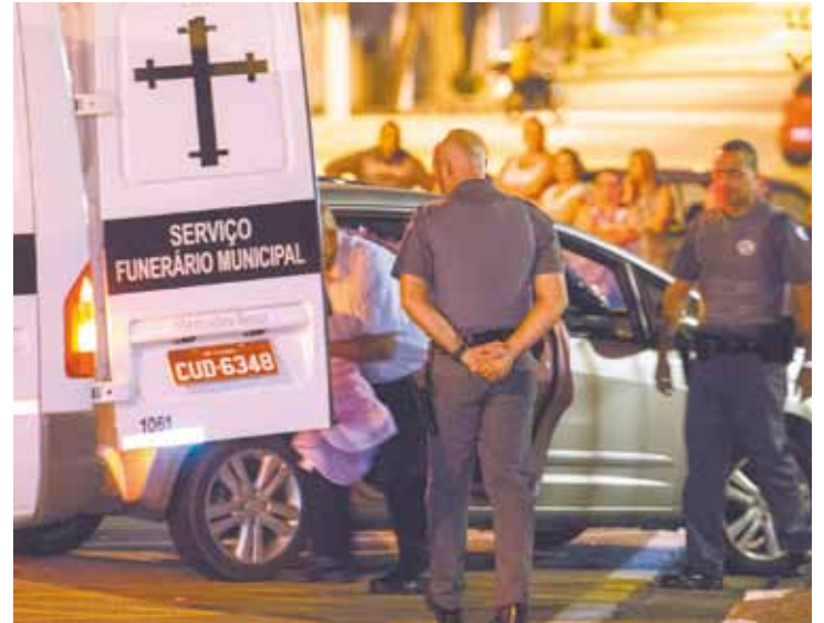
Retirado - Corpo da menina é levado para o carro funerário

A Polícia Militar foi acionada para socorrer a criança, mas a menina já estava morta. À noite, os pais prestaram depoimento no 2º Distrito Policial (Rudge Ramos) de São Bernardo. Em estado de choque, o funcionário público precisou ser levado para o hospital.