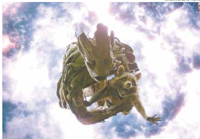
"Guardiões da Galáxia" - Filme surpreende em todos os sentidos