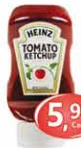
Ketchup Heinz 397g