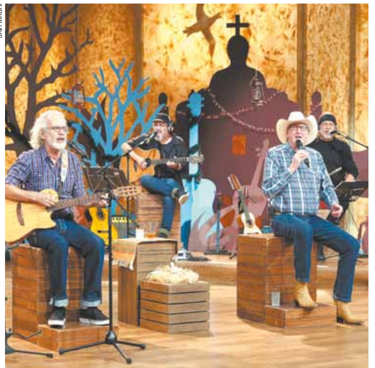
“Viola, Minha Viola” - Renato Teixeira e Sérgio Reis são as atrações