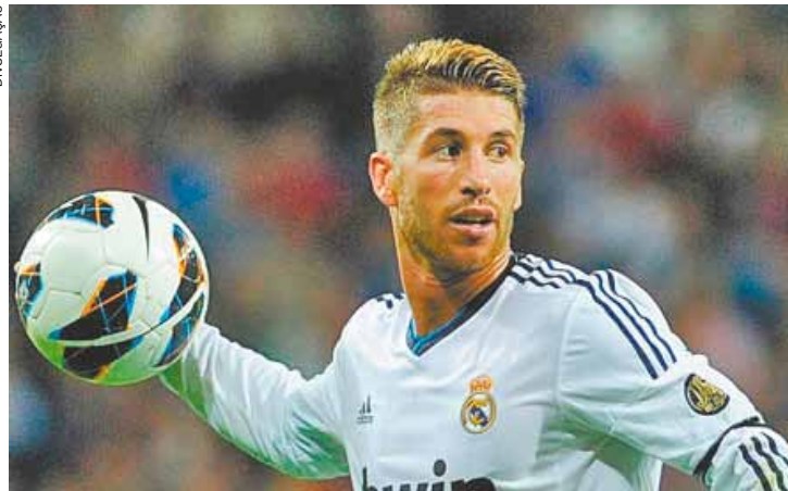
Reforço - Tendência é que jogue, mesmo longe das condições ideais

Real venceu a Liga dos Campeões, a Supercopa e a Copa do Rei em 2014