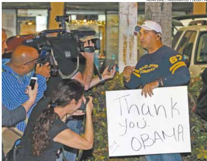
Em Miami - Cubanos favoráveis a reaproximação agradecem Obama