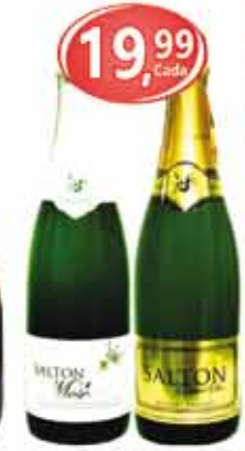
Espumante Saiton Moscatel / Demi-Sec