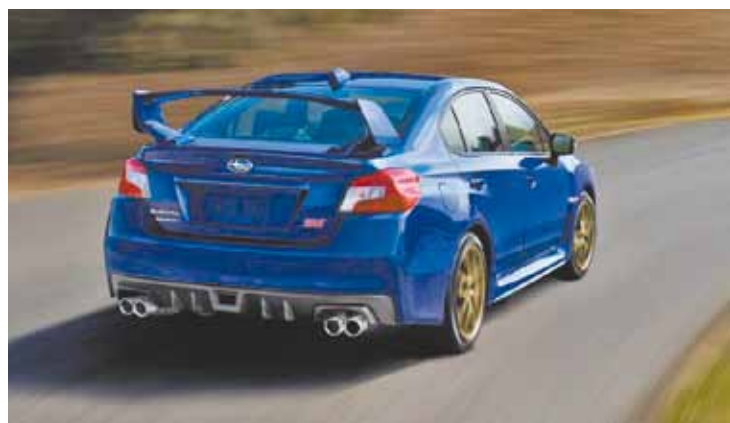
Versão STI – Aerofólio traseiro deixa modelo ainda mais agressivo