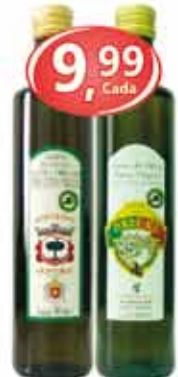
Azeite Português E.V Monte das Oliveiras Portucale - Vd 500ml