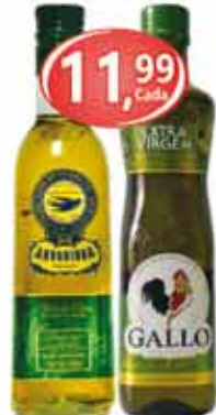
Azeite Português E.V Andorinha / Gallo Vd 500ml