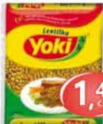
Lentilha - 200g Yoki