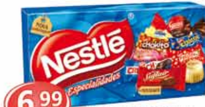
Nestlé Especialidades 357g