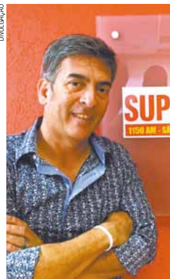
Diário - “Show do Figueiredo” será transmitido das 12h às 14h

Formado em Jornalismo, Rádio e TV e pós-graduado em Publicidade e Marketing, com 32 anos de carreira e passagens pela Globo AM, Capital AM, América AM, Boa Nova AM, Atual AM, Trianon AM e Tupi AM/FM,