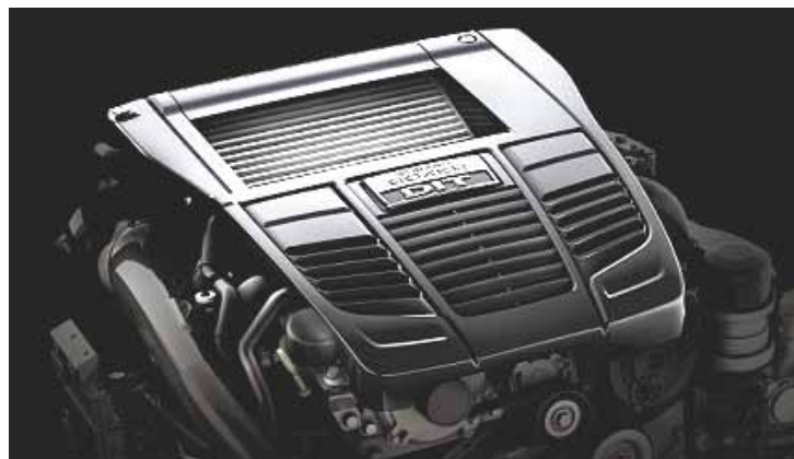
Boxer – Motor tem configuração conhecida, mas tecnologia é o diferencial