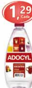
Adoçante Adocyl 100ml