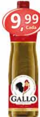
Azeite Puro Gallo Vd 500ml