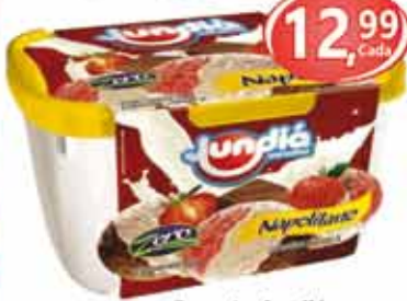
Sorvete Jundiá Pote - Sabores