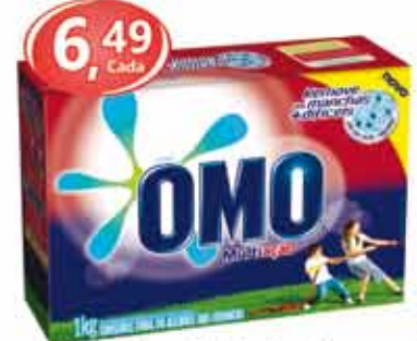
Omo Multilação - 1kg