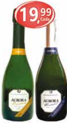
Espumante Aurora Prosecco / Moscatel