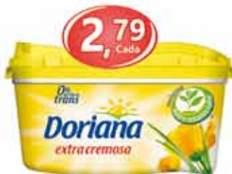
Doriana - 500g