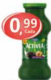
Loite Fermentado Activa - 150g