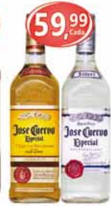
Tequila Jose Cuervo Especial