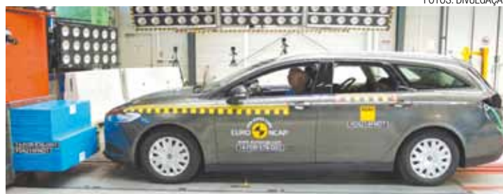
Barreira fixa – Teste de colisão frontal avalia níveis de deformação