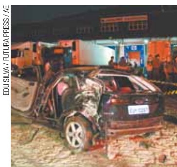
Vítima - Estava no porta-malas

De acordo com informações da Polícia Militar, o caso teve início por volta das 23h do dia anterior quando uma viatura fazia patrulhamento na Zona Oeste da capital. Na Rua Professor Ariovaldo Silva, Vila Leopoldina, a PM deu