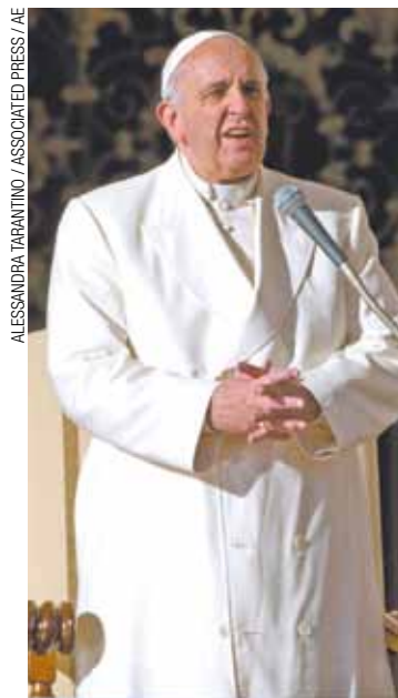
Intermediador - Papa Francisco elogiou atitude dos presidentes

Os encontros ocorreram no Canadá, como Estado neutro, e foram impulsionados pelo Vaticano e pelo próprio papa. “O trabalho do embaixador é de pequenos passos, de pequenas coisas, mas que acabam sempre por trazer a paz aos corações dos povos, semear a irmandade”, disse o papa em seu discurso, divulgado