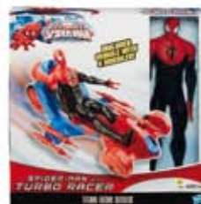
Fig SPD 12 com Veículo de Corrida