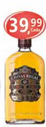
Whisky 12 Anos Chivas 375ml