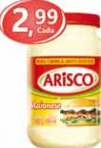
Maionese Arisco 500g