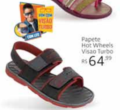
Papete Hot Wheels Visão Turbo R$ 64,99