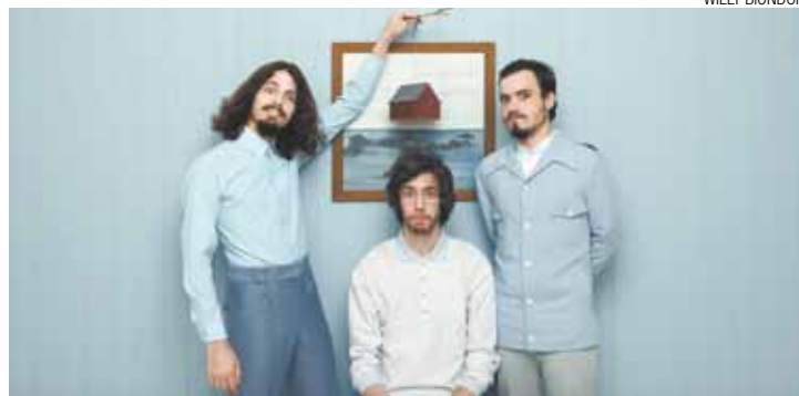
Repertório - Grupo apresenta canções de álbum lançado em agosto