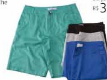
Bermuda Sarja Color R$ 39,99