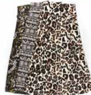
Saia Longa Estampas Sortidas R$ 24,99