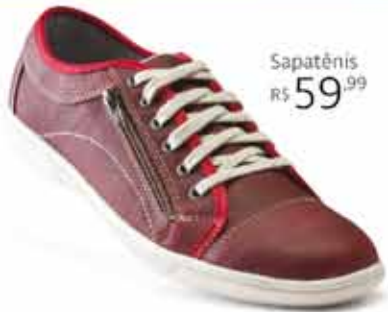
Sapatênis R$ 59,99