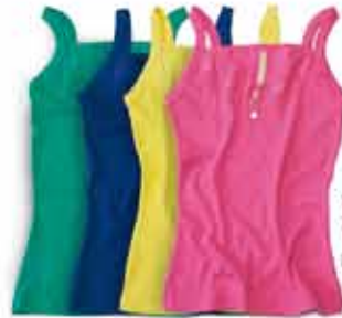
Regata Renda R$ 19,99