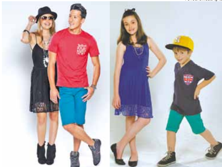
Natal – Mãe de vestido (R$ 49,99); pai de camiseta (R$ 24,99) e bermuda (R$ 59,99); filha de vestido (R$29,99); e filho de camiseta (R$ 14,99) e bermuda (R$ 39,99).