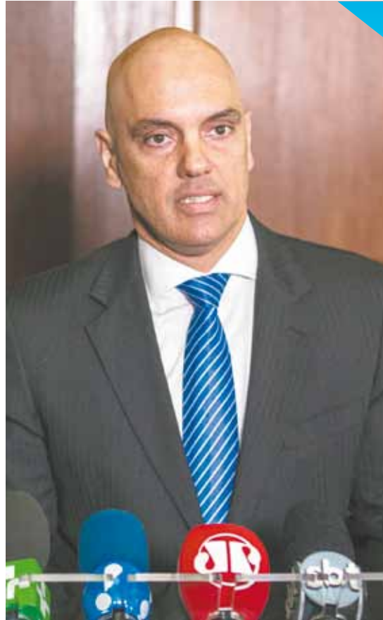
Anúncio - Futuro secretário já colocou suas opiniões