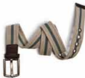
Cinto de Lona América R$ 24,99