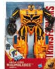
Fig TRF4 One Step Bumblebee A7799 - Hasbro por R$ 199,99

Puzzle 5000 Peças Happy Dogs 2966 - Grow de R$99,99 por R$ 39,99