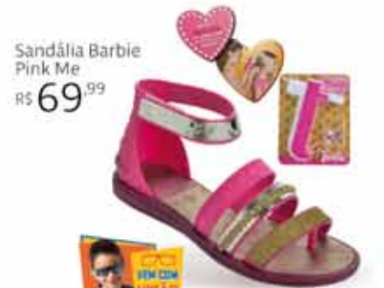
Sandália Barbie Pink Me R$ 69,99