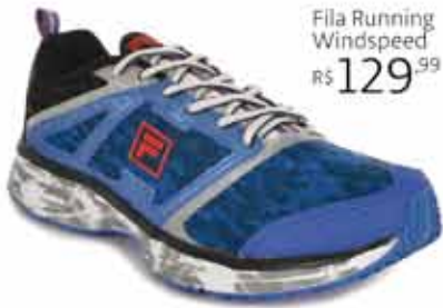
Fila Running Windspeed R$ 129,99