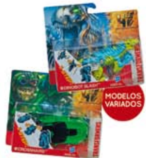
Fig TRF4 One Step Changers sortimento A6151 - Hasbro por R$ 69,99 cada

Quadríciclo Polaris IGOD0048/62 - Burigotto por R$ 1.799,00