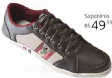
Sapatênis R$ 49,99