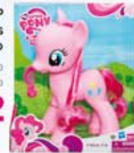
Figura MLP & Polegadas Novo sortimento A5931 - Hasbro por R$ 49,99

OLAF 70cm LJP118 - Long Jump por R$ 189,99