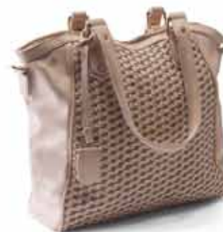
Bolsa com Detalhe em Tressê R$ 119,99