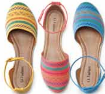
Espadrille LK Fashion R$ 69,99