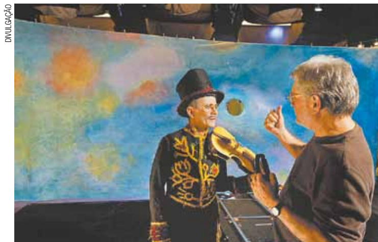
Nóbrega - Walter Carvalho fez filme sobre o compositor e dançarino

Acompanhado por banda e bailarinos, Nóbrega presta uma homenagem ao centenário de nascimento do compositor baiano Dorival Caymmi, interpretando algumas de suas canções mais famosas como "Marina" e "Suíte dos