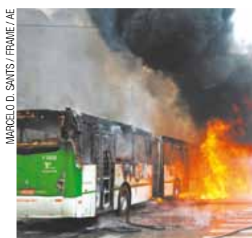
MARCELO D. SANTOS / FRAMIE / AÉ

O prédio estava ocupado há pelo menos seis me-