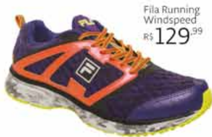
Fila Running Windspeed R$ 129,99