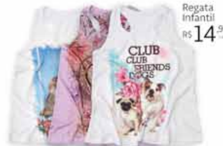
Regata Infantil R$ 14,99