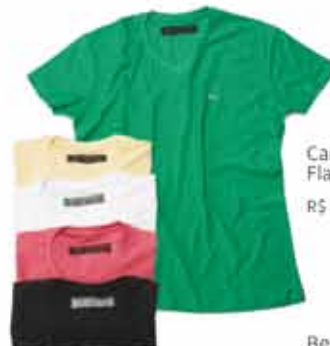
Camiseta Flame Básica R$ 24,99