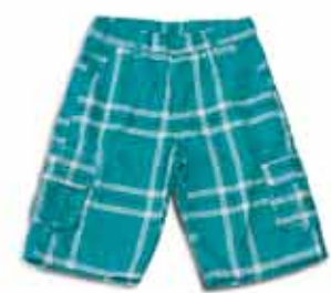
Bermuda Infantil R$ 29,99