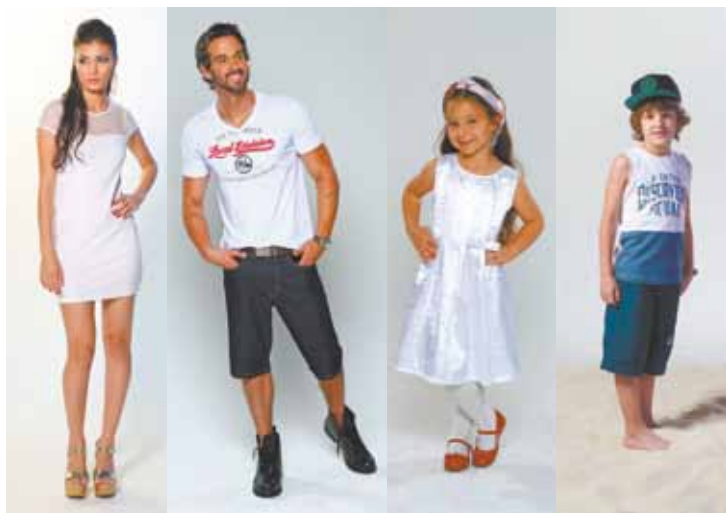
Ano Novo – Mãe de vestido (R$ 49,99); pai de camiseta (R$ 29,99) e a mesma bermuda do Natal; filha de vestido (R$34,99); e filho de camiseta (R$ 14,99) e bermuda (R$ 19,99).