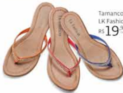
Tamarco Rasteiro LK Fashion R$ 19,99