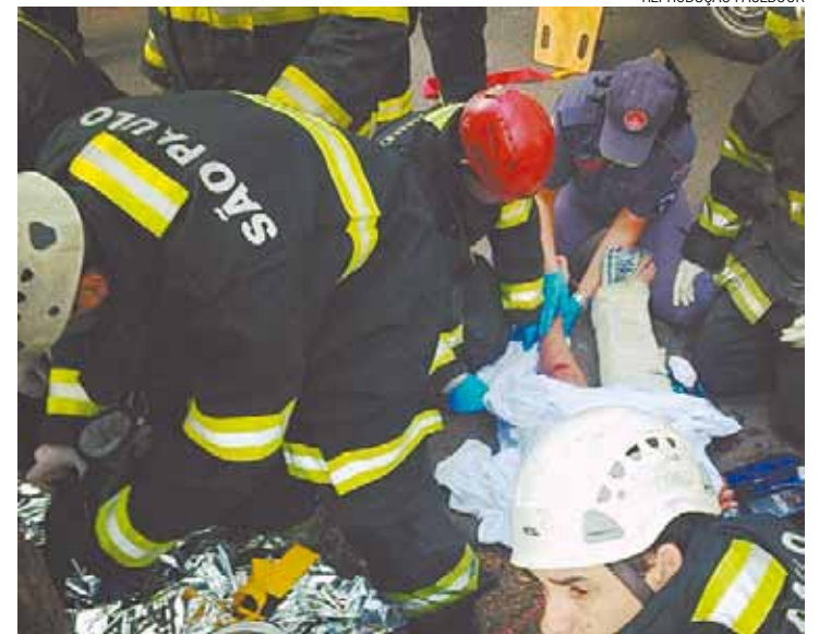
Socorro - Bombeiros resgatam as vítimas dentro da própria USP

* Secretário-geral do SinSaudeSP e Secretário Nacional de Políticas Públicas – Saúde da Força Sindical E-mail: joaquim@sinsaude.org.br Site: www.sinsaude.org.br