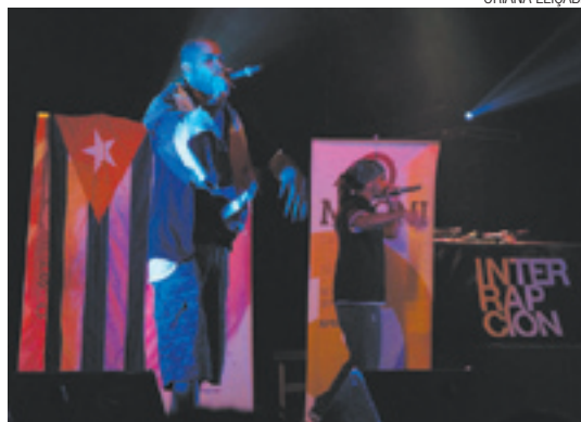
Los Aldeanos – influência de agência norte-americana