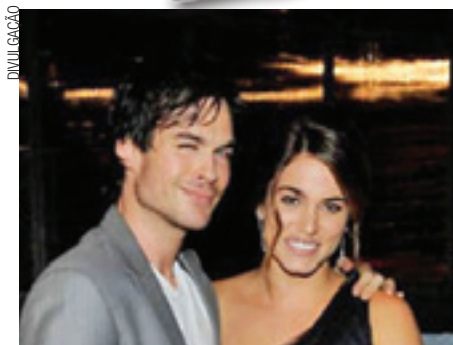
Não tem nenhuma informação oficial ainda.

Ainda que ele não tenha comprado a aliança, uma fonte próxima contou que eles estão indo bem rápido no relacionamento, então não seria tão absurdo um pedido de casamento agora.