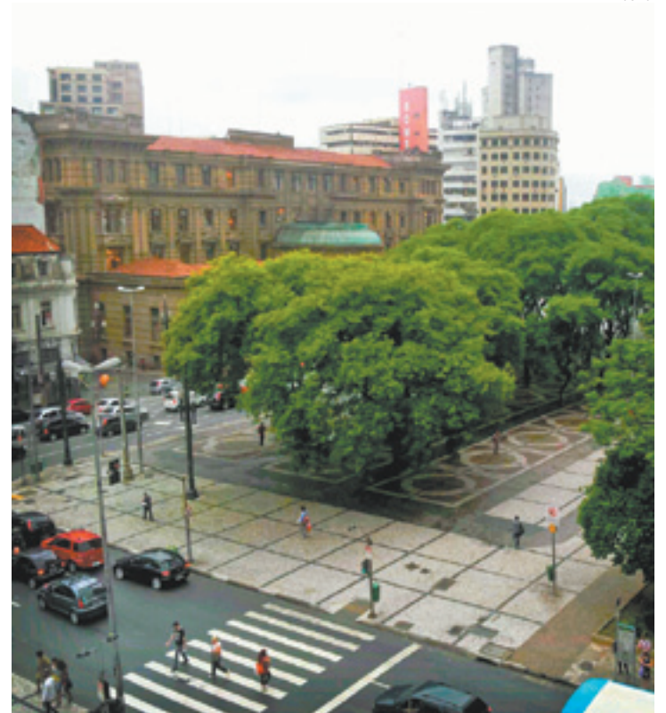
João Mendes - Velocidade máxima passa de 60km/h para 50 km/h