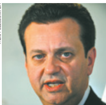
Conduta - Alteração do destino

exercício enquanto prefeito em 2006. O ex-prefeito também teve os direitos políticos suspensos por três anos por causa das ilegalidades. Ainda cabia recurso.