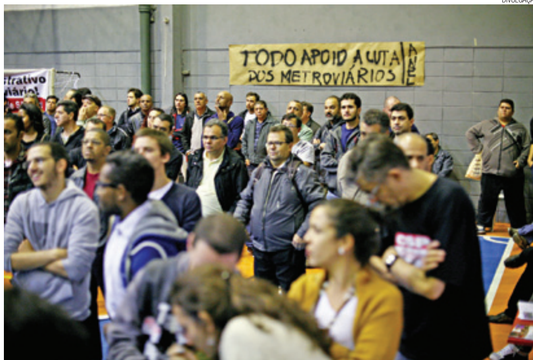
Negociação - Os metroviários voltaram ao trabalho a tempo de não prejudicar a abertura da Copa

Logo no início de junho o clima da Copa já contagiava os paulistanos. A cidade fazia os últimos ajustes para a abertura do Mundial, em Itaquera. A população pintava as ruas de verde e amarelo e o comércio estava a todo vapor com venda de camisetas e acessórios da Seleção. A Copa começou no dia 12 de junho.