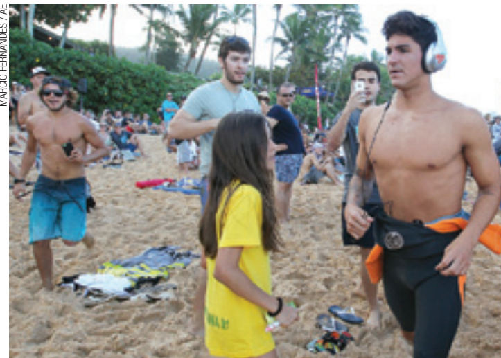
Na praia - Medina ficou na praia e correu para exercitar o corpo

Na semana passada, Tite participou de um seminário de treinadores no Rio de Janeiro e depois voltou ao Rio Grande do Sul. No último sábado, o treinador marcou presença em partida beneficente em Nova Prata. A expectativa é que houvesse um encontro entre Tite e Veloz para dar a palavra final ao presidente do Corinthians.