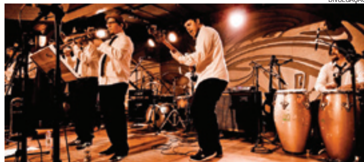
Repertório - Efervescência da funk music dos 1970 e muito James Brown