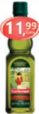
Azeite Esp. Carbonell Extra Virgem Vidro 500ml