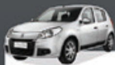
SANDERO EXPRESSION 2010 Pl. 3955 - DH/VE R$ 18.500,