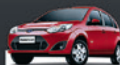
FIESTA HATCH 1.0 2012 Pl. 8101 - COMPLETO R$ 22.900,