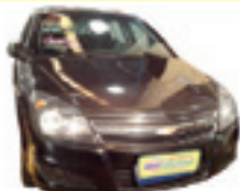
Vectra GT 2.0 Completo - preto - 10/11 R$ 34.900

Fácil acesso pelo Rodoanel Saída Mauá Santo André