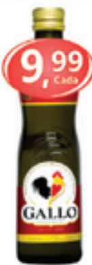
Azeite Port. Gallo Puro Vidro 500ml