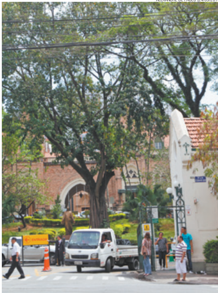
Santa Casa - Superfaturamento levou a um rombo de R$ 800 milhões

A reportagem apurou também que foram detectadas distorções nas contas das unidades públicas administradas pela instituição. Hoje, a entidade administra quatro hospitais próprios e 27 unidades de saúde das prefeituras de São Paulo e Guarulhos.