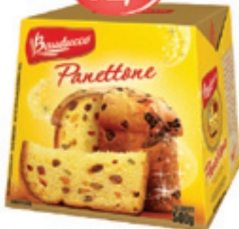
Panettone / Chocottone Bauducco 500g