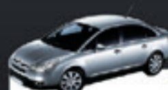
C4 PALLAS GLX 2.0 2011 Pl. 6902 - COMPLETO R$ 29.900,