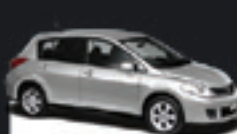
TIDA HT SL 1.8 2012 Pl. 6711 - COMPLETO R$ 33.500,