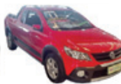
Saveiro Cross 1.6 Completo - vermelho - 10/11 R$ 37.900