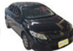
Corolla XLi 1.8 Completo - preto - 11/11 R$ 48.900