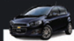
SONIC HATCH LTZ 1.6 2013 Pl. 2832 - COMPLETO R$ 46.900,