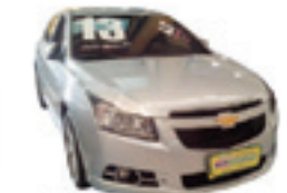
Cruze LT 1.8 Automático Completo + Couro - prata - 12/13 R$ 59.990