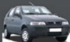
PALIO HLX 1.8 2005 Pl. 1592 - COMPLETO R$ 18.900,