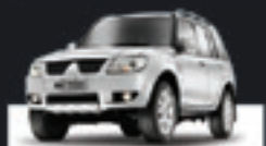
PAJERO TR4 2.0 AUT 2012 Pl. 2609 - COMPLETO R$ 52.900,