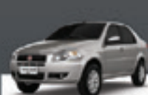
SIENNA EL 1.0 2010 Pl. 5006 - DH/VE/TE R$ 21.500,