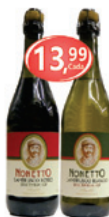
Lambrusco Nonetto Rosso / Bianco