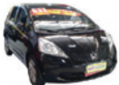
Fit LX 1.4 Automático Completo + ABS + Air Bag Duplo - preto - 11/11 R$ 39.900