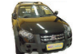
Strada Adventure 1.8 Completo + ABS + Air Bag - preto - 11/12 R$ 39.900