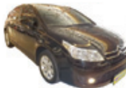
C4 Hatch GLX 1.6 Completo - preto - 10/11 R$ 34.900