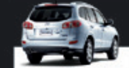
SANTA FÉ GLS 3.5 AUT 2011 Pl. 5185 - COMPLETO R$ 63.900,