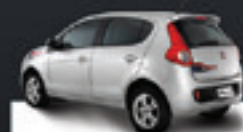
PALIO ATTRACTIVE 2012 Pl. 1048 - DH/VE/TE R$ 26.500,