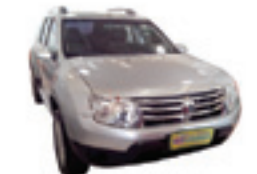
Duster 1.6 Flex Completo - prata - 11/12 R$ 46.900