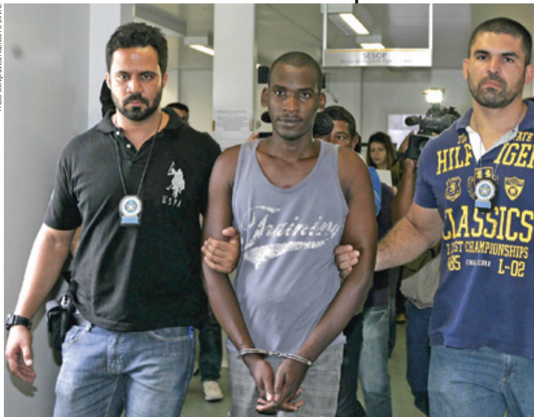
Na cadeia - Entre dos policiais, o 'serial killer' de Nova Iguaçu é levado para a prisão como réu confesso