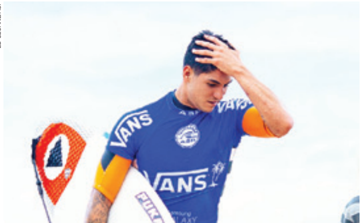
Falta pouco - Medina pode ser o primeiro do País com título de campeão

Apesar de ser o mais jovem entre os três que disputam o troféu no Pipe Masters, o garoto de Maresias demonstra tranquilidade antes do início da última etapa,