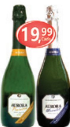
Espumante Aurora Prosecco / Moscato