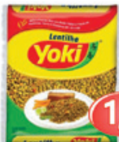
Lentilha - 200g Yoki