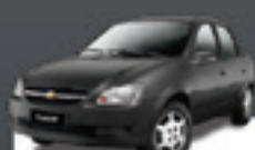
CLASSIC LS 1.0 2011 Pl. 8843 - TE/AQ R$ 19.900,