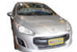
Peugeot 308 Active 1.6 Flex Completo - prata - 12/13 R$ 40.900