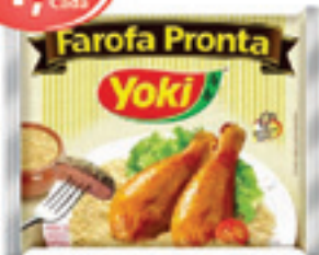
Farofa Pronta - 250g Yoki