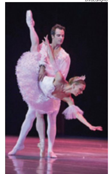
Referência - Espetáculo é uma das obras mais executadas no mês