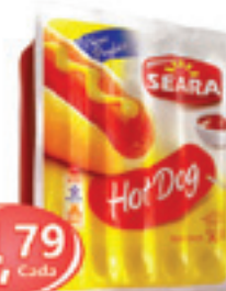
Salsicha Seara Hot Dog - 500g