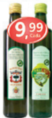
Azeite Port. Monte das Oliveiras Portugale Vidro 500ml