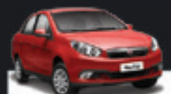
GRAND SIENNA ATTRACTIVE 2013 Pl. 8054 - COMPLETO R$ 33.500,