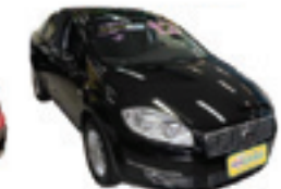
Linea Essence 1.8 Flex Completo - preto - 11/12 R$ 37.900