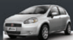
PUNTO ELX 1.4 2008 Pl. 7803 - COMPLETO R$ 22.900,