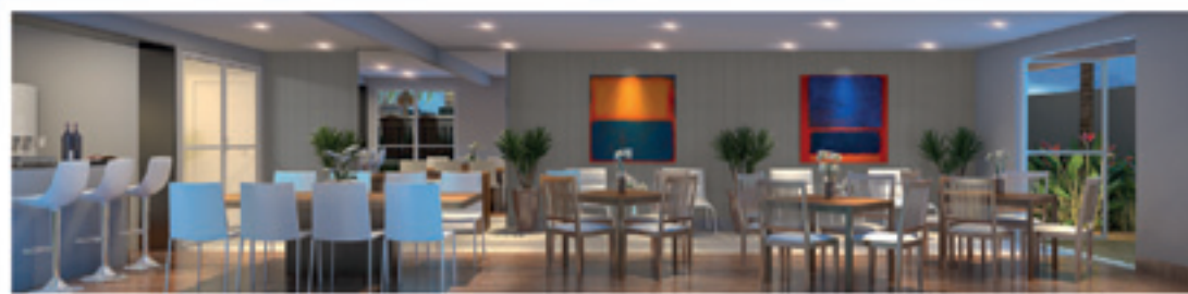
Perspectiva Ilustrativa do Salão de Festas com Espaço Gourmet