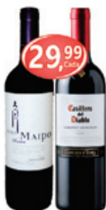
Vinho Chileno Reserva Viña Maipo Merlot Casillero del Diablo