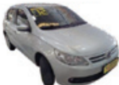
Gol Trend 1.6 Flex Completo - prata - 11/12 R$ 29.900