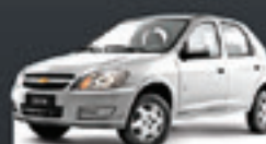
CELTA 1.0 VHC 4PTS 2012 Pl. 1320 - COMPLETO R$ 23.500,