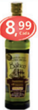
Azeite Esp. Báltico Extra Virgem Vidro 500ml