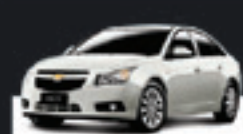
CRUZE SEDAN LTV AUT 2013 Pl. 9765 - COMPLETO R$ 55.900,