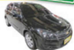
Vectra Hatch 2.0 Completo - preto - 08/09 R$ 29.800