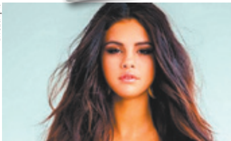
A cantora também falou que não tem nenhum amor em sua vida agora.