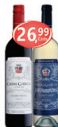
Vinho Português Casal Garcia Tinto / Branco