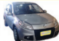
Sandero Expression 1.0 Flex Completo + Air Bag + ABS - prata - 13/13 R$ 27.490