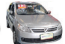
Voyage Trend 1.6 Completo - prata - 12/13 R$ 29.900