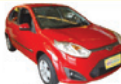
Fiesta Hatch Class 1.0 Completo + Air Bag + ABS - vermelho - 11/12 R$ 27.900