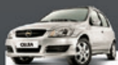
CELTA 1.0 2009 Pl. 9133 - BÁSICO R$ 16.900,