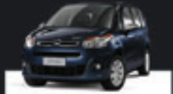
C3 PICASSO GLX 2012 Pl. 2073 - COMPLETO R$ 36.500,