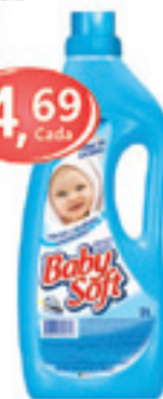
Amaciante Baby Soft - 2L