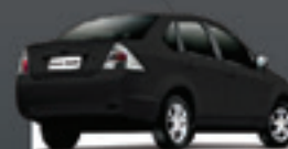
FIESTA SEDAN 1.0 2009 Pl. 6841 - COMPLETO R$ 21.500,