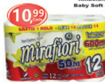
Papel Higiénico Mirafiori 12 rolos - 50m