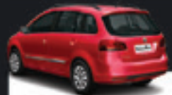
SPACEFOX 1.6 SPORTLINE 2012 Pl. 5385 - COMPLETO R$ 36.500,