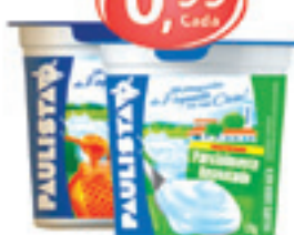
Iogurte Paulista Sabores - 170g