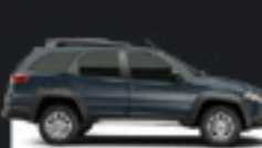
PALIO WEEK ADVENTURE 2014 Pl. 3074 - COMPLETO R$ 48.500,