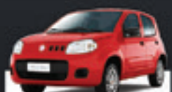
UNO VIVACE 1.0 4 PTS 2014 Pl. 0591 - COMPLETO R$ 26.900,