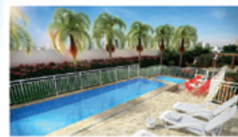
Perspectiva Ilustrativa da Piscina

Visite os decorados: Rua Catumbi, 286 - Belém Altura do nº 1.355 da Av. Celso Garcia