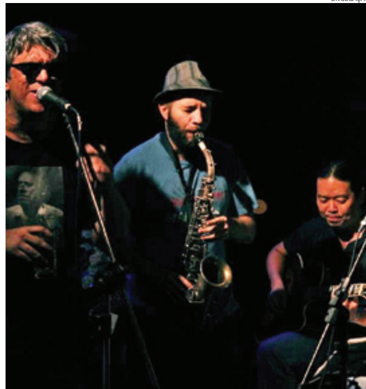
Releituras - Letras da época da Jovem Guarda e da fase mais soul do Rei