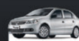
VOYAGE 1.6 TREND 2011 Pl. 2180 - COMPLETO R$ 29.900,