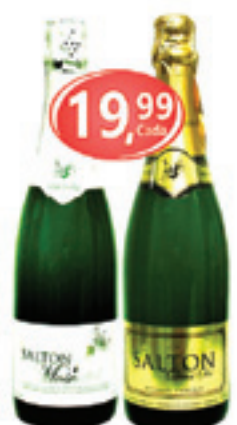
Espumante Salton Moscato / Demi-Sec