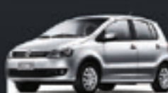
FOX TREND 1.6 4PTS 2011 Pl. 6957 - COMPLETO R$ 26.900,