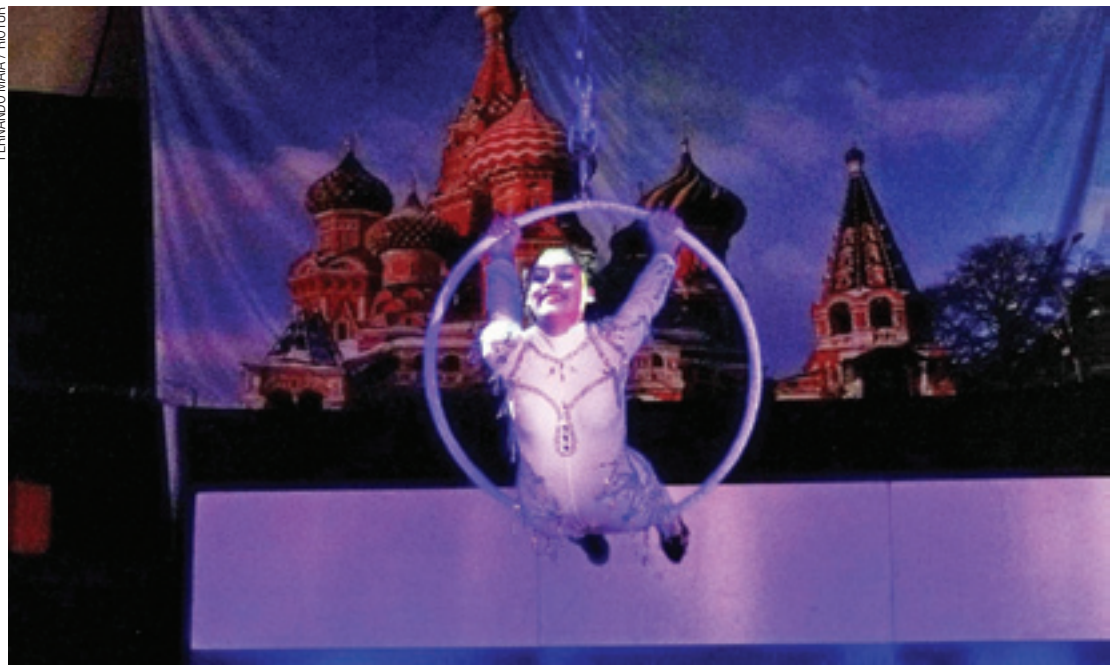
“Histriões e Saltimbancos” - Números de malabarismos, equilíbrios aéreos e palhaços se revezam