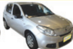
Sandero 1.0 AL + TE - prata - 12/12 R$ 24.900