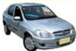
Prisma Joy 1.4 Completo - prata - 08/09 R$ 23.900