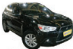
ASX 4x4 Automático 2.0 Completo + Teto Panorâmico - prata - 11/11 R$ 71.900

(11) 4977-9000 autoshoppingglobal.com.br