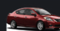
VERSA SL 1.6 2014 Pl. 2338 - COMPLETO R$ 38.900,