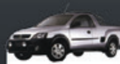
MONTANA CONQUEST 2010 Pl. 0486 - DH/AQ R$ 23.500,