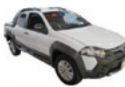
Strada Adventure 1.8 Completo + Teto - branco - 13/13 R$ 46.900