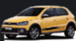
GOL G6 1.6 RALLYE 2014 Pl. 1092 - COMPLETO R$ 37.900,