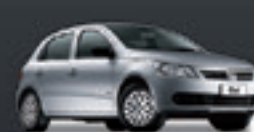
GOL GS 1.0 2012 Pl. 3924 - BÁSICO R$ 23.900,