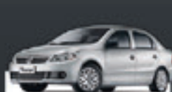
VOYAGE 1.0 TREND 2011 Pl. 5772 - DH/VE/TE R$ 22.900,