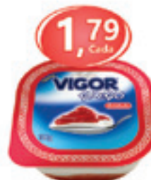
Iogurte Vigor Grego Sabores - 100g