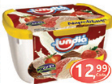
Sorvete Jundiá Pote - Sabores