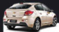
CRUZE SPORT LT AUT 2013 Pl. 5442 - COMPLETO R$ 57.900,