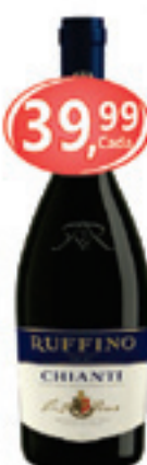
Vinho Italiano Ruffino