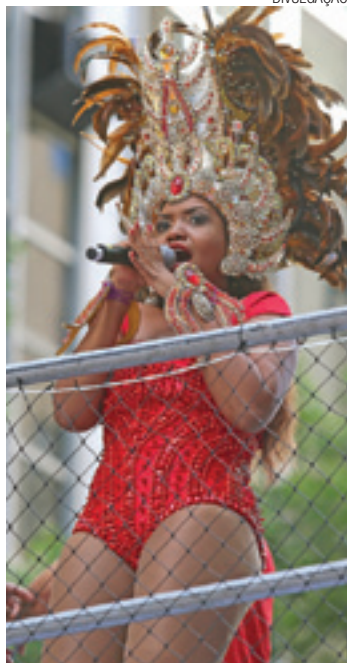
Gaby Amarantos - Show será no domingo, com entrada gratuita