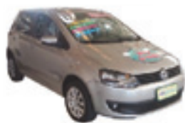
Fox Trend 1.0 Completo - cinza - 13/13 R$ 33.900