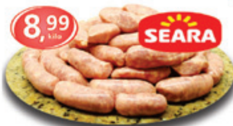
Linguiça Toscana Seara - 1kg