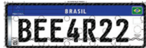
Novo modelo - Combinação possibilita melhor leitura na fiscalização

Além da sua utilização criminosa por quadrilhas de roubos de veículos, há inúmeros casos de proprietários que utilizam placas frias