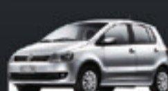
FOX TREND 4 PTS 2012 Pl. 5324 - COMPLETO R$ 28.500,