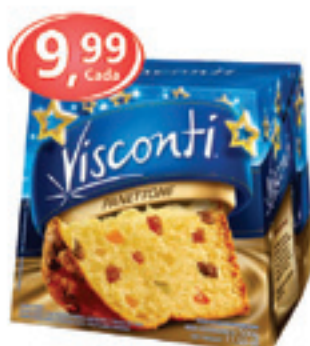
panettone Visconti 500g