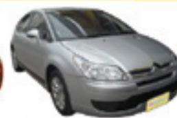
C4 Hatch GLX 1.6 Flex Completo - prata - 10/10 R$ 28.900