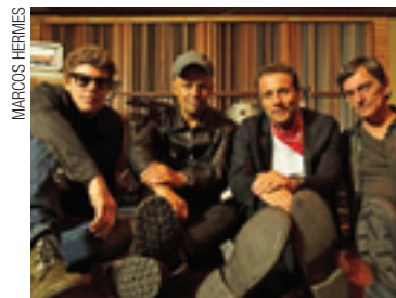
Titãs - Grupo mostra Nheengatu e outras músicas no parque, sábado

A apresentação dos Titãs se baseará nas músicas do disco recém-lançado “Nheengatu” e também em sucessos que marcaram a história da banda. Acompanhada pela Orquestra Arte Viva, sob regência