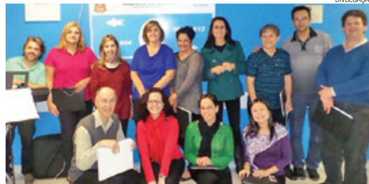
Sol Maior - Coro de câmara terá apresentação hoje, às 19h