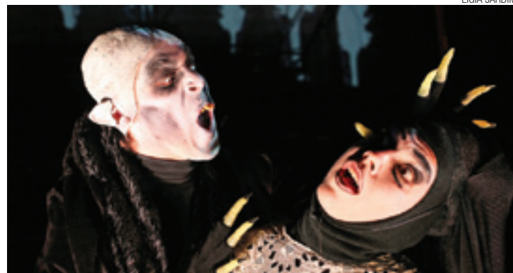
“Nosferatu” - Pantomima baseada nos filmes de Murnau e Herzog