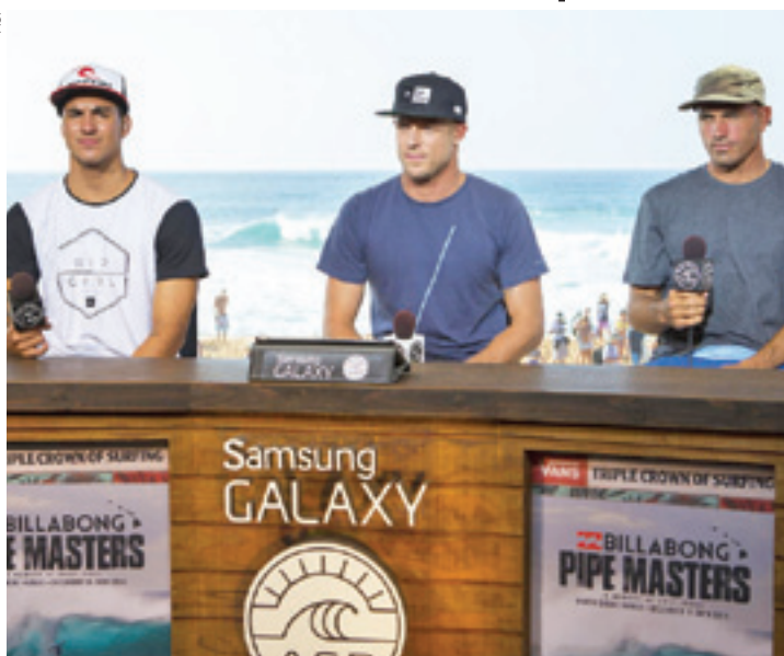
Líderes - O brasileiro Medina, o australiano Fanning e Slater, dos EUA