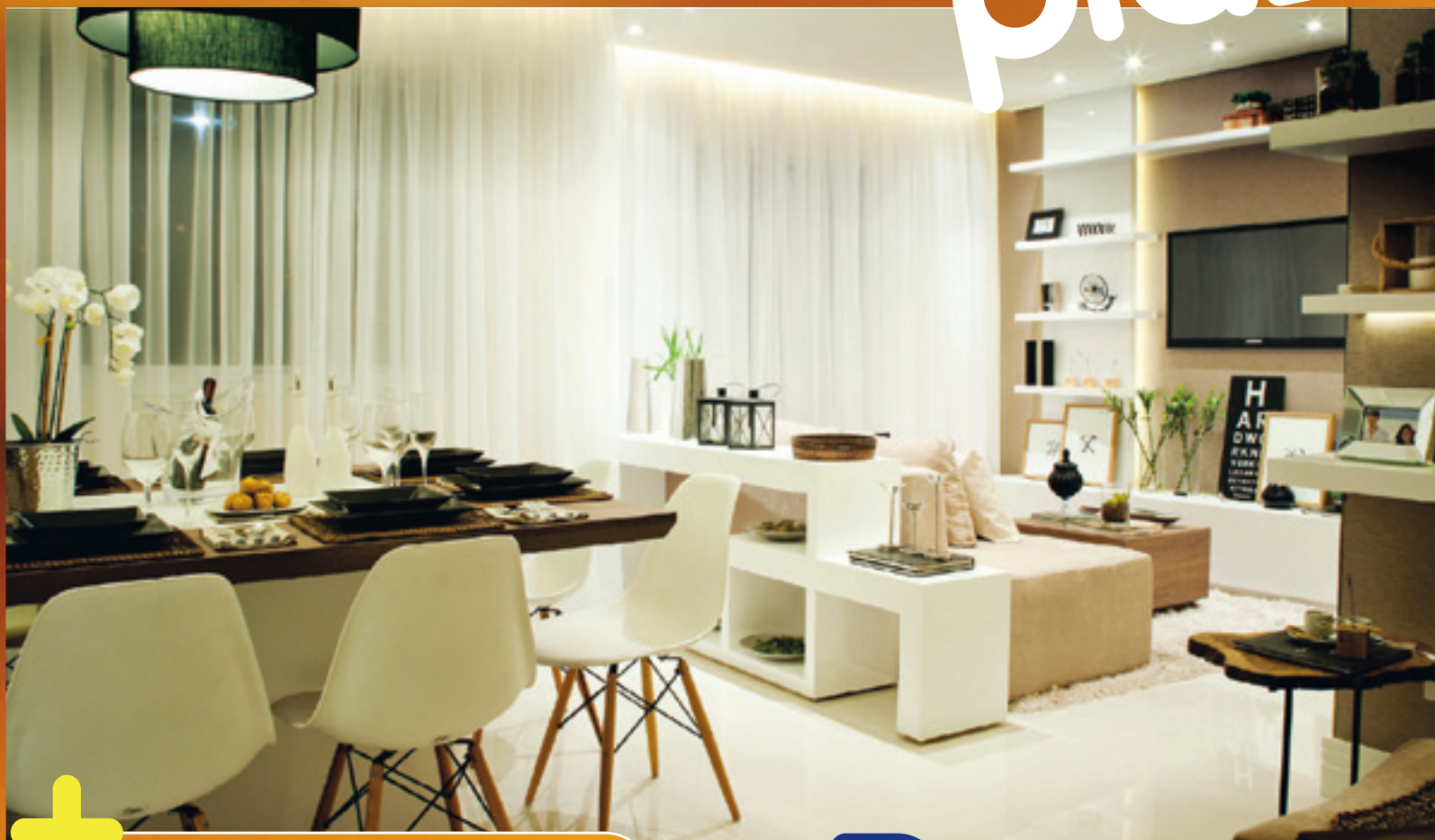
Foto do decorado