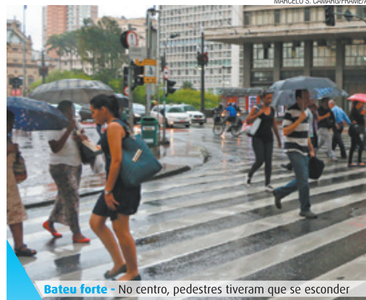
Bateu forte - No centro, pedestres tiveram que se esconder

Fale agora mesmo com seu corretor. Ligue: 2324-2423