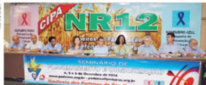
A rodada de discussões, palestras e debates com especialistas sobre Cipa e NR12 foi transmitida ao vivo, pela internet

Preocupado em melhorar a saúde e segurança de nossa categoria, o Sindicato reuniu no Seminário os cipeiros eleitos para prepará-los para uma missão muito importante: prevenir o trabalhador dos perigos existentes nas máquinas e equipamentos usados nas panificadoras.