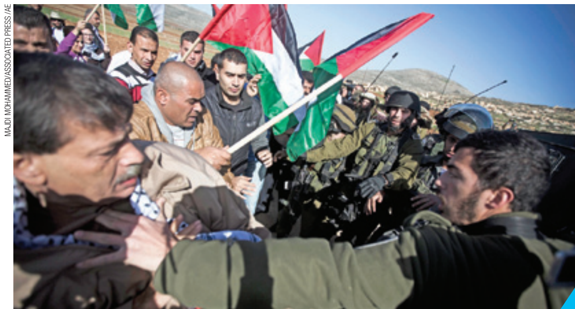
Pelo pescoço - Soldado israelense segura Abu Ain (à esq.); ministro logo depois passou mal e morreu

O presidente palestino Mahmoud Abbas deveria se reunir com graduados integrantes da Organização para a Libertação da Palestina (OLP) e com o Fatah, seu partido político para discutir uma possível resposta.