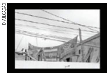
Zona Sul - Fotos são resultado de um workshop de Liliane Barcelos

Com iniciativa e curadoria da aluna do sétimo semestre do curso de Serviço Social Liliane dos Reis Barcelos, a mostra reúne 20 fotos produzidas por crianças entre 12 e 15 anos, da Casa da Criança Santo Amaro. Fotógrafa há 12 anos, Liliane coordenou um workshop de fotografia com