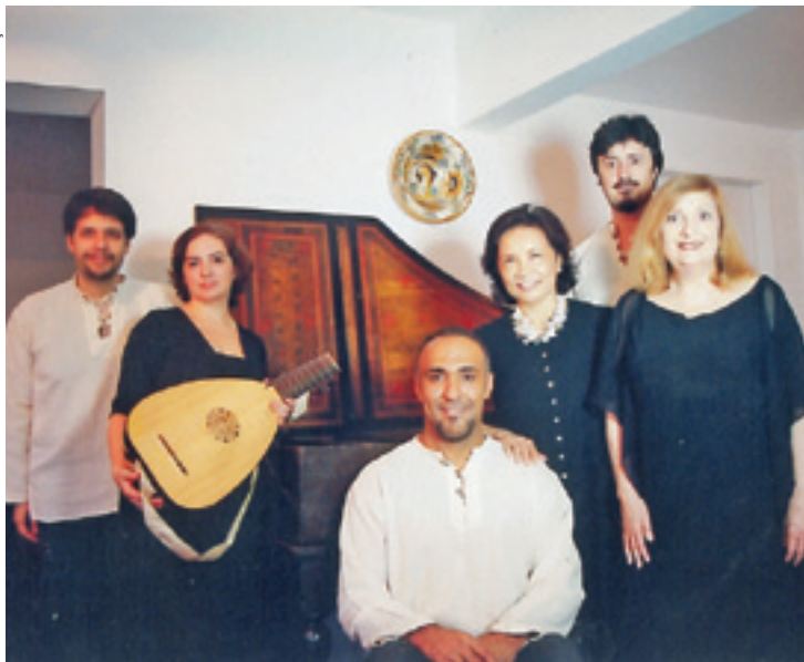
Musicaplena - Obras do período renascentista com instrumentos de época