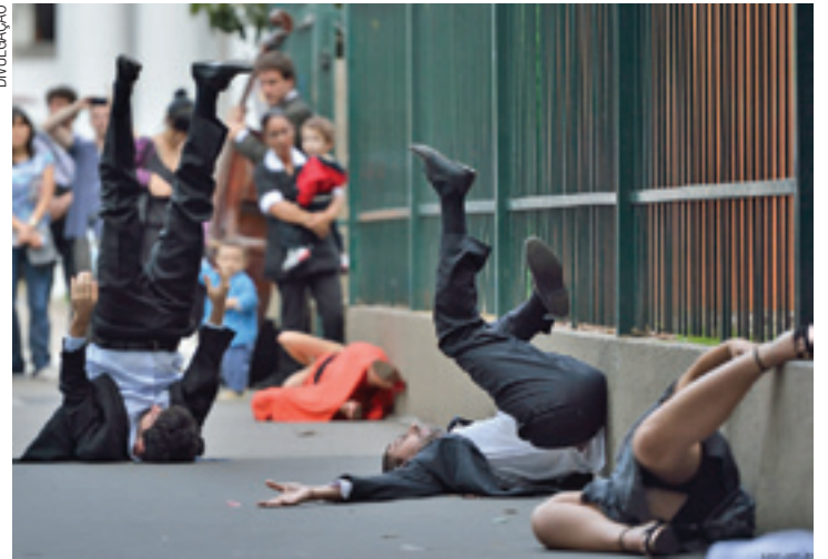
Intervenção - Atores ocuparão área externa e interna da biblioteca

O espetáculo dialoga com as imagens silenciosas expostas em excesso no cotidiano de uma metrópole, mesclando diversas linguagens artísticas, como o grafite, a videoarte, a performance arte, o teatro, a