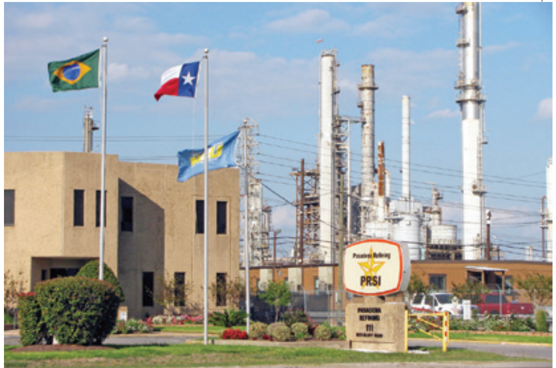
Pasadena - Refinaria pivô de investigações anunciou lucro de US$ 130 milhões no primeiro semestre