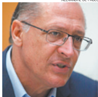
Governo - Gasto não programado

liberar R$ 500 milhões para integrar a bacia do Rio Paraíba do Sul ao Sistema Cantareira e garantir que a Região Metropolitana não ficasse sem água.