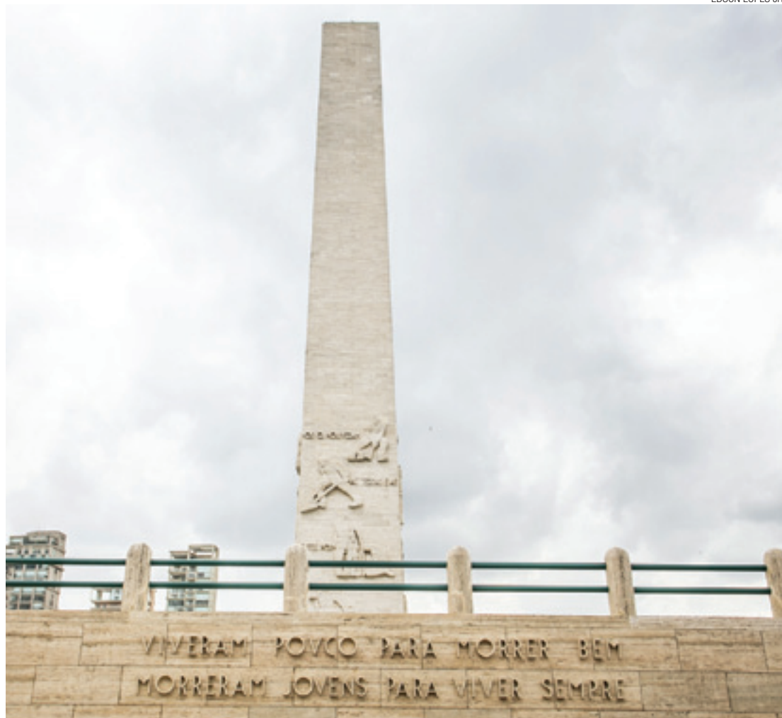
Restauro - Iniciada em julho de 2013 e recém-concluída, obra custou R$ 11,4 milhões aos cofres públicos

Obelisco ficará aberto ao público diariamente, das 10h às 16h