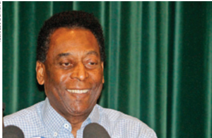
Cautela - Pelé ficará na Capital e só depois voltará para o Guarujá