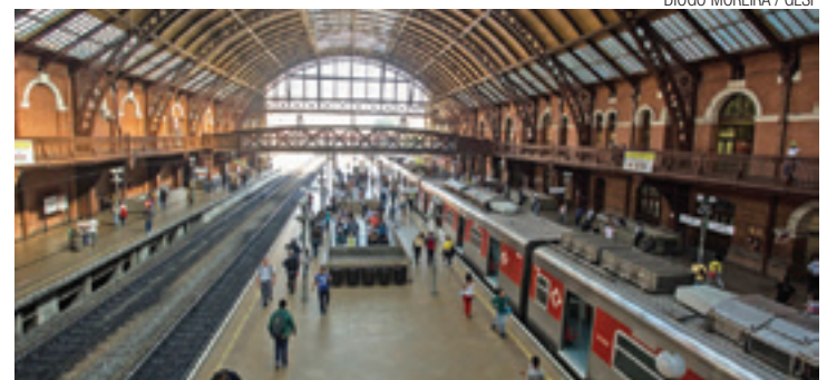
Na Luz - Agressor de mulher apanha de passageiros no trem

O episódio levantou a discussão sobre o assédio no transporte público e fez a polícia se movimentar. Em menos de uma semana a Polícia Civil prendeu mais