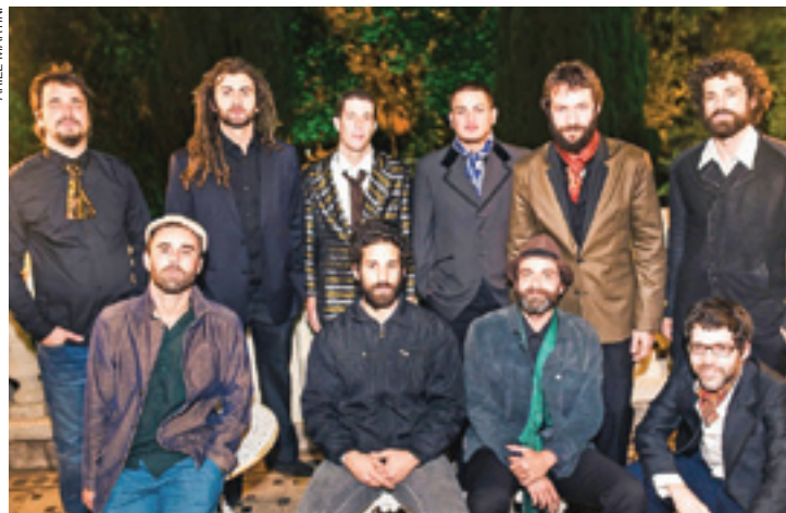
Vinil - Grupo inova em seu novo trabalho e passeia por novos ritmos

Com seu instrumental dançante, as apresentações são uma prévia do seu terceiro álbum, a ser lançado em 2015, parte do projeto de patrocínio do Petrobras Cultural. O grupo agita a cena paulistana com o compacto,