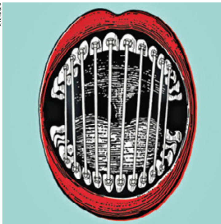
"Poster for Tomorrow" - Seleção de cartazes premiados desde 2009