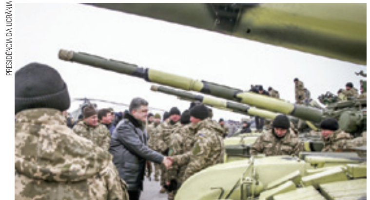
Ataque - Conflito de sete meses já deixou mais de 4,3 mil mortos

O presidente Petro Poroshenko declarou um "dia de silêncio" na quinta-feira, na esperança de reavivar o acordo de cessar-fogo