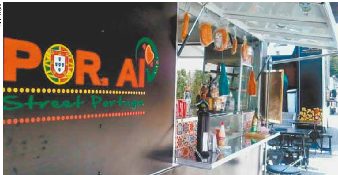
Food Truck - Bolinho de bacalhau Dona Bertha (R$ 10) e Bacalhau a Brás (R$ 20) entre as atrações