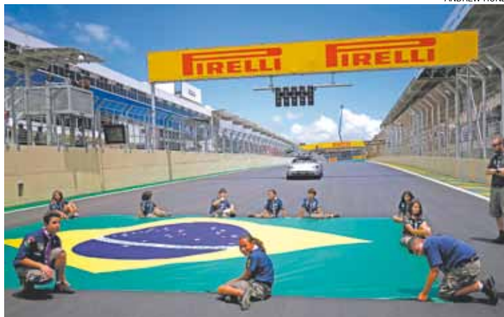
Interlagos - Prova no Brasil está marcada para o dia 15 de novembro

A FIA não informou quando anunciará o calendário de-