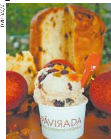
Da Pá Virada - Sabores de panetone e chocotone, entre outros

Quem aprecia os gelatos artesanais, poderá encontrá-los na Da Pá Virada (sabores panetone, chocotone, iogurte com nozes e mel, e abacaxi com vinho, entre outros); Le Botteghe di Leonardo (menta, morango, pistache da Sicília, chocolate sem leite,