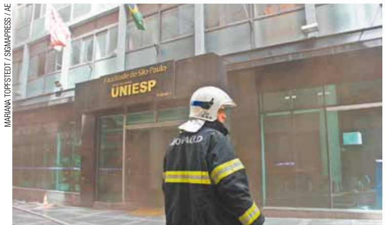
Observação - Bombeiro olha o prédio onde o rescaldo era feito

A assessoria de imprensa da Uniesp informou que o prédio foi esvaziado assim que o incêndio começou. Uma mulher encontrada inconsciente pelos bombeiros morreu no fim da tarde de ontem depois de ter parada cardiorrespiratória na Santa Casa.