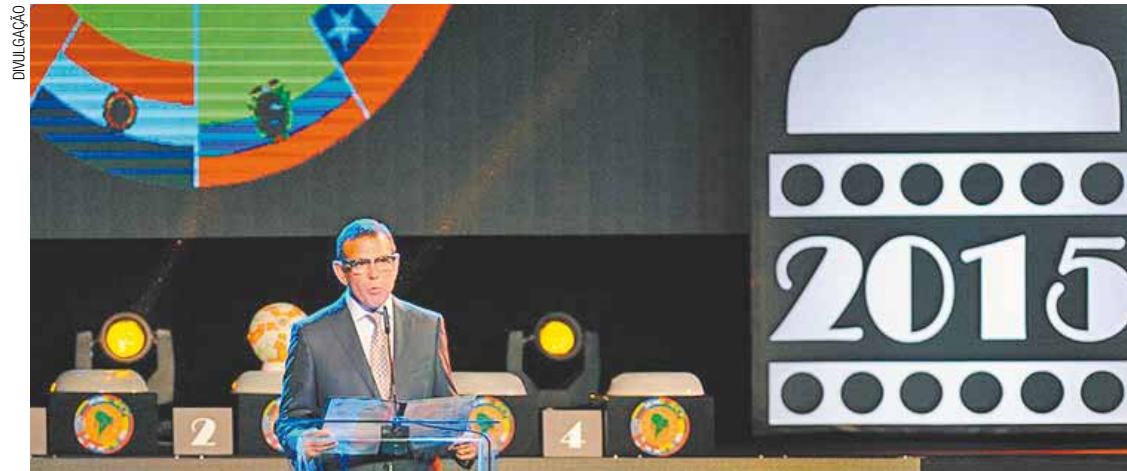
Conmebol - O presidente da entidade, o paraguaio Juan Ángel Napout, no sorteio em Luque, no Paraguai

Inter (terceiro) e Corinthians (quarto) têm 66 pontos no Brasileirão