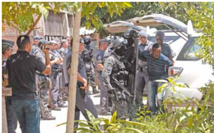
Rendição - Após a chegada da imprensa, bandidos liberaram reféns