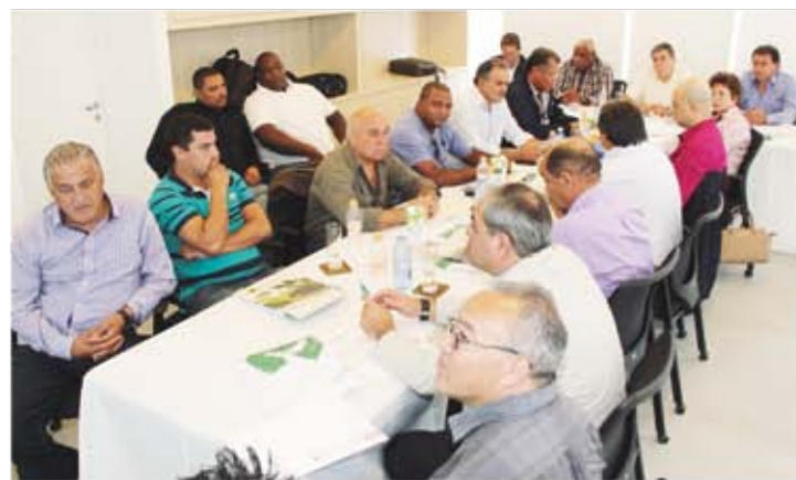
Dirigentes sindicais durante reunião no Siemaco