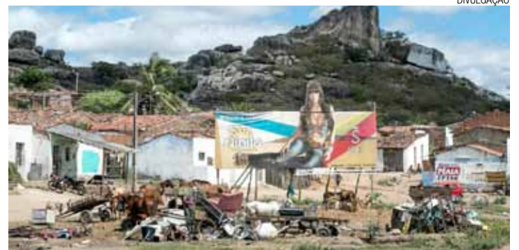
Condomínio - Associação dedicada à criação e experimentação

A Comic Con Experience é inspirada na Comic Con de San Diego, na Califórnia, EUA