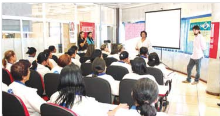
Acidentes com equipes de limpeza hospitalar requerem atenção

O Siemaco acredita e investe na promoção da informação. Em novembro, os destaques foram as palestras "Vamos Falar de Câncer?", ministrada para a equipe do Asseio e Conservação do Céu Formosa, e "O Trabalhador em Limpeza Hospitalar e o Acidente com Lesão por Instrumento Perfurocortante", voltada a profissionais das empresas prestadoras de serviços, equipes de segurança e saúde do trabalho e sindicalistas.