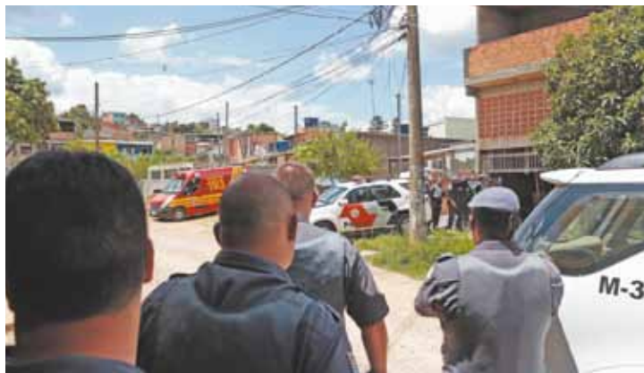
Ocorrência - Policiais militares e do Gate acompanharam as negociações