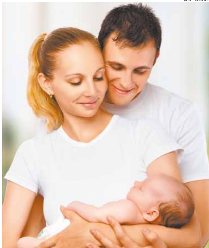
Meu Bolso - Casal recém-casado com filho foi orientado nas finanças