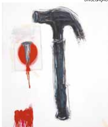
Figuras - Exposição fica aberta até o dia 20 com entrada gratuita

Pela primeira vez, Mozart Fernandes apresentará figuras masculinas em suas pinturas, além de seu interesse na representação de objetos - como o prego e martelo - adicionando questões simbólicas em seu discurso. Na estética, Mozart adiciona planos com transparências sobre suas pinturas, acrescentando mistério aos seus personagens anteriormente explícitos.