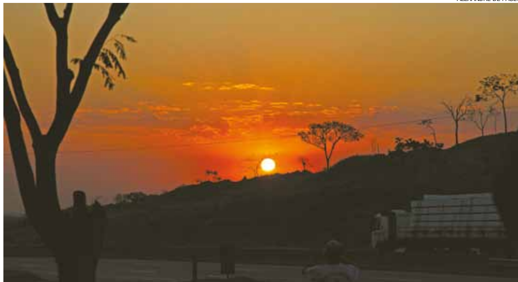
ALEXANDRE DE PAULO

Crepúsculo - O sol, depois de iluminar o dia, parte para o reino das estrelas e as luzes infinitas do universo