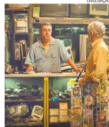
"Na Quebrada" - Sessão com longa-metragem no sábado, às 19h

À tarde será realizada uma experiência com áudio-descrição, em que o público será vendado e um filme será exibido com recursos de acessibilidade, permitindo