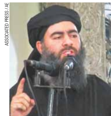
O líder - Abu al-Baghdadi teve sua mulher detida

Os grupos exigem a libertação de prisioneiros islâmicos mantidos por autoridades libanesas, sem nenhuma negociação prévia.