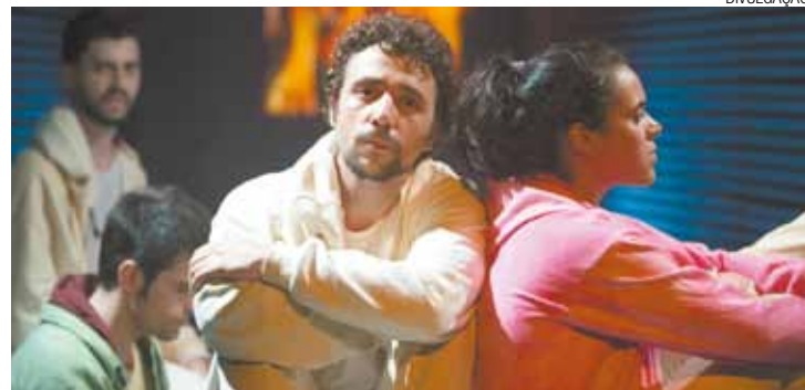
Montagens - Sessões alternadas de quarta a sexta ou sábado e domingo

Mostra está na plataforma de entrada da Estação Ciência da Universidade de SP