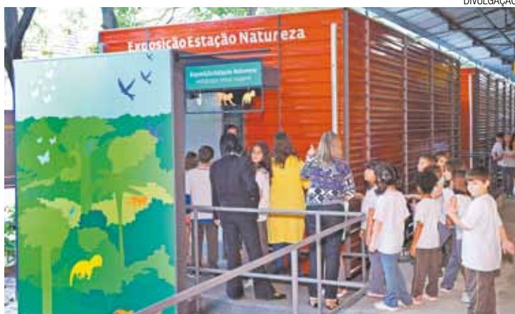
Biomass - Experiência sensorial com simulação de temperatura e aromas

A Estação Natureza São Paulo foi reaberta a exposição interativa sobre biomas brasileiros. A mostra está na plataforma de entrada da Estação Ciência da USP, em cinco contêineres que simulam vagões de trem construídos especialmente para a exposição, na Rua Guaicurus, 1.394, Lapa, próximo ao Shopping da Lapa, de terça a quinta-feira, das 8h às 18h, com entrada gratuita. O agendamento é imprescindível e precisa ser feito pelos telefones 3091-1190 e 2648-0477. Mais informações pelo www.eciencia.usp.br .