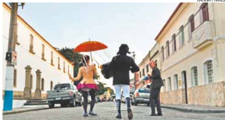
Programação - Projeto de itinerância hoje passa pela área central