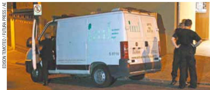
IML - Carro de cadáveres esteve no local para retirar o corpo de Noêmia

O corpo de Noêmia foi encontrado no último quarto do andar de cima. A analista