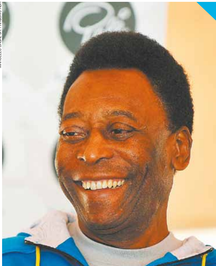
Melhorando - Pelé não precisou fazer hemodiálise no dia de ontem