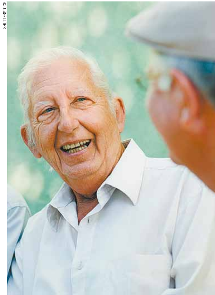
Mais tempo de vida - E menos dinheiro na hora da aposentadoria