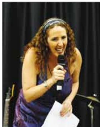
Sánchez: “Saber Inglês valoriza o currículo, aumenta as oportunidades no mercado de trabalho”

Inscrições abertas para novas turmas no Projeto Inglês para São Paulo