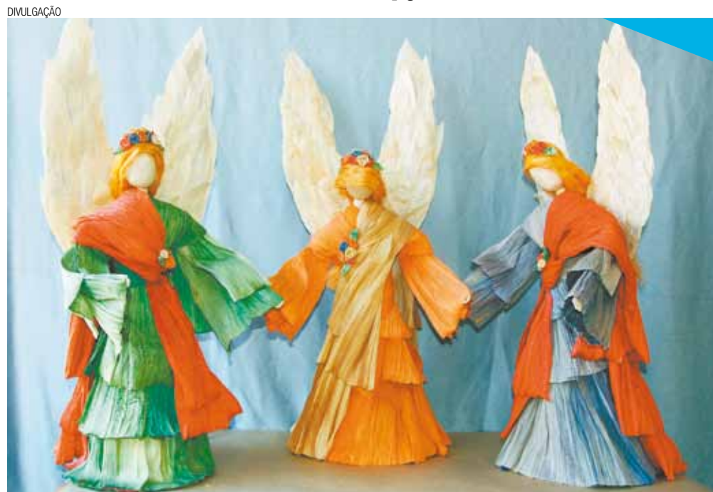
Os anjos - No presépio não faltam as figuras angelicais, que cercaram Cristo em seu nascimento

Para alguns, a ceia natalina está ligada à última ceia de Cristo ao lado de seus discípulos. Segundo algumas culturas, a Ceia de Natal originou-se do antigo costume europeu de deixar as portas das casas abertas no dia de Natal para receber viajantes e peregrinos. E esses, juntamente com a família hospedeira, confraternizavam a data tão significativa para os cristãos. Para essa comemoração era preparada bastante comida, composta por diversos pratos. Essa tradição foi se espalhando pelo mundo e cada região.