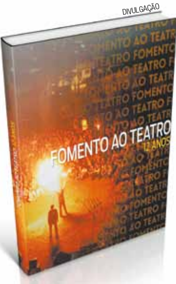
Fomento ao Teatro - Livro terá uma distribuição gratuita

O livro, com tiragem inicial de 5 mil exemplares, é composto por 208 páginas, mais de 50 fotos e compartilha reflexões, lançando mão de textos e dados sobre os impactos e frutos colhidos nesses 12 anos de incentivo à