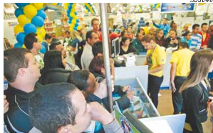
Compras - Desequilíbrio no consumo é um dos vilões do endividamento

Estouro na conta já leva 3 pessoas por dia ao Procon