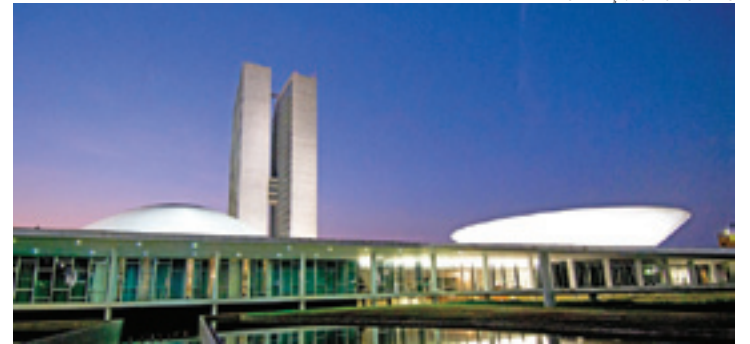
Urgente - Pautas da Câmara e do Senado têm andado muito devagar

Oposicionistas têm impedido nas últimas semanas a votação da matéria que altera meta fiscal