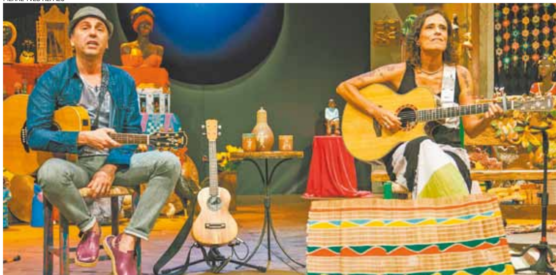
Afinidade - Os dois se apresentaram pela primeira vez este ano em show no Teatro Castro Alves, em Salvador