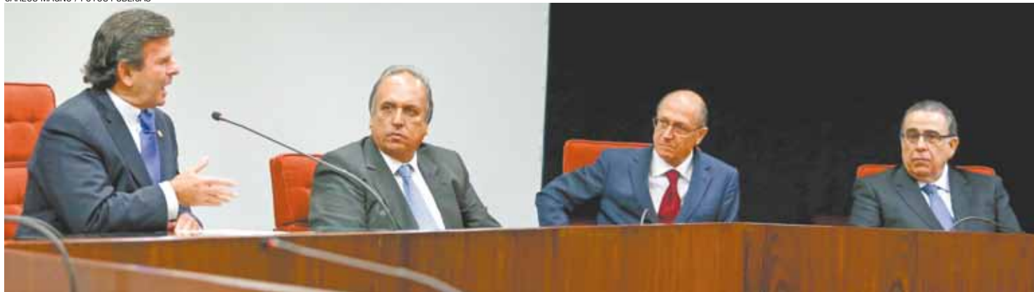
Mediação - O ministro Luiz Fux, do STF, em reunião solicitada por ele com os governadores Luiz Fernando Pezão, Alckmin e Alberto Pinto Coelho