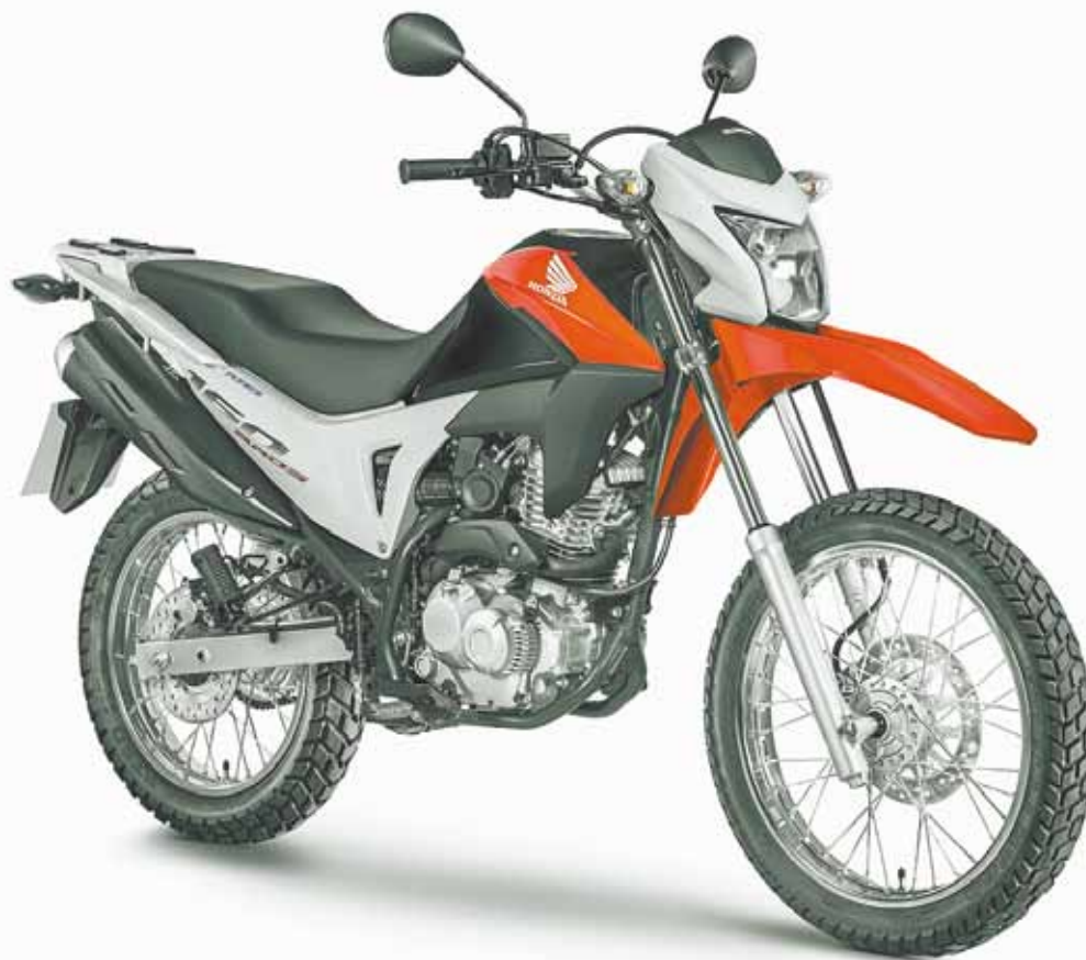
NXR 160 Bros – Atualização de estilo e tecnologia do modelo ajuda a aumentar potencial de vendas

O tanque ganhou novas formas e agora inclui bomba de combustível interna. Com capacidade para 12 litros, seu design está mais compacto, o que contribuiu para um visual mais moderno e avançado.