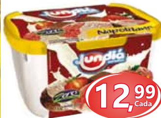
Sorvete Jundiá Pote - Sabores