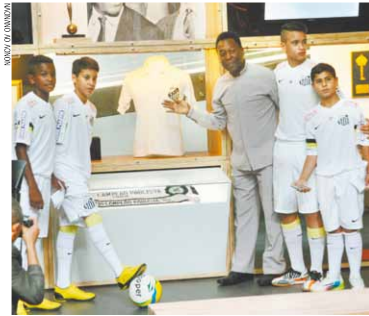
Fé - Pelé fez 74 anos em outubro e lida com problemas na locomoção

Depois do diagnóstico de uma infecção renal, ele passou por cirurgia no dia seguinte para a retirada de cálculos nos rins, ureter e bexiga. Teve alta no dia 14, mas na segunda voltou a ser internado.