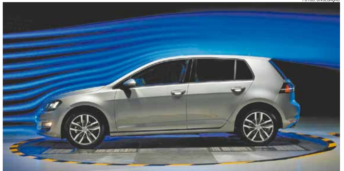
Golf – Teste em túnel de vento mostra o efeito das linhas da carroceria no desempenho aerodinâmico

Independentemente da transmissão e da versão, o Golf com motor 1.4 TSI acelera de zero a 100 km/h em 8,4 segundos e alcança 212 km/h de velocidade máxima.