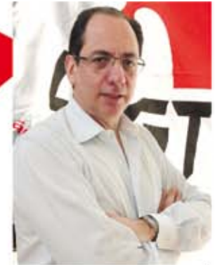
Ricardo Patah, presidente da UGT e do Sindicato dos Comerciantes de São Paulo

Este é um tema que demonstra a união de todo o movimento sindical que busca, efetivamente, contribuir na elaboração de projetos para os Estados que visam à melhoria na distribuição de renda, pois a ampliação dos direitos da classe trabalhadora é um conjunto de ações maior do que as exercidas na relação entre capital e trabalho.