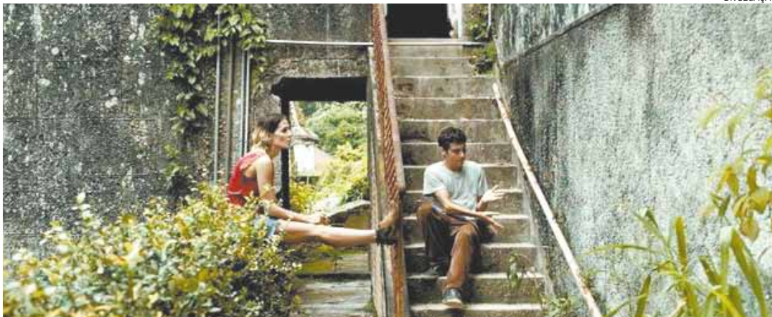
“Boa Sorte” - Filme leva o espectador a refletir sobre a doença que continua matando todos os dias