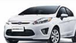
NEW FIESTA HATCH SE 1.6 16V 12 PL-1770 - COMPL./RD R$ 36.500,