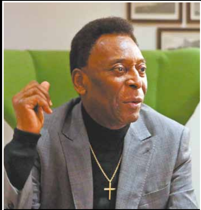
Infecção urinária - Rei do Futebol encara tratamento em SP

Pelé passa por hemodiálise na UTI do Albert Einstein Pág. 22