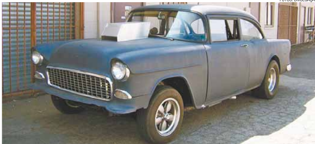
Chevy 55 – Pintura com primer, ausência de para-choque dianteiro e V8 de 454 cavalos sob o capô

O veículo é equipado com motor V8, que produz 454 cv de potência máxima. O câmbio é manual de quatro marchas. A Barrett-Jackson, por enquanto, não informa em seu site ( http://www.barrett-jackson.com ) qual será o lance de partida para a venda do veículo.