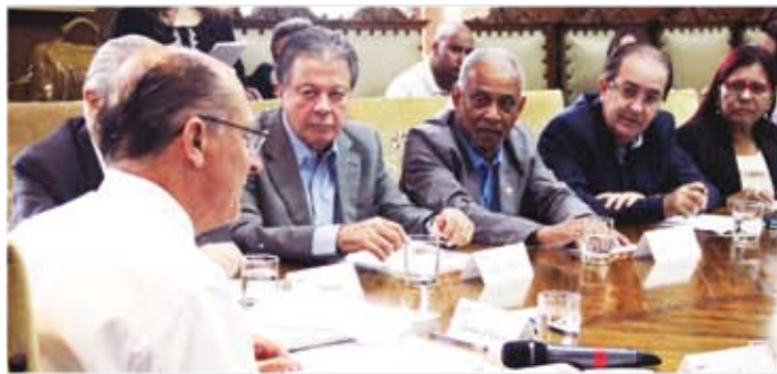
No Palácio dos Bandeirantes, UGT-SP discute reajuste do Piso Regional de São Paulo

No encontro, que aconteceu no Palácio dos Bandeirantes, foi avaliada a recomposição da defasagem acumulada pelo Piso