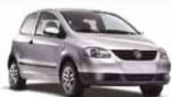
FOX 1.6 2P 05 PL-0422 - COMPL. R$ 19.590,

SEU SEMINOVO COM TAXA DE ZERO OKM SOM MP3 GRÁTIS TAXAS A PARTIR DE (4) 0,99%