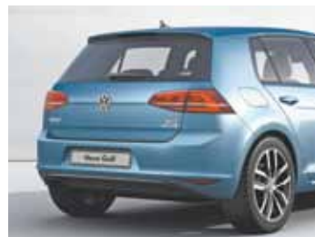
Estilo – Traseira conta com conjunto ótico com tecnologia LED