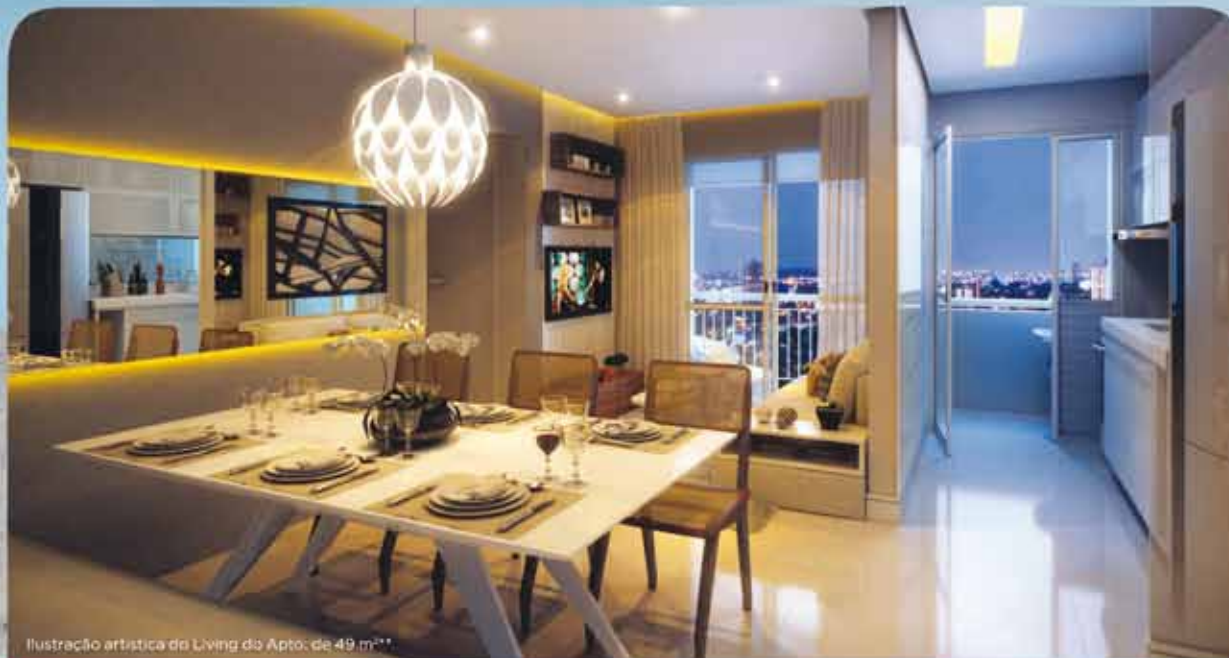
Ilustração artística do Living do Apto. de 49 m 2 .*

AGORA É POSSÍVEL, SIM, VIVER NA BARRA FUNDA.