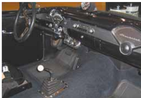
Interior – Estilo clássico, volante esportivo e predominância do preto compõem cenário do filme