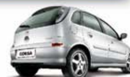
CORSA HATCH MAXX 07 PL-5001 - DH/CONJ. ELÉTR. R$ 16.990,