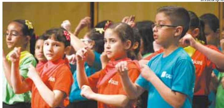
Infantil - Formado por alunos de iniciação musical e cursos sequenciais