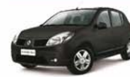
SANDERO EXP 09 PL-2296 SEM ENTRADA R$ 16.990,