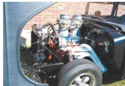
Motor – Potência e customização: tomadas de ar dos carburadores ficam para fora do capô