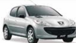
207 XS 1.6 AUT. 10 PL-3668 - COMPL. R$ 23.990,