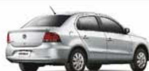
VOYAGE GS 1.0 8V FLEX 12 PL-0042 R$ 22.500,