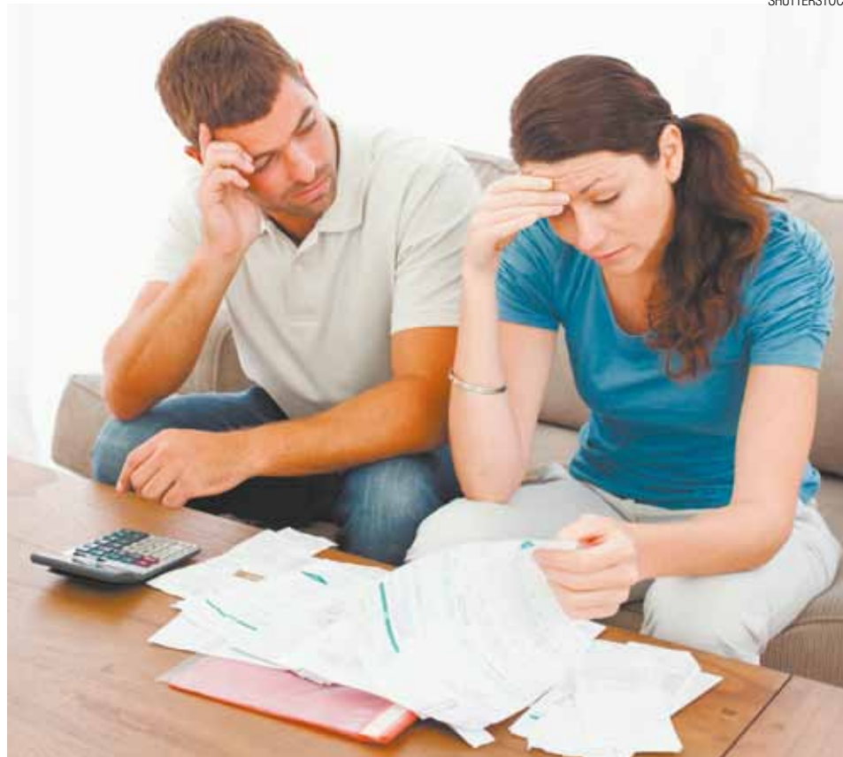
Um problema - Falta de controle no orçamento pode até mesmo gerar uma separação

A origem de tudo é a falta de comunicação. "Tem uma receita que é educação, se reunir com a família e planejar o que vai fazer com o dinheiro da casa. 80% dos brasileiros não controla o dinheiro e 70% não chegam ao fim do mês. Isso acontece principalmente agora no final do ano com 13º. Isso vira mais problema que se resolve. Porque pagam as dívidas e fazem novas e em março já estão com problemas de novo por conta de matrículas, IPTU e IPVA", disse.