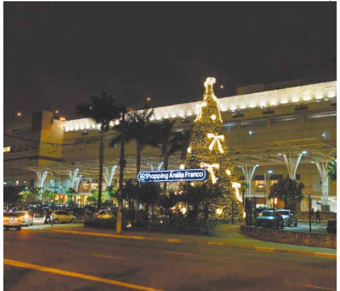
Fachada - Shopping Anália Franco vai dar três BMW zero de presente para os clientes no dia 5 de janeiro

São oferecidos dois modelos de lata de bolo, cada um com sabor diferente: chocolate com amaretto e chocolate com nozes (limitados a dois por CPF e enquanto durar o estoque). O sorteio do automóvel será dia 5 de janeiro, às 19h. O regulamento completo está no www.shoppinganalíaf Franco.com.br