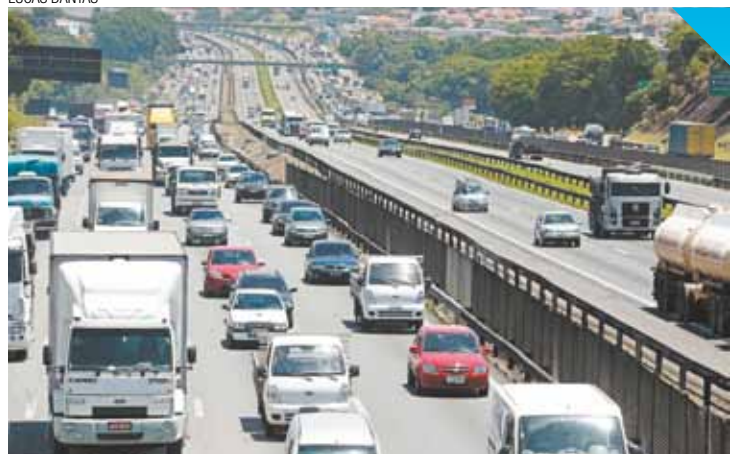
Lentidão - A orientação é escolher horário de melhor fluxo para viajar