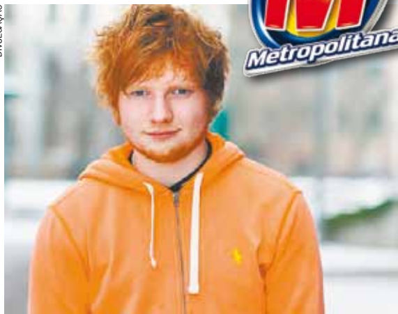
Seria a primeira vez de Ed Sheeran no Brasil