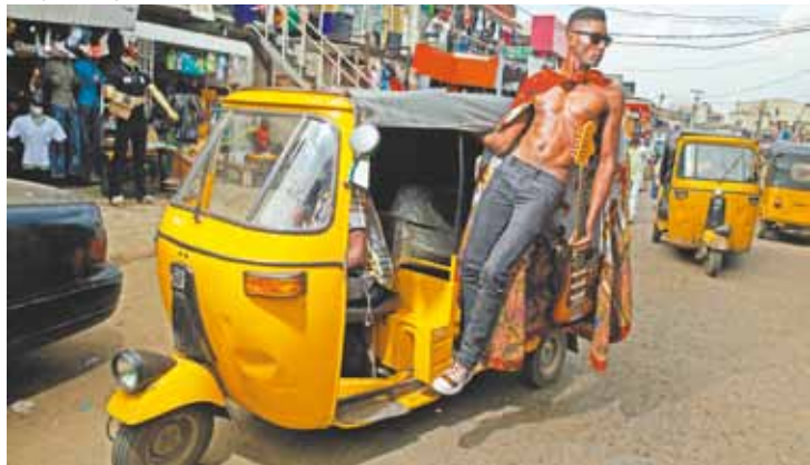
Captain Rugged - Músico apresenta mistura de funk e blues acústico