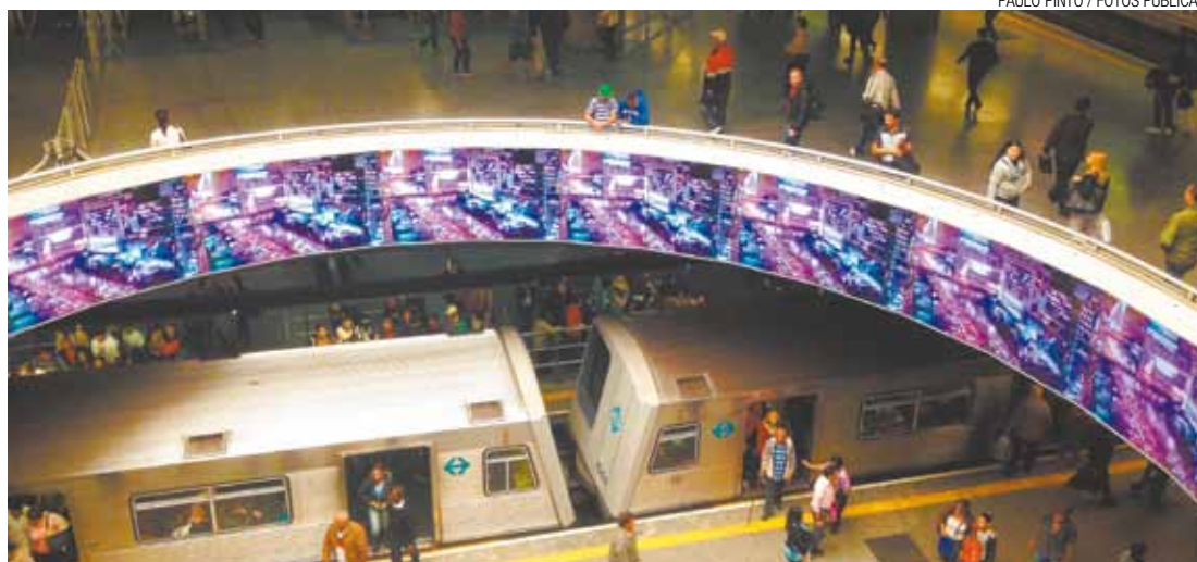
Estação Sé - Profissionais estarão testando pelo último dia a glicemia dos passageiros do Metrô

Somente conhecer a doença pode prevenir as complicações