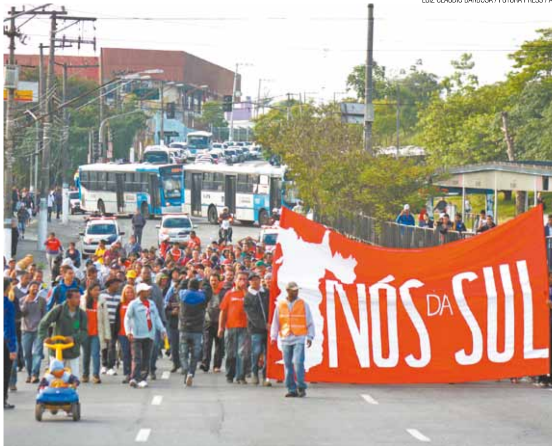
Manifestantes - Seguiram a pé até a Subprefeitura da Capela do Socorro e pediram construção de casas

De acordo com a CET, os manifestantes se dispersaram na própria Teotônio Vilela por volta das 8h25.