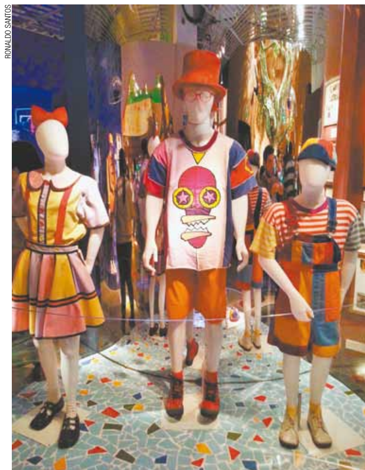
Programação - Retorno com diversas atividades simultâneas