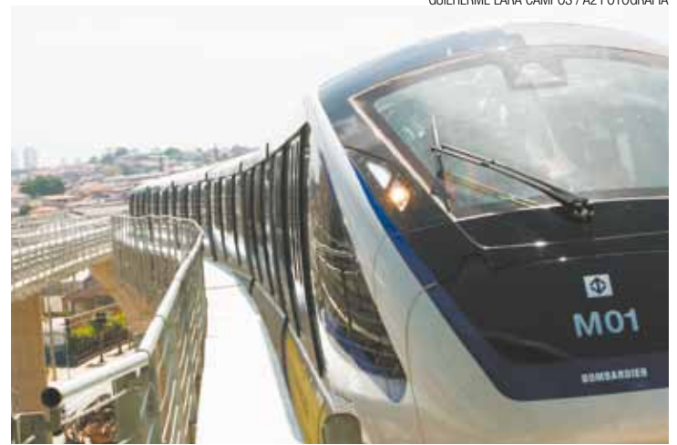
Aumentando o fluxo - Monotrilho será diário a partir de dezembro