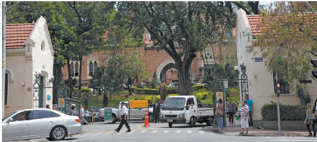
Problema antigo - A crise financeira já fez o hospital fechar seu pronto-socorro em julho deste ano