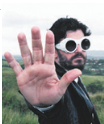
Título - Menção ao personagem do livro “O Segredo de Joe Gould”