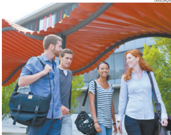
Na Alemanha - Mais de 80 programas de bolsas de estudo e pesquisa

Somente em 2013, cerca de 9 mil brasileiros ingressaram em algum curso universitário (graduação, pós-graduação, mestrado ou doutorado) em países como França, Holanda e Alemanha. E as portas da Europa continuam abertas para os brasileiros.