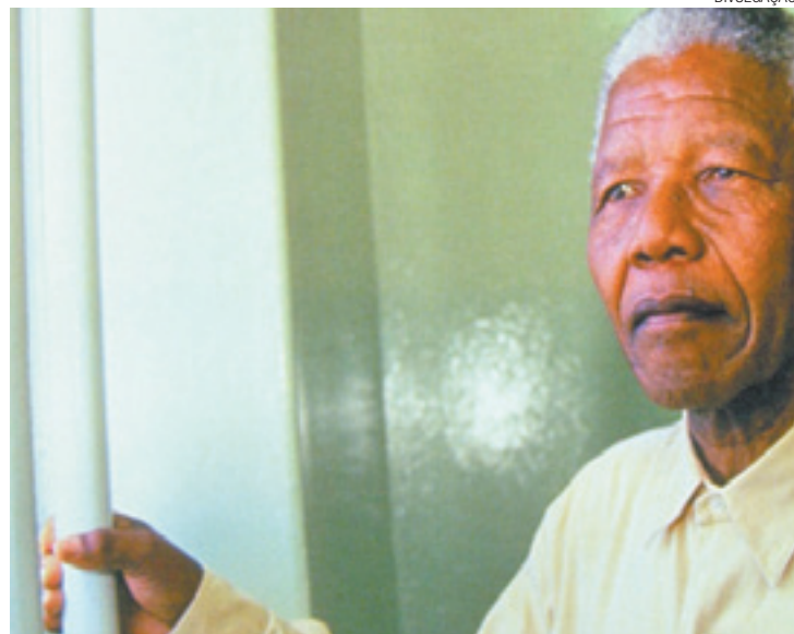
Na programação - Filme “Mandela: Filho de África, Pai de uma Nação”