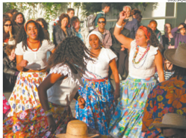
Tambor de crioula - Tradicional principalmente no Maranhão

Manifestação tradicional presente principalmente