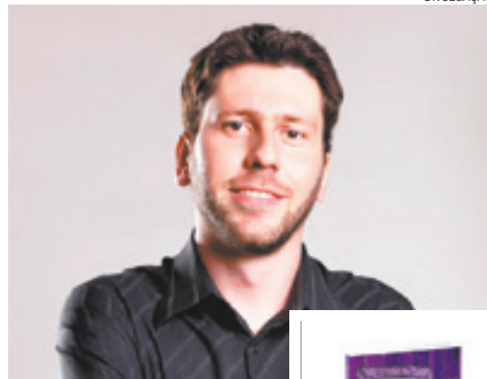
Matheus - Narrativas enriquecem a experiência do leitor