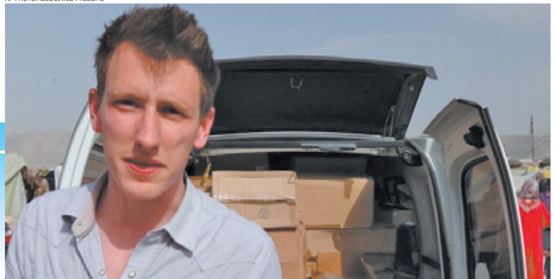
Refém - O norte-americano, de 26 anos, foi capturado em 2013 durante missão humanitária na Síria