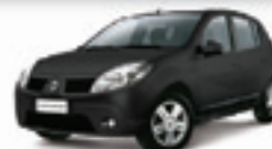
SANDERO EXPR. 09 PL-2296 SEM ENTRADA R$ 16.990,