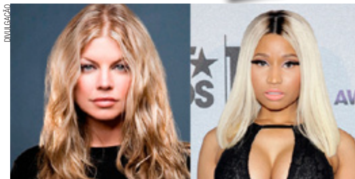
"The Dutchess" ainda não tem data de lançamento.

A cantora confirmou a participação de Nicki em seu álbum durante uma entrevista, mas não deu mais detalhes sobre isso. Então teremos que aguardar até ela liberar a música.