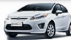
NEW FIESTA HATCH SE 1.6 16V MEC. 12 PL-1770 COMPL./RD R$ 36.500,