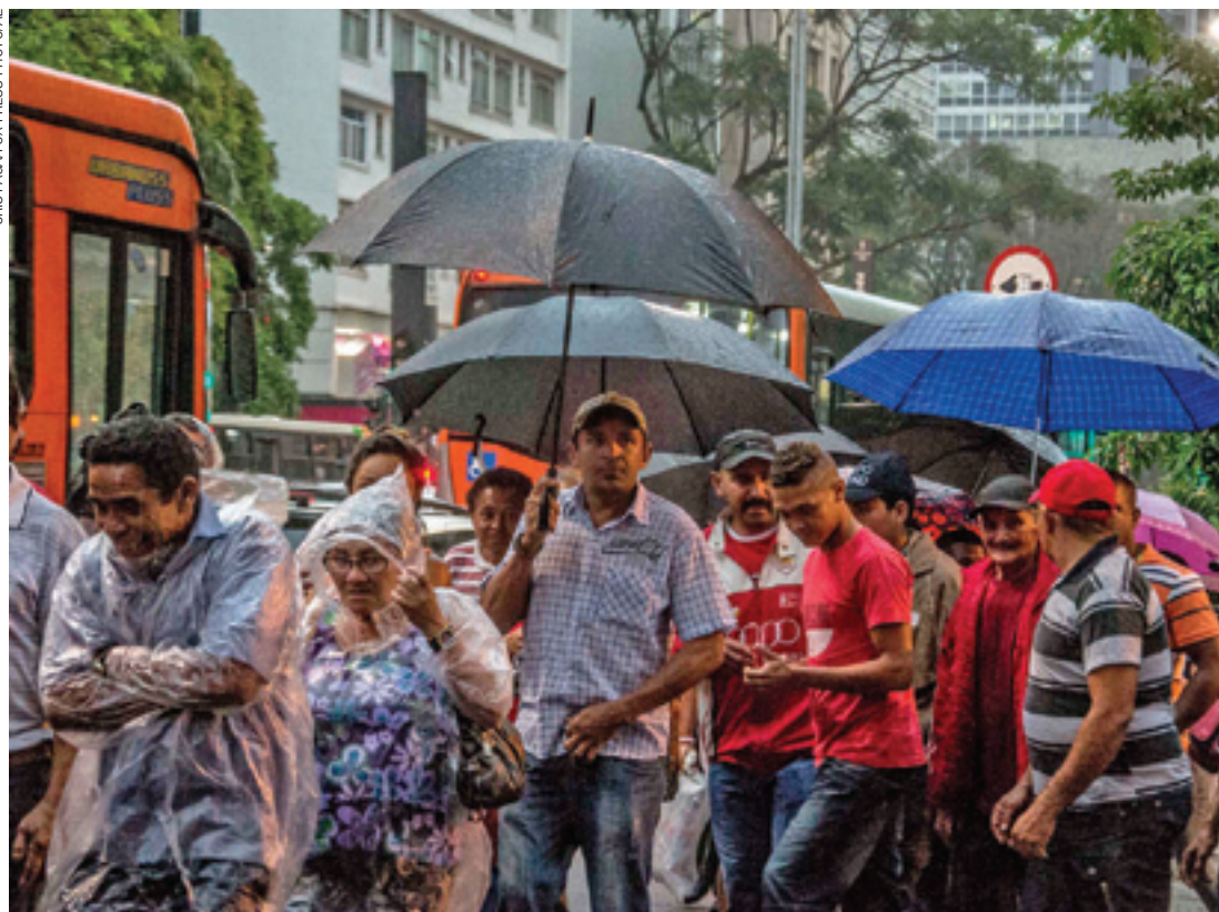
Proteção - No Centro da capital paulista, as pessoas usam capas e correm para tentar se esconder da chuva

Segundo os meteorologistas do CGE, os próximos dias seguem com tempo instável em São Paulo. Devem ser observados novos períodos de pancadas de chuva isoladas, que podem ter até forte intensidade. Entretanto, as precipitações se deslocam de maneira rápida e a chuva vai embora também de forma quase instatânea.