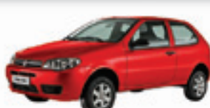
PALIO 1.0 2P 12 PL-0288 R$ 17.990,