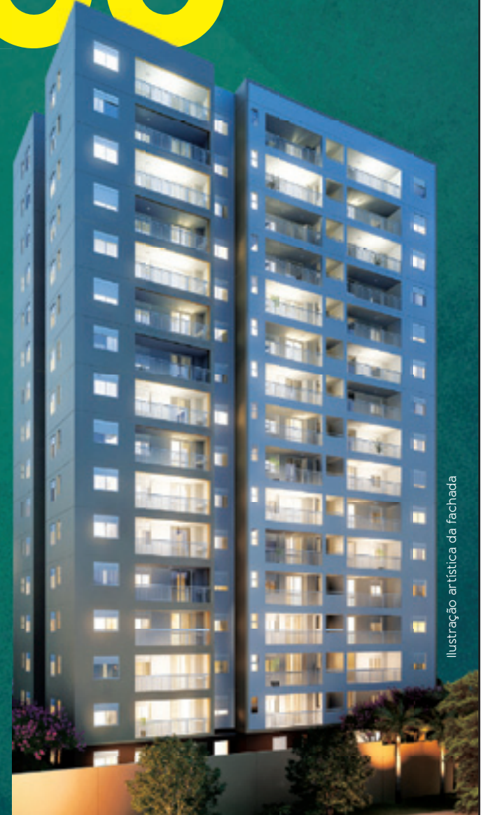
Ilustração artística da fachada