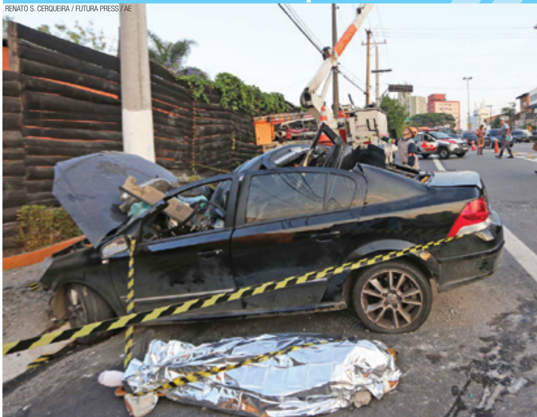
Alta velocidade - Na Avenida Washington Luís, motorista perdeu a vida ao colidir; outra pessoa se feriu