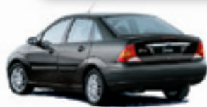
FOCUS 1.8 03 PL-6041 - COMPL. R$ 14.990,