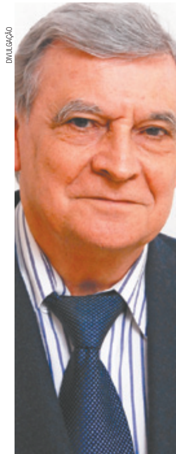
Prejuízos - Meinão aponta danos à classe e aos pacientes

A Agência Nacional de Saúde Suplementar (ANS) suspendeu a comercialização de 65 planos de saúde de 16 operadoras por desrespeito aos prazos máximos de atendimento e por negativas indevidas de cobertura. De acordo com a ANS, o 11º ciclo do Programa de Monitoramento da Garantia de Atendimento recebeu 12 mil reclamações. As operadoras que negaram indevidamente cobertura podem receber multa.