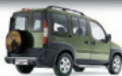
DOBLÔ ADVENTURE LOCKER 1.8 8V FLEX 09 PL-9051 - COMPL. R$ 35.500,