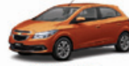
ONIX LT 1.4 13 PL-2381 - ABS/AIR BAG/DH MYLINK R$ 33.990,