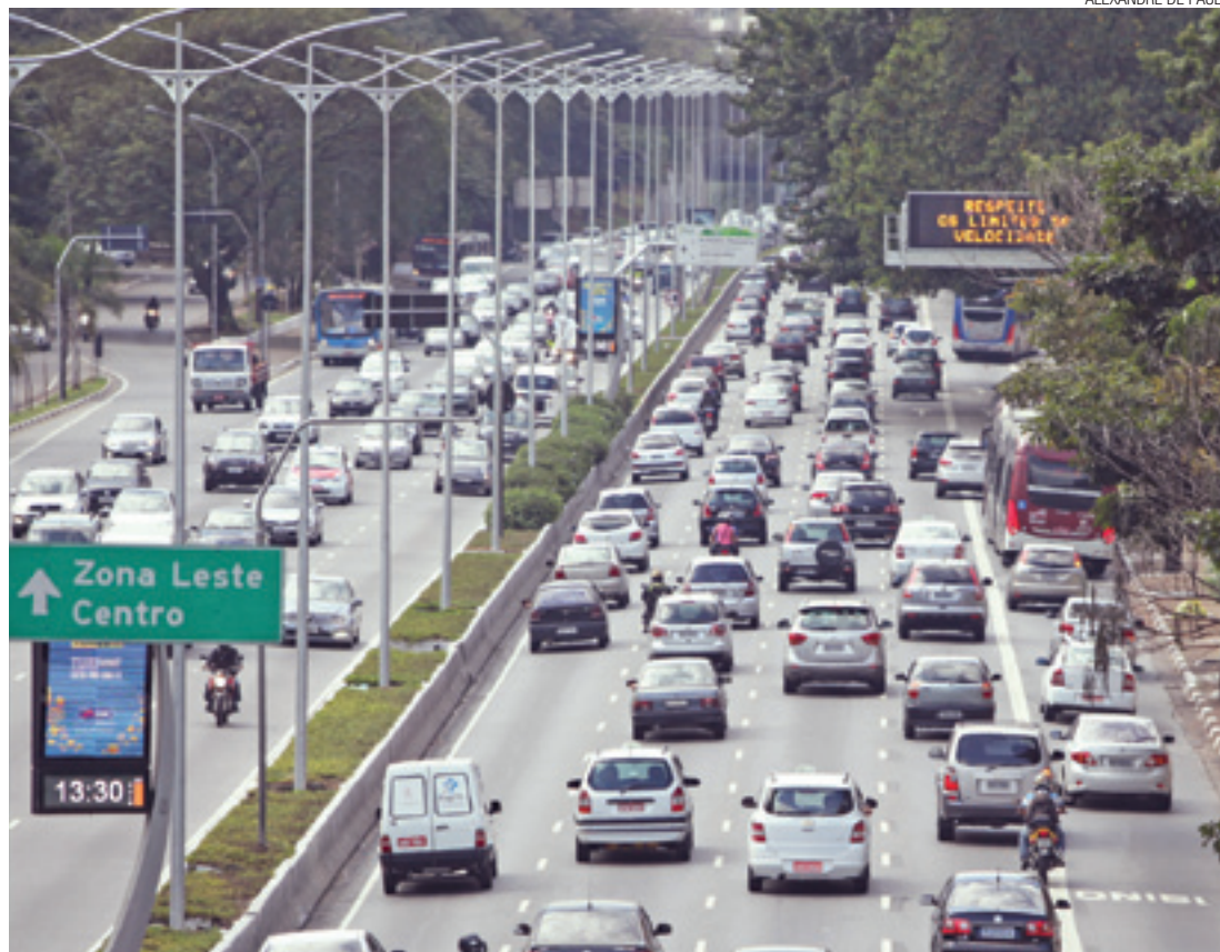
Infração comum - Carros (à dir.) invadem o corredor de ônibus e acabam sendo multados pela CET

Faixas exclusivas de ônibus fizeram com que as multas dobrassem em 2014