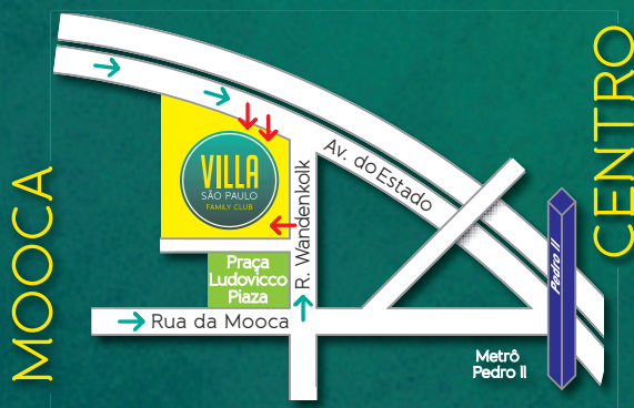
Mapa de acesso sem escala.