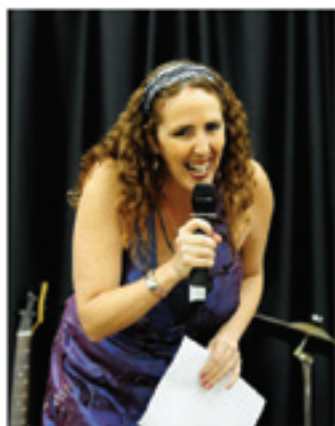
Sánchez: "Saber Inglês valoriza o currículo, aumenta as oportunidades no mercado de trabalho"

Inscrições abertas para novas turmas no Projeto Inglês para São Paulo