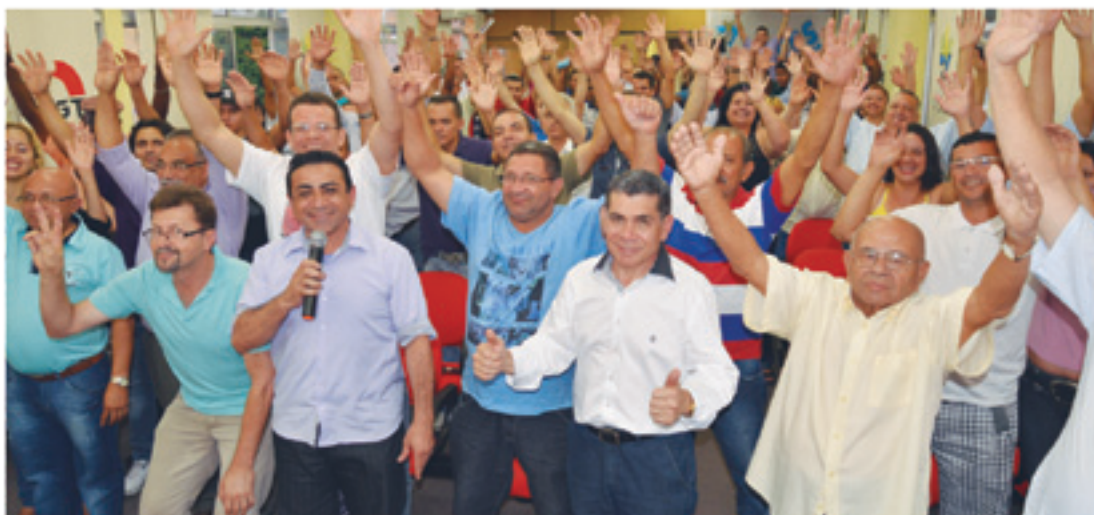
Unidos e mobilizados, os trabalhadores alcançam importantes vitórias para suas categorias, cobrando de seus patrões a parte dos dividendos que lhes cabe

Nossa Campanha Salarial 2014/2015 foi encerrada com sucesso para os trabalhadores. Conquistamos reposição da inflação, mais aumento real, além de outros benefícios significativos. Por unanimidade, foi aprovada a última proposta feita pelo sindicato patronal durante a Assembleia Geral, realizada dia 3 de novembro, no auditório do Sindicato dos Padeiros, na Bela Vista, capital. Conseguimos reajuste de 9% no piso salarial. O reajuste salarial é linear, de 8%. No conjunto das negociações nacionais, estamos dentro das