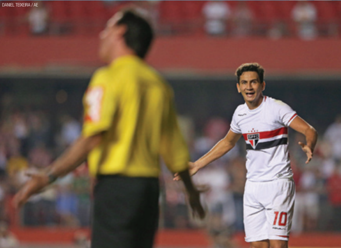
Bronca - Gol irregular do Internacional irritou jogadores do São Paulo. Empate em 1 a 1 foi ruim para os dois times Pág. 14