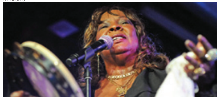
Hit - Comemoração de 50 anos do sucesso “Dancing in the Street”