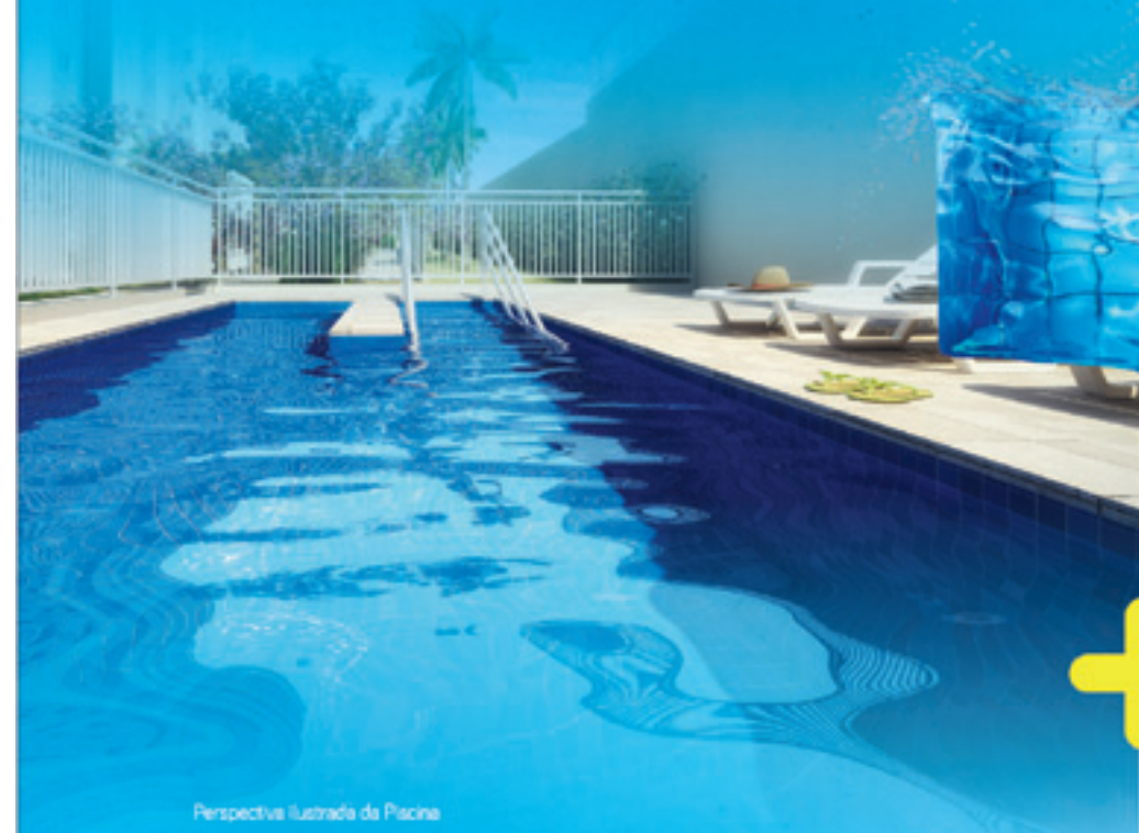
Perspectiva ilustrada da Piscina