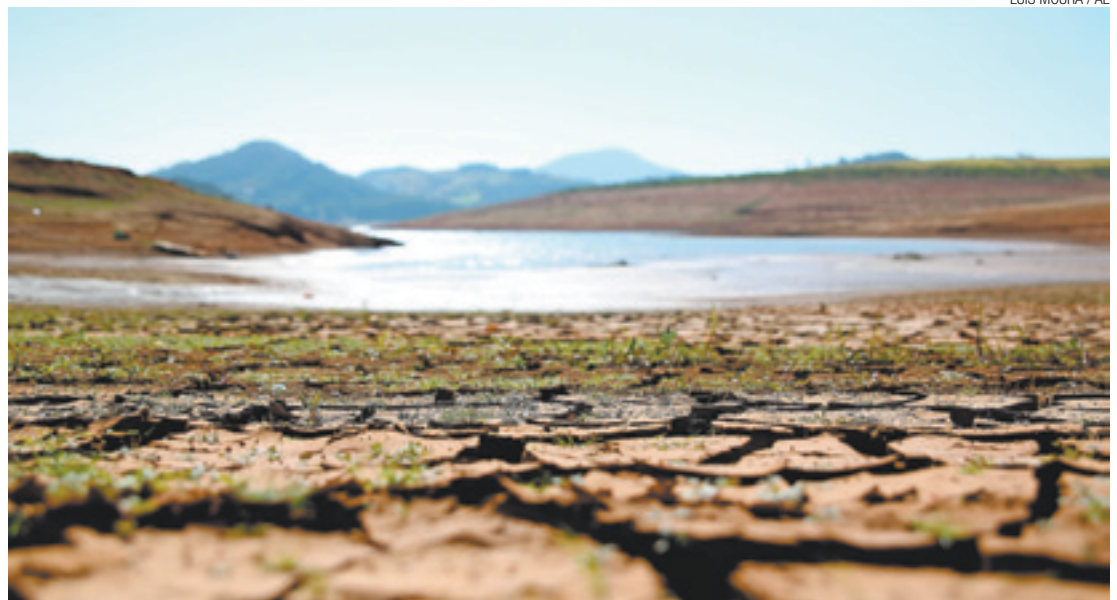
Vida nova - Sistema Cantareira pode recuperar toda sua fauna e flora com a água do Rio Paraíba do Sul

Segundo ele, obras estruturais e de maior dimensão devem entrar em operação até o final do próximo ano. “Precisamos ver qual resultado vamos obter com o novo bônus.