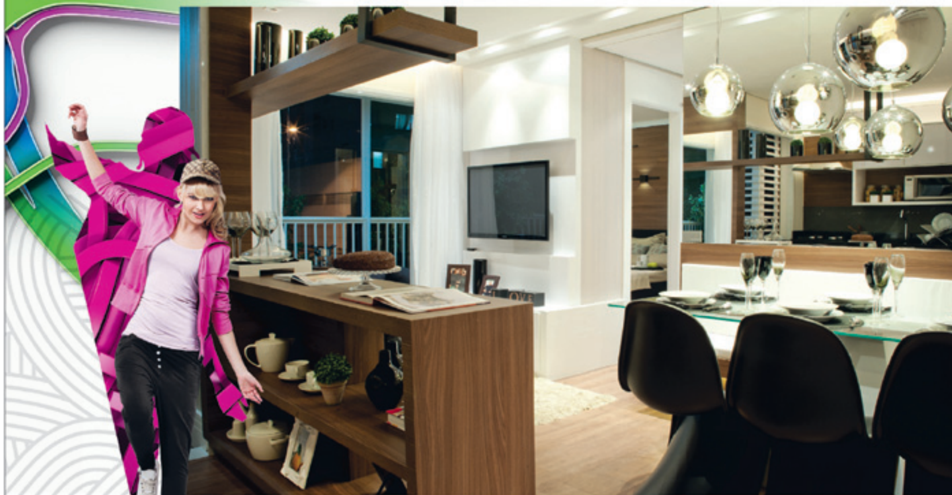
Foto do Apto. Decorado de 55 m 2

1 e 2 dorms. De 33 a 55 m 2 com terraço gourmet