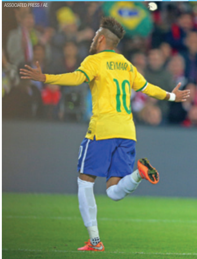
Aplausos - Neymar e Seleção golearam a Turquia por 4 a 0 Pág. 14