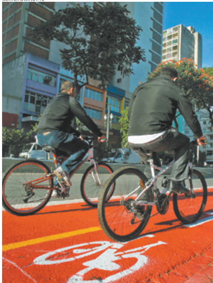
Cicloviária - Prefeito Fernando Haddad optou pelas duas rodas

Convívio entre ciclistas e motoristas não é pacífico: o segundo tem levado as punições