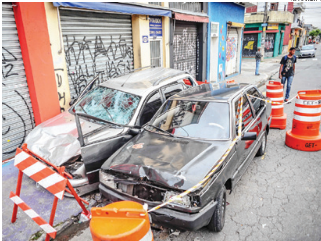
Violência no trânsito - Além de atropelar 15, motorista bateu em outro carro (o escuro) e depois fugiu

Vítima diz que escutou a freada e viu o carro em cima