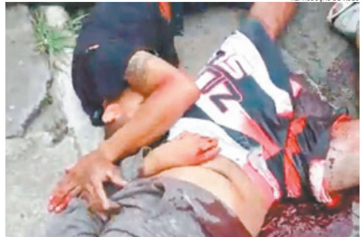
REPRODUÇÃO DE VÍDEO

Em 2009, foram 1.048 homicídios provocados por policiais no Rio - 54% do que foi praticado pela polícia em todo o País.