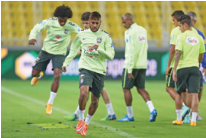
Em Istambul - Equipe brasileira treina no Sükrü Saracoglu Stadium