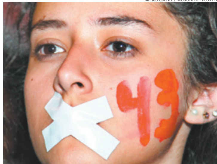
Protesto - No rosto a marca dos 43 estudantes desaparecidos