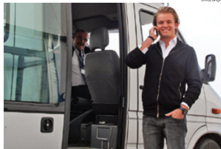
Decisão - Rosberg trava disputa acirrada com companheiro de equipe

fique entre ele e Hamilton - se o inglês terminar em segundo, garante o título sem depender de ninguém. Para Rosberg, o melhor candidato para fazer o "serviço" é Massa. O brasileiro vem crescendo a cada corrida na segunda metade do campeonato e pilota pela equipe que mais se aproximou da Mercedes nas últimas provas.