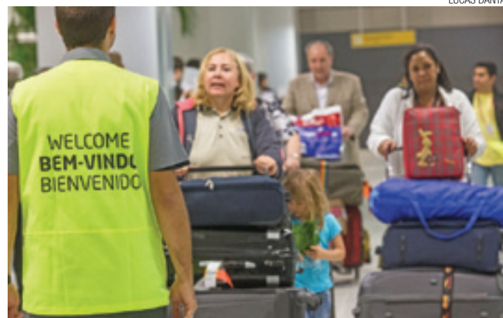
Terminal 3 - Tem sido considerado o mais moderno e funcional