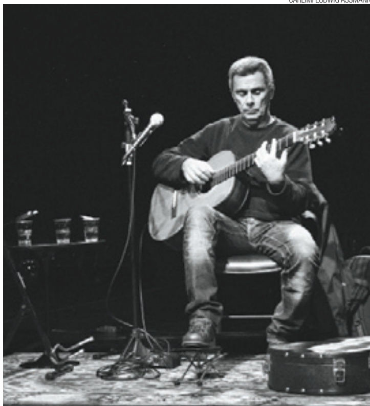
Guinga - Nova forma ao conteúdo da obra de um bom compositor

A canção “Senhorinha” ganhou popularidade ao fazer parte da trilha sonora da novela “Sinhá Moça” (1986), em versão cantada por Ron-