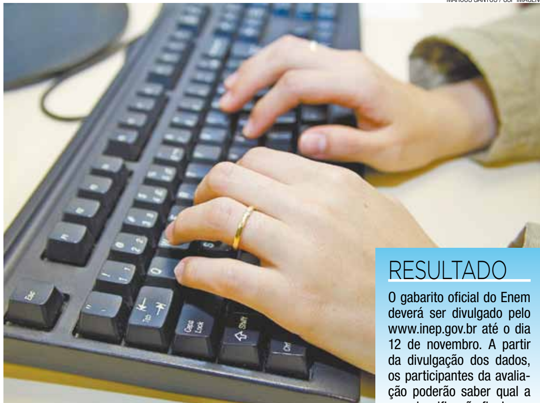
Tensão - Resultado do Enem será divulgado só pela internet