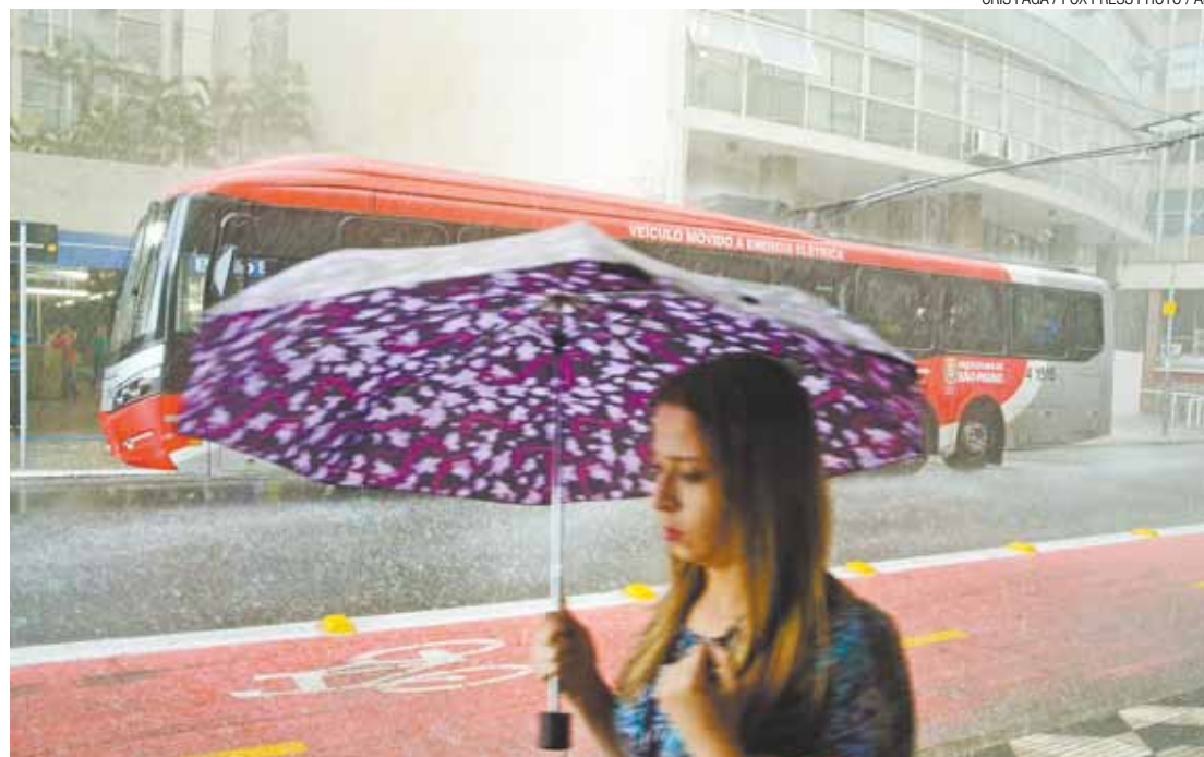
Estação São Bento - Transeunte tenta se esconder da chuva forte, na tarde de ontem, perto do Metrô

Houve registro de alagamento na Avenida Nove de Julho, nos sentidos bairro e centro, na Rua São Paulo, na Liberdade, e na Avenida Alcântara Machado.s