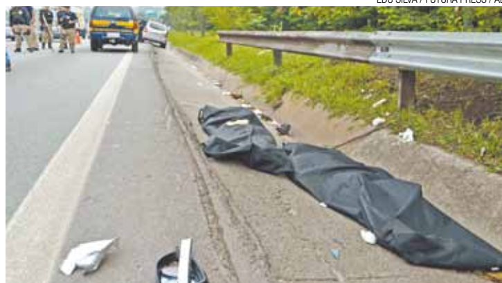
Acidente - Quatro pessoas foram atingidas, duas morreram na hora

De acordo com a Polícia Rodoviária Federal, os quatro estavam caminhando pela faixa de rolamento que dá acesso à Rodovia Fernão Dias no momento do atropelamento. Como eles caminhavam no sentido contrário dos carros, foram atingidos de frente. Com o impacto,