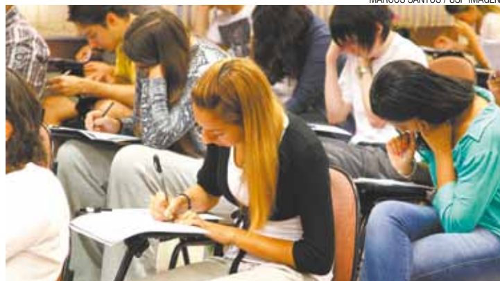
Disputa - Região Sudeste conta com o três milhões de inscritos

A região com o maior número de candidatos é a Sudeste (35,27%) com 3.076,697 de estudantes. Em segundo lugar fica a Região Nordeste, com 2.877,673 inscrições, ou