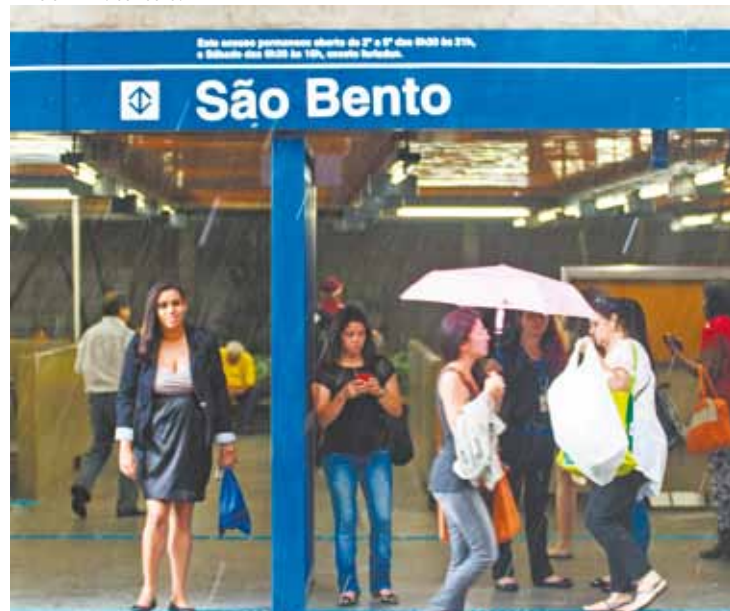
Proteção - Com a chuva forte, passageiros do Metrô esperam