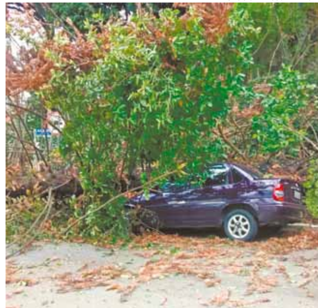
Atingido - Árvore cai sobre carro no bairro da Mooca

Por causa da chuva, as linhas 1 - Azul, 2 - Verde e 3 - Vermelha do Metrô operavam com velocidade reduzida até o início da noite de ontem.