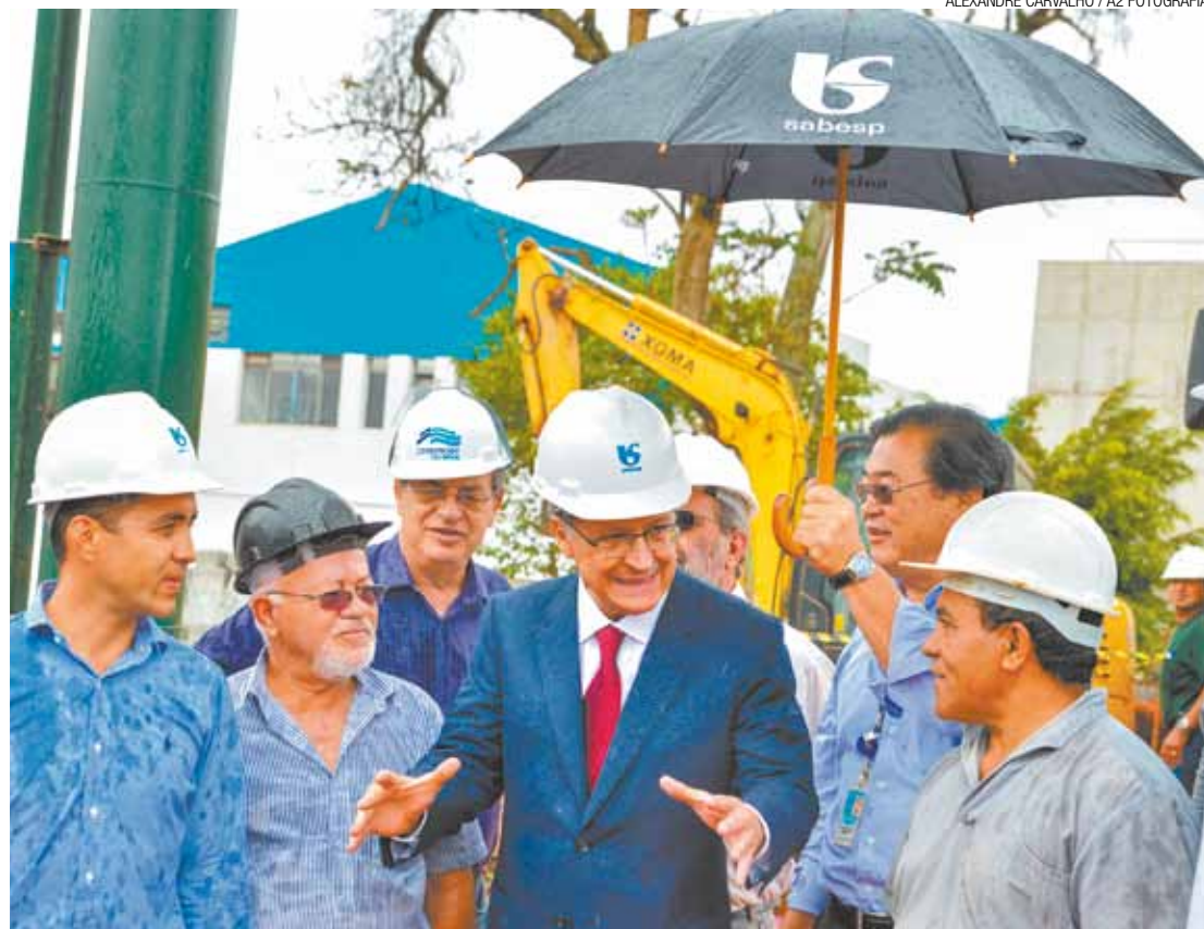
A todo vapor - Governador conversa com operários e diz que obras garantem água até o fim de 2015

Alckmin garantiu que a dependência do sistema está sendo reduzida. “Antes, o Cantareira representava metade do abastecimento da Grande São Paulo e hoje representa só 1/4. Nós tirávamos 33 m 3 por segundo e agora reduzimos para 19. Com mais 1 m 3 que vamos captar do Guarapiranga, será reduzido para 18 m 3 .”