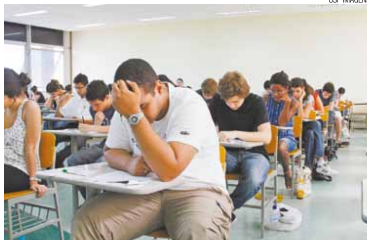
Concentração - Esse é um ponto básico para ir bem na prova