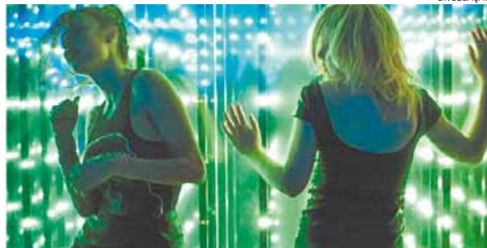
Rede - Para compor personagens, diretor pesquisou perfis no Facebook

A trama se concentra em Chris (Marisol Ribeiro), uma jovem rica, linda e entediada com sua vida vazia. Na faculdade ela conhece Julia (Thaila Ayala) e a empatia é imediata. Juntas, elas viverão pela noite paulistana aventuras repletas