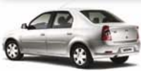
LOGAN AUTH. 1.0 08 PL-1183 R$ 14.990,

SEU SEMINOVO COM TAXA DE ZERO OKM (1) SOM MP3 GRÁTIS (3) TAXAS A PARTIR DE (4) 0,99%