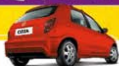
CELTA SPIRIT 1.0 2 PT 2009 Pl. 6913 - DH/VE R$ 16.900