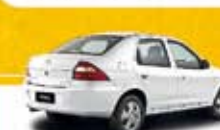
PRISMA LT 1.4 2012 Pl. 5121 - COMPLETO R$ 25.900