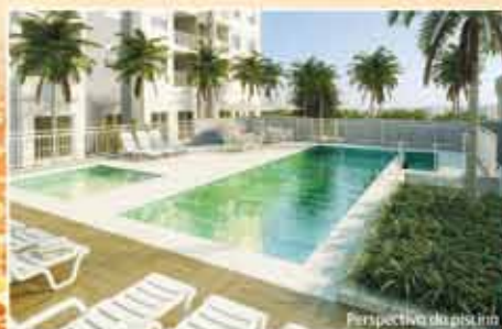
Perspectiva da piscina