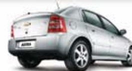
ASTRA 4P HATCH 2.0 AUT. 09 PL-9356 - COMPL. R$ 27.900,