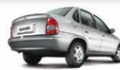
CLASSIC 05 PL-3026 APENAS 43.000 KM R$ 14.900,