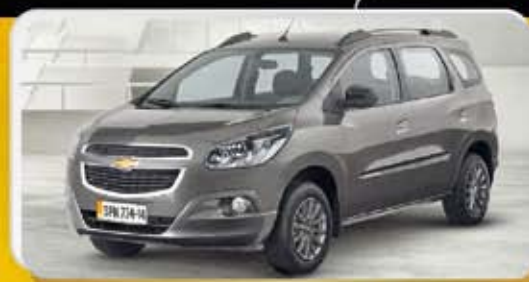
SPIN 2015 OKM (4)

COMPLETO: AR, DIREÇÃO, CONJUNTO ELÉTRICO, AIR BAG E ABS