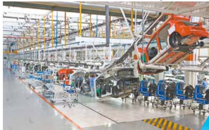
Montagem - Indústrias voltam a ter cobrança de IPI normal