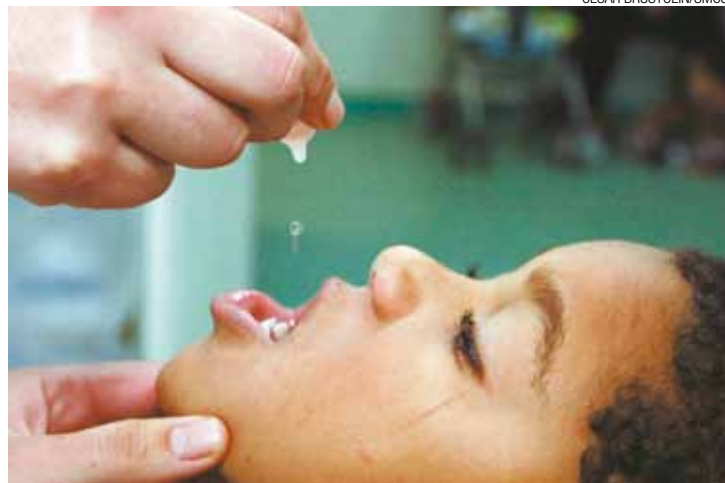
Dia do Zé Gotinha - Crianças de até 5 anos devem ser vacinadas