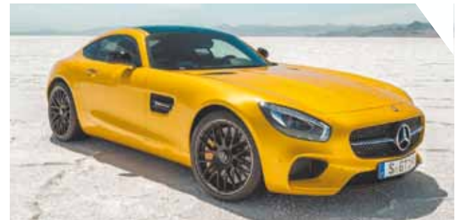
AMG GT – Propulsor V8 produz 510 cavalos e permite acelerar de zero a 100 km/h em 3,8 segundos

Na Mercedes-Benz, uma das estrelas da marca é o modelo esportivo para duas pessoas AMG GT, que abriga motor AMG 4,0 litros V8 biturbo com 510 cv. O novo GT combina comportamento dinâmico e alto desempenho, além de bom nível de eficiência. O modelo acelera de zero a 100 km/h em 3,8 segundos e alcança velocidade máxima de 310 km/h. Ao mesmo tempo, o veículo é confortável e confiável para o uso diário, graças à sua tampa traseira, fácil acesso ao porta-malas, alto nível de conforto em longos percursos e os sistemas de assistência 'Intelligent Drive'. A combinação da estrutura espacial em alumínio, motor V8 com lubrificação por cárter seco, transmissão de dupla embreagem com sete marchas junto ao eixo traseiro, diferencial blocante, suspensão esportiva em alumínio e o baixo peso resultam em uma relação entre peso e potência de 3,22 kg por cavalo.