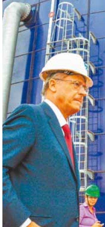
Em Santos - Governador disse que o pior já ficou para trás

ESTADÃO CONTEÚDO - O governador Geraldo Alckmin (PSDB) disse ontem, em Santos, que o período mais crítico da estiagem já foi embora e que a crise hídrica está com seus dias contados, em razão das providências que estão sendo tomadas pelo Governo do Estado contra o desabastecimento de água. Alckmin reiterou que o esgoto da Grande São Paulo será tratado para a produção de água para consumo humano, a partir de dezembro de 2015, a fim de reduzir a dependên-