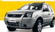
ECOSPORT XLS 1.6 2006 Pl. 0427 - COMPLETO R$ 25.900