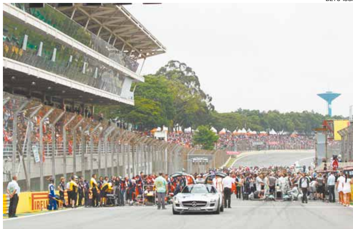
Sinal - Cerca de 77 milhões de lares viram as imagens do GP de 2013

“É a maior reforma do autódromo desde 1990. Começou este ano e será concluída em 2015 com a nova área de boxes”, disse o prefeito Fernando Haddad. “Vou recomendar que o contrato [para realização do GP na cidade] seja estendido até 2030”, afirmou Rohonyi. “Uma corrida de F-1 atrai visitantes e é vista em todo o mundo. Isso é ótimo para o turismo. Por isso o ministério, por meio do PAC, está investindo nessa obra”, justificou o