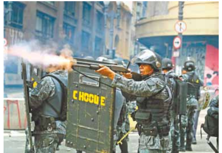
Confronto - Balas de borracha foram outra vez liberadas pela Justiça

A Defensoria Pública de São Paulo ingressou com a ação em abril deste ano contra o uso das balas de borracha e teve a resposta em 24 de outubro, quando conseguiu a proibição em 1ª instância. O documento também “garantia o exercício de direito de reunião”. Segundo a decisão anterior, a PM não poderia usar as balas.