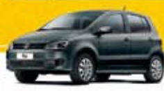
FOX TREND 4 PTS 2012 Pl. 5324 - COMPLETO R$ 29.500