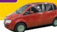
IDEA ELX 1.4 2006 Pl. 1261 - COMPLETO R$ 22.900