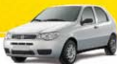
PALIO 1.0 2PTS 2004 Pl. 6375 - VE/TE R$ 12.500