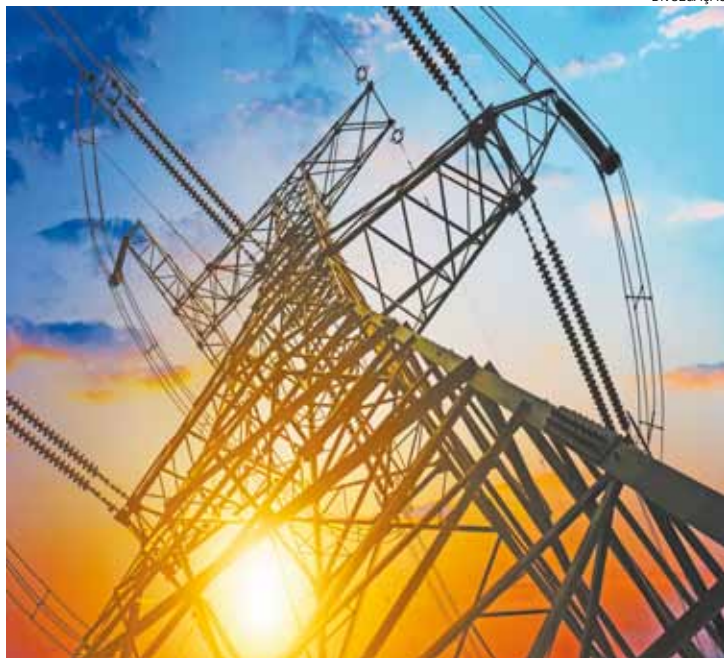
Linhas de transmissão - Energia baseada em água encareceu muito

No caso do botijão de gás também houve aumento,