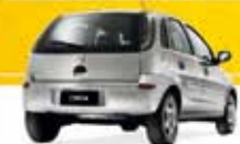
CORSA HT 1.4 2012 Pl. 8298 - COMPLETO R$ 24.500