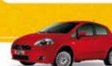
PUNTO ESSENCE 1.6 16V 2011 Pl. 4654 - COMPLETO R$ 31.900