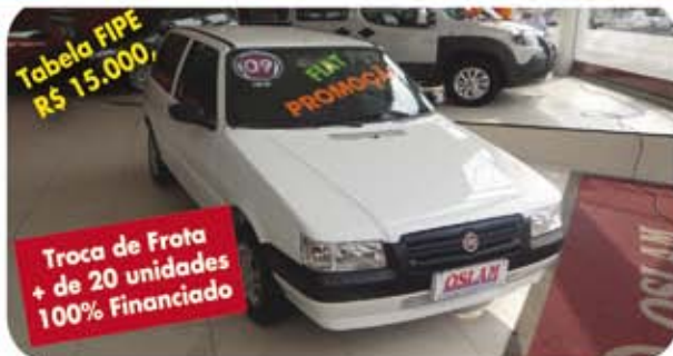
Tabela FIPE R$ 15.000,

Troca de Frota + de 20 unidades 100% Financiada