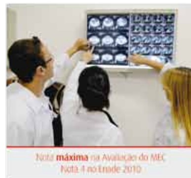
Nota máxima na Avaliação do MEC Nota 4 no Enade 2010

Tem por missão a formação de um profissional com perfil de promoção à saúde, competente e com habilidades específicas para a aquisição de imagens e controles dos procedimentos do diagnóstico por imagem , fornecendo ao médico radiologista imagens de alta confiabilidade. Além disso, capacita o profissional para atuar na aplicação de instrumentos e equipamentos associados à radiologia para a pesquisa acadêmica, no desenvolvimento de novos conhecimentos e tecnologias e para a atuação na indústria.