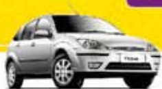
FOCUS HT 1.8 2002 Pl. 8930 - COMPLETO R$ 13.500