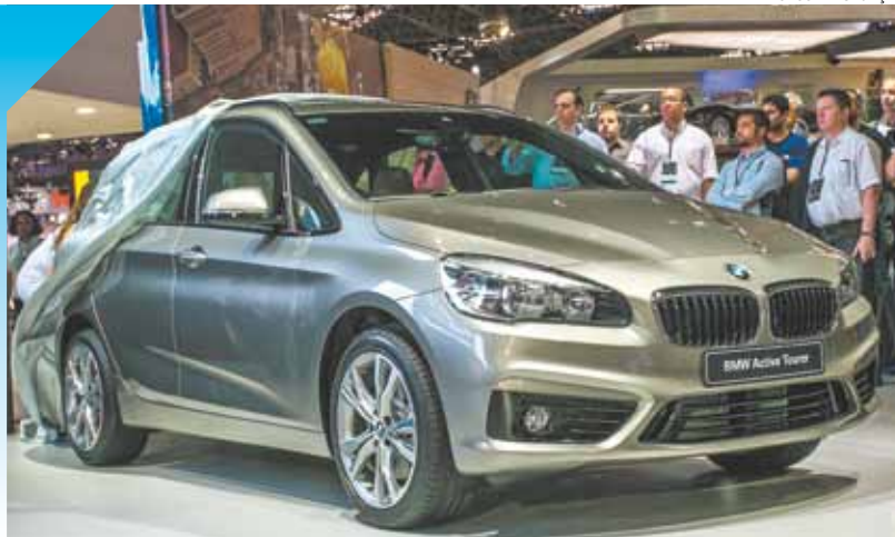
BMW – Parceria com Intel para dotar modelos de funcionalidades digitais

A alemã BMW e a Intel destacam no salão a tecnologia ConnectedDrive, que leva para dentro do automóvel a comodidade e conectividade de um computador completo. Com a solução é possível consultar rotas e mapas, incluindo trânsito em tempo real com visualização de pontos de interesse em 3D, serviços de emergência, serviços remotos, integração com smartphones iOS e Android que possibilitam o uso de recursos multimídia como a utilização de aplicativos de música "on demand" e a utilização de redes sociais, além de possibilitar o uso de aplicativos de escritório (como leitura e escrita de e-mails pessoais, leitura de canais de notícia, informações dinâmicas de estacionamento, entre outras).