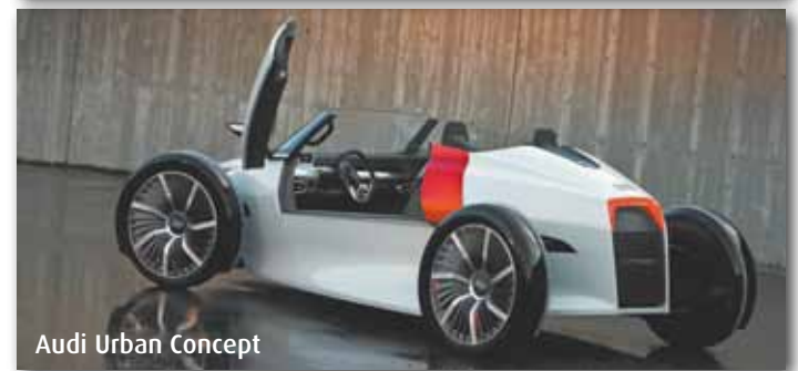
Audi Urban Concept

Utilitários, simuladores e novas tecnologias são as principais atrações do evento