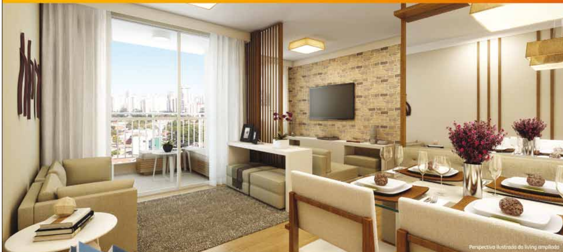
Perspectiva ilustrada do living ampieado

O melhor 2 e 3 dorms. c/ suíte da região.