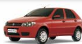
PALIO 4P FIRE FLEX 1.0 8V 07 PL-0695 - AR/DH/CE R$ 18.500,