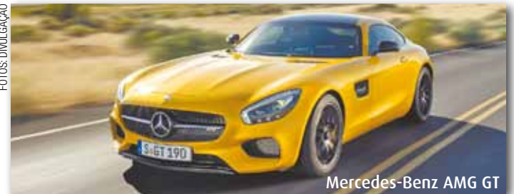
Mercedes-Benz AMG GT