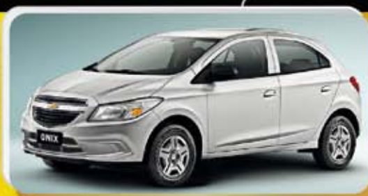
ONIX 1.4 2015 OKM (2)