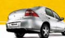
PRISMA MAXX 1.4 2011 Pl. 0311 - DH/VE/TE R$ 22.900