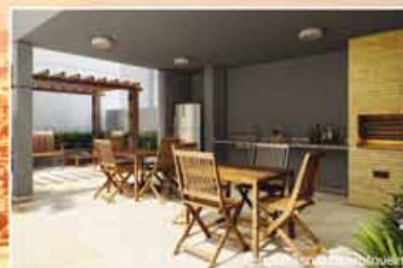
Perspectiva da churrasqueira