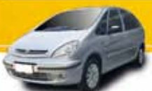
PICASSO 1.6 EXCL. 2010 Pl. 8486 - COMPLETO R$ 26.900