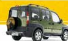
DOBLÔ ADVENTURE 1.8 2007 Pl. 6672 - COMPLETO R$ 30.500