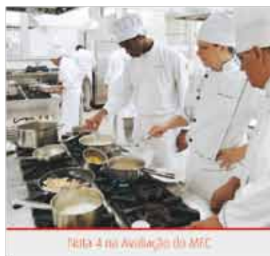
Nota 4 na Avaliação da MEC