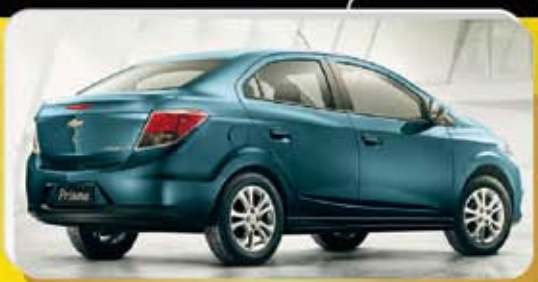
PRISMA 2015 OKM (3)