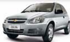
CELTA LIFE 1.0 10 PL-5132 R$ 16.990,