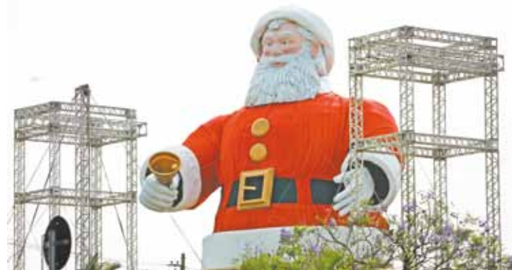
Gigante - Maior Papai Noel do Mundo entrou para o Guinness em 2013

Conteúdo de inteira responsabilidade da Rádio Metropolitana FM