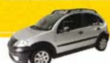
C3 XTR 1.6 2010 Pl. 3575 - COMPLETO R$ 24.500