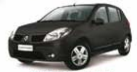
SANDERO EXP 09 PL-2296 SEM ENTRADA R$ 16.990,