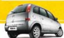
MERIVA JOY 1.4 2009 Pl. 3175 - COMPLETA R$ 25.900