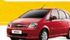
MERIVA JOY 1.4 2010 Pl. 6265 - COMPLETO R$ 25.900