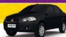
SIENA EL 1.0 2011 Pl. 6847 - DH/VE/TE R$ 20.900