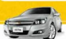
VECTRA EXPRESSION 2010 Pl. 2594 - COMPLETO R$ 30.500