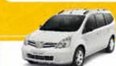
GRAND LIVINA SL 1.8 2010 Pl. 2811 - COMPLETO R$ 30.500