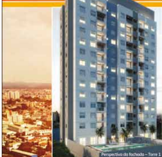
Perspectiva da fachada - Torre 1