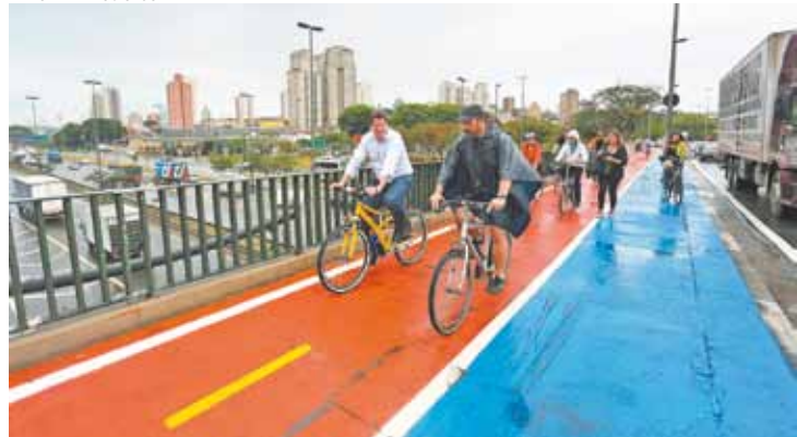
Sobre a Marginal - Ciclistas cruzam a pista expressa sobre a ponte

ESTADÃO CONTEÚDO - A Prefeitura de São Paulo inaugurou ontem a primeira ciclovia sobre ponte da capital paulista. Sobre o Rio Tietê, ela foi instalada na Casa Verde, zona norte da cidade. Além dela, as obras em outras duas pontes também na zona norte - a das Bandeiras e a Julio de Mesquita Neto - devem ser concluídas até o final do ano, informou no dia de ontem o secretário