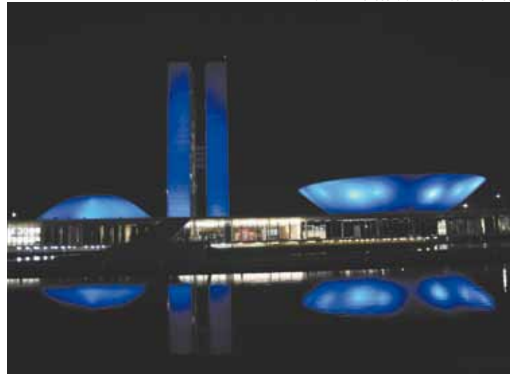
Iluminação - Congresso todo azul é para marcar prevenção do câncer