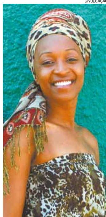
“Coroações” - Os textos estão organizados em três capítulos

Haverá bate-papo com a autora e uma intervenção cênica do poema “Coroações”, que dá nome ao livro. Durante o coquetel e da sessão de autógrafos haverá um pequeno show e sets de discotecagem.