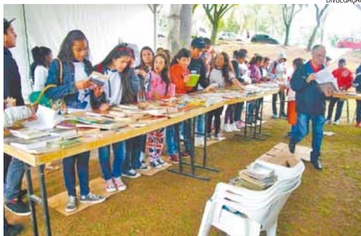
Incentivo - Programação elaborada em conjunto com escolas públicas

A programação, elaborada em conjunto com as escolas públicas da região, coletivos culturais, instituições locais e universidades, terá uma série de atividades para todas as idades. São intervenções artísticas, contações de história, serenatas, saraus, peças de teatro, conversas com autores, cortejos literários, oficinas, mediações de leitura, ônibus biblioteca, entre outras.