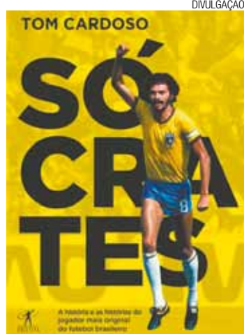
Cadência - Seu temperamento atraía admiradores e críticos

Além de jogar futebol, ele se engajou na vida pública do País. Idealista e rebelde, o meio-campista que desafiava as autoridades e incomodava os cartolas, carregava no nome a paixão pelo Brasil, que se viu refletida na participação ativa na campanha das Diretas Já. Formado em medicina, ele foi,