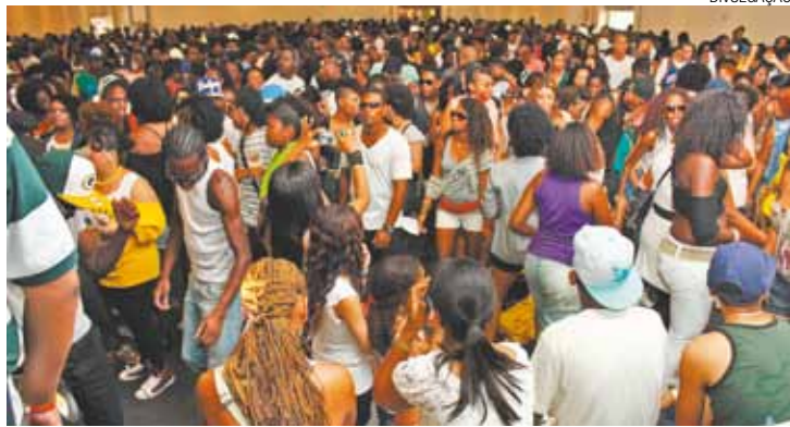
Encontro - No Mês da Consciência Negra, um movimento cultural