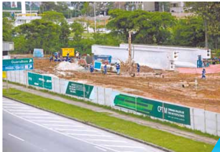
Obras aceleradas - Canteiro segue com operários a todo vapor

Nova data foi anunciada pelo governador Geraldo Alckmin na manhã de ontem