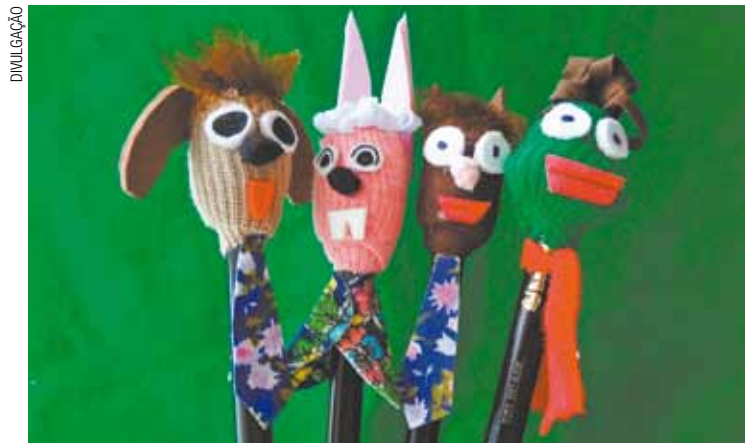
Imaginação - Com papel, tecido e cola, crianças darão vida a seus lápis

Inaugurada em 2007, livraria tem objetivo de ser um polo de formação de leitores