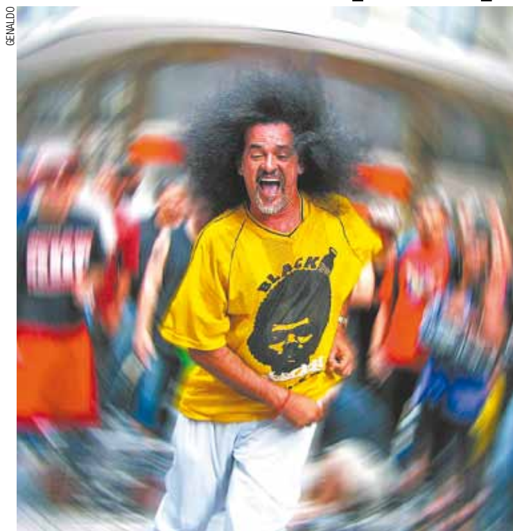
Vitalidade - Espetáculo com música, dança, rima e performance