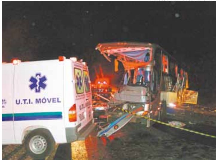
Choque - Ônibus bateu de frente com caminhão que levava óleo vegetal

O trecho em que ocorreu a colisão está em obras e, segundo o Departamen-