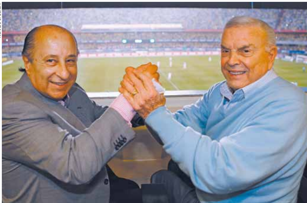
Troca - O ainda presidente da FPF, Marco Polo Del Nero, assume a CBF em abril, no lugar de Marín

A escolha dos jogadores que disputarão o Paulistão ficará a critério dos técnicos das 20 equipes. A FPF definiu também que haverá um limite de 25 jogadores de linha e três goleiros a serem inscritos - estes podem ser trocados em caso de lesão e as equipes que avançarem às quartas de final poderão fazer quatro mudanças no elenco.