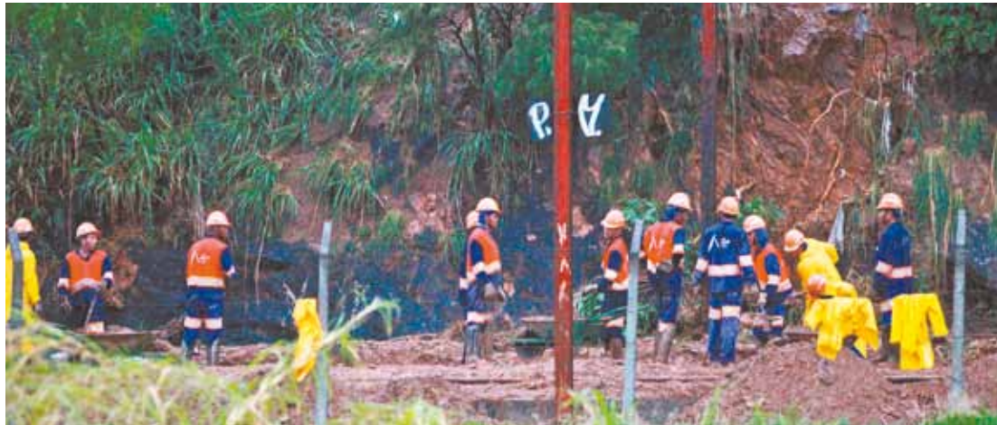
Linha Rubi - Paralisação entre as estações Franco da Rocha e Baltazar Fidelis por causa de um deslizamento

As Linhas 1-Azul e 3-Vermelha circulavam em velocidade reduzida no mesmo horário por causa da água