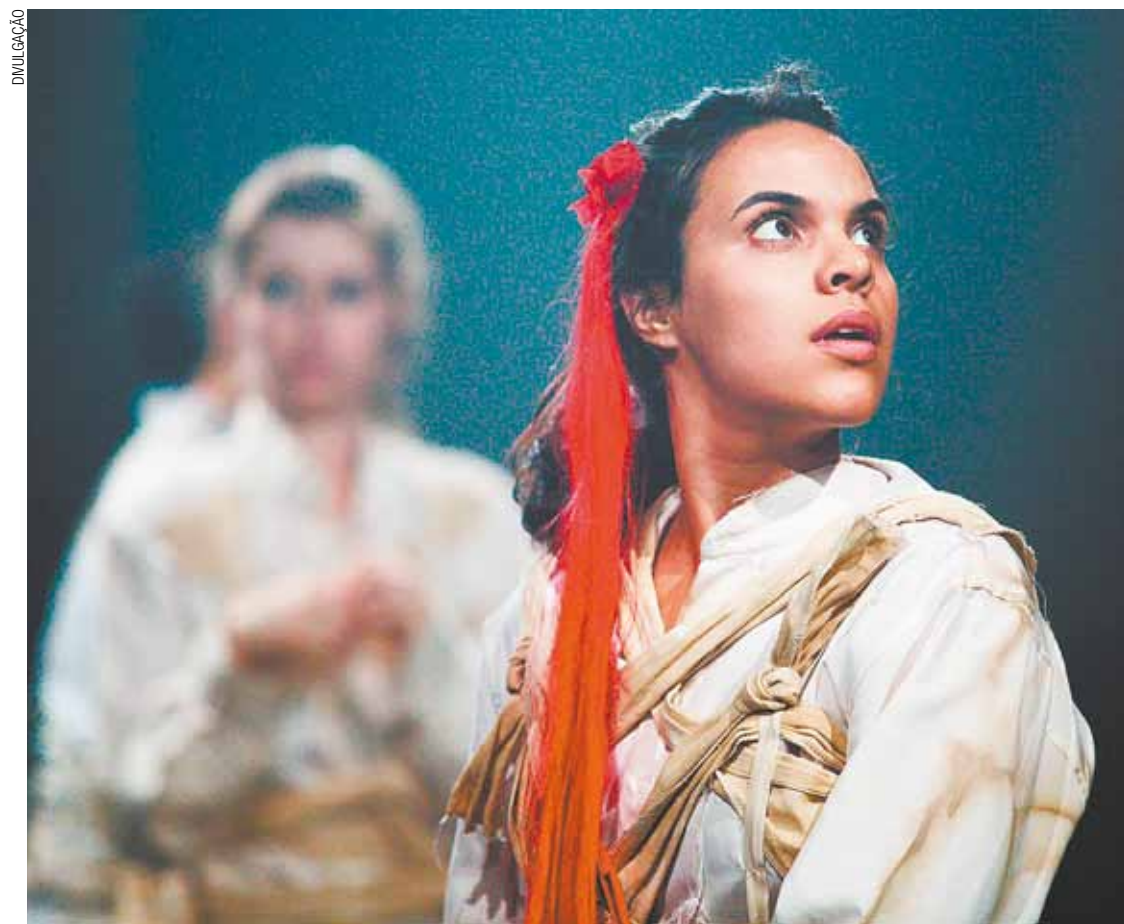
Camisa de força - Sensação de repetição de um mundo absurdo a ser encarado cotidianamente

da gratuita. Um bando de jovens investiga maneiras e possibilidades de ações para “mudar o mundo”, ou para descobrir o que pode fazer para construir um lugar melhor para se viver. Ou que seja, pelo menos, diferente de como está aqui e agora.