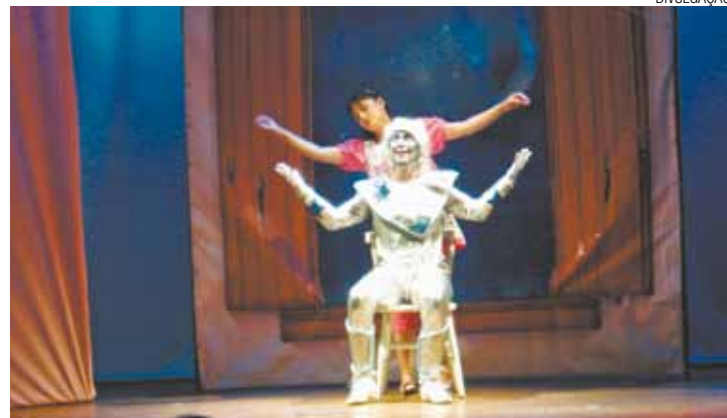
Fantasia - História de Clarinha e um amigo imaginário chamado Órion