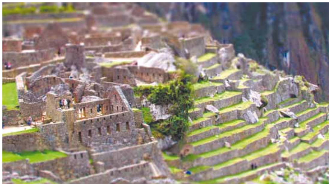
Machu Picchu - Um dos lugares mais visitados no Peru, a energia do santuário é de tirar o fôlego

Há também importantes sítios arqueológicos como Saqsayhuamán (com um mirante no qual se tem uma vista impressionante da cidade), Tambomachay, Q'enqo e Pukapukara. Localizados a mais de 3.400 metros de altitude, esses locais requerem certos cuidados para serem visitados.