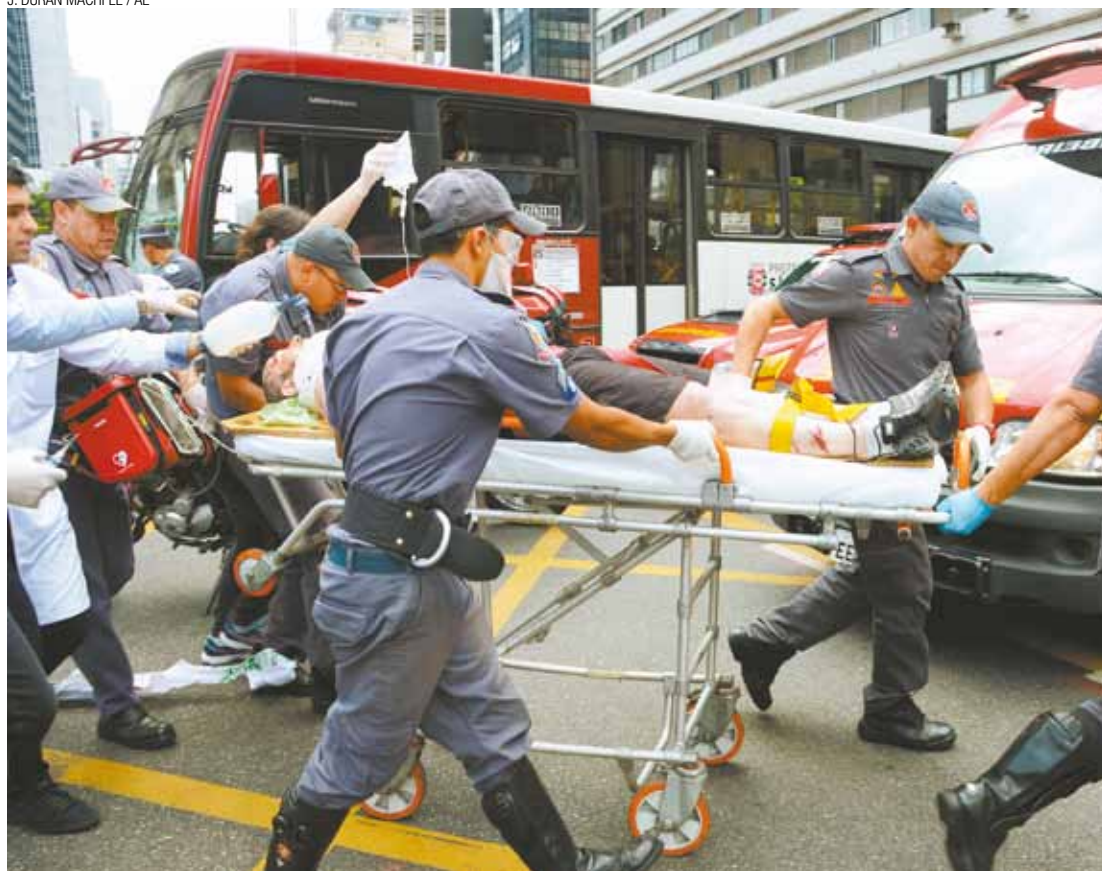
Tragédia - Homem estava inconsciente no momento do atendimento e foi levado ao Hospital das Clínicas, onde morreu

Preços aumentaram no supermercado em setembro