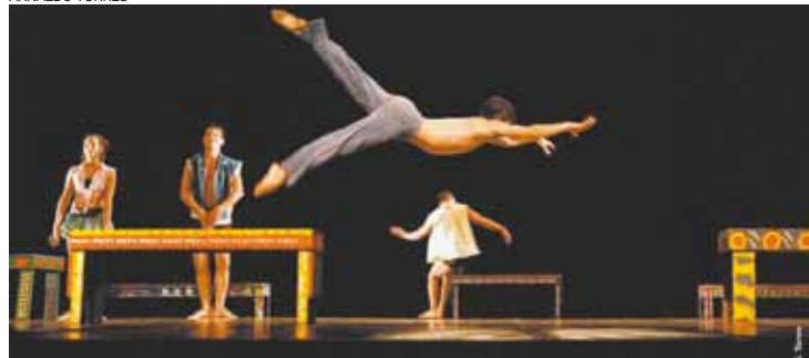
Continuidade - Intensa atividade musical e de coreografias vigorosas

mesmo tempo, pela simplicidade, a obra homenageia um dos ícones do País, o pernambucano Luiz Gonzaga, ao realizar uma leitura moderna da cultura popular do Nordeste.