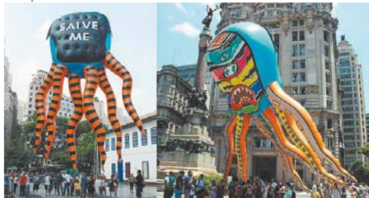
Salve Me - Polvo de 15m x 6m estampado e suspenso por gás hélio