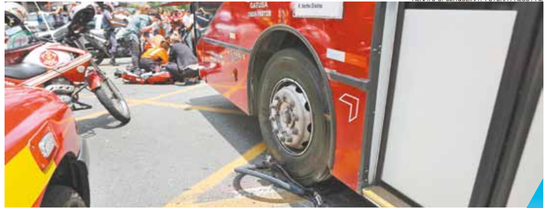
Perigo - Ônibus parou sobre a bicicleta; vítima teve ferimentos muito graves e não resistiu

Apesar de polêmica, a gestão do prefeito Fernando Haddad (PT) prometeu iniciar a obra de R$ 15 milhões em janeiro - a construção deve terminar em meados de 2015 e incluirá a Avenida Bernardino de Campos, continuação da Paulista no sentido zona sul.