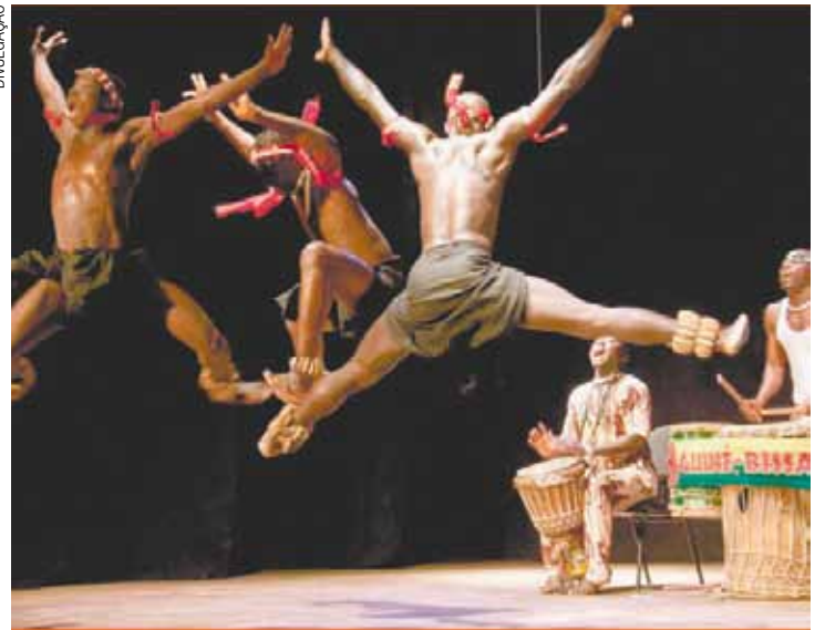
Guiné Bissau - Grupo apresenta danças típicas das várias etnias do país

Todas as atividades são gratuitas e abertas a todos.