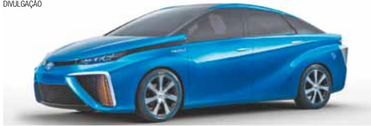
Toyota FCV – Planos da montadora são desenvolver sedã para 2015