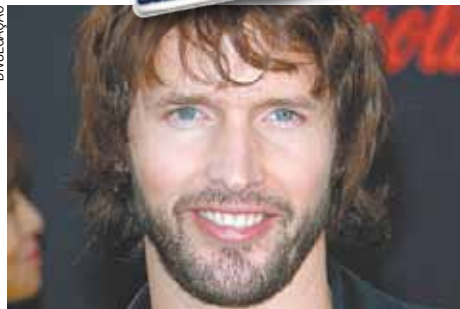
"You're Beautiful" fez sucesso em 2004

E ele ainda completou dizendo que o marketing que feito em volta dele, foi todo errado: "Eles [o marketing] me pintaram como uma pessoa séria e, como todos meus amigos sabem, eu sou tudo menos sério. Eu tenho algumas canções emotivas pelas quais sou conhecido, mas já ultrapassei isso. As pessoas conseguem ver que eu não me levo tão a sério".