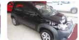
UNO WAY 1.0 EVO FLEX 4P 11.12 PL.7192, PRETO DE R$ 25.990, POR R$ 23.990,

FAÇA REVISÃO EM SEU VEÍCULO REGULARMENTE. AGENDE AGORA MESMO.