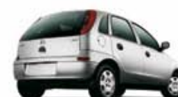
CORSA HATCH 1.0 04 PL-7184 - FRENTE NOVA R$ 13.990,