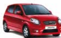
PICANTO EX 1.1 12 PL-6884 - COMPL. R$ 29.990,