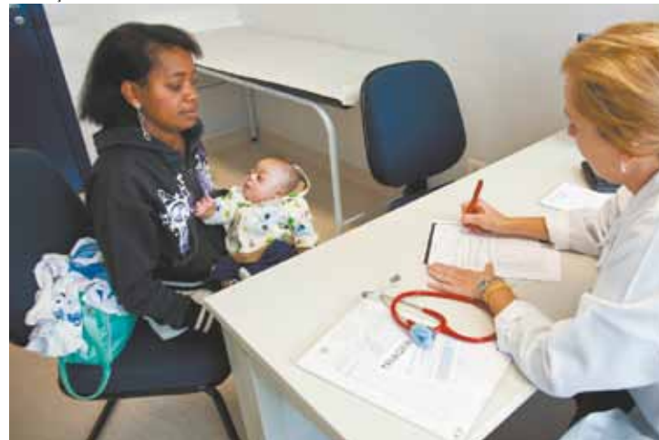
Atendimento - Valores destinados a projetos sociais e educacionais