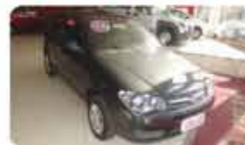
PALIO FIRE ECONOMY 2P 1.0 FLEX 11.12 PL.6417, CINZA DE R$ 22.990, POR R$ 20.990,