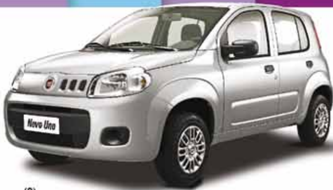
(2) UNO VIVACE 1.0 EVO FLEX 4P 2014

OLHA SÓ O QUE A FIAT OSLAM RESERVOU PARA VOCÊ!