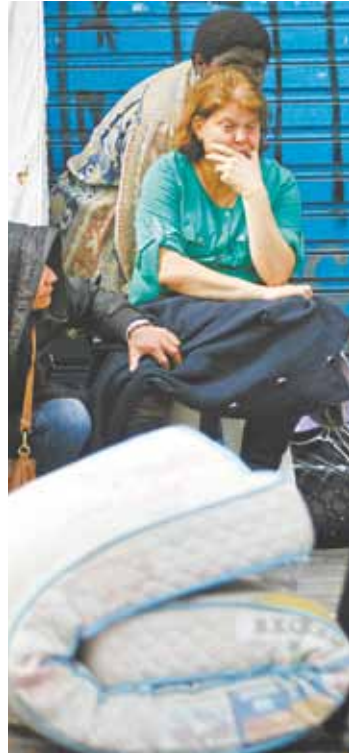
Desilusão - Mulher chora com seus pertences colocados na rua

ESTADÃO CONTEÚDO - A Polícia Militar realizou uma reintegração de posse de um prédio de 11 andares no centro de São Paulo na manhã de ontem. A ação teve início conturbado com registro de um incêndio no imóvel, mas as chamas foram controladas e a desocupação aconteceu.