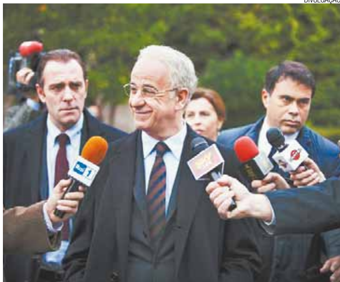
Disputa - Crítica mordaz e bem-humorada à classe política italiana