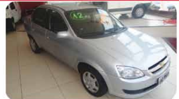
CLASSIC LS FLEX 12.12 PL.8541, PRATA DE R$ 27.490, POR R$ 24.990,