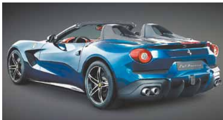
Traseira – Santantônios em fibra de carbono garantem proteção