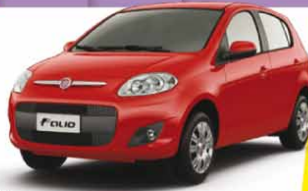
(1) NOVO PALIO ATTR. 1.0 EVO FLEX 4P 2015

APROVEITE (5) TAXA 0% E MAIS: GANHE R$ 500,00 (4) NA COMPRA DO SEU FIAT OKM