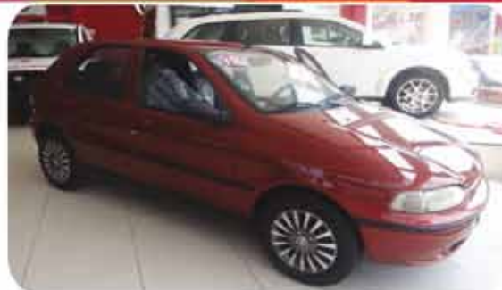
PALIO EL 1.5 4P 97.98 PL.9693, VERMELHO DE R$ 12.990, (8) POR R$ 10.990,