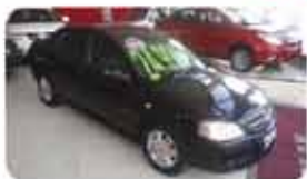
ASTRA SEDAN CD 03.04 PL.7481, PRATA DE R$ 24.990, POR R$ 21.990,