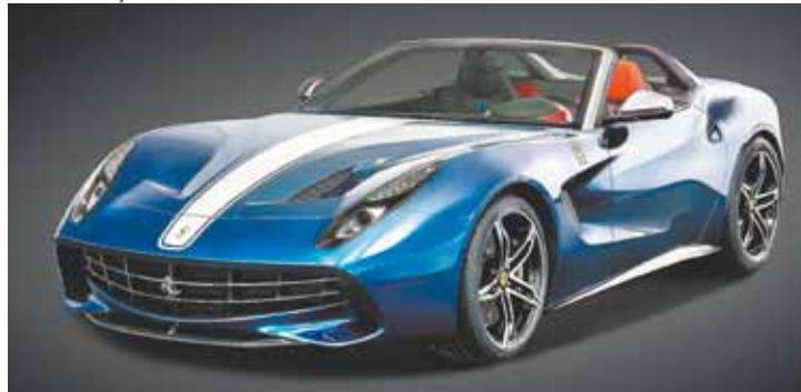
F60 America – V12 permite acelerar de zero a 100 km/h em apenas 3,1 s

dades foi o que aconteceu também com o modelo 275 GTS4 NART Spider, em 1967, que era uma versão aberta do modelo 275 GTB4, produzido especificamente para o mercado norte-americano, a pedido do importador Luigi Chinetti.