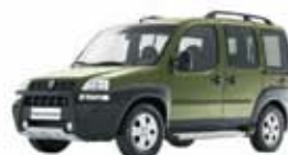
DOBLÒ ADVENT LOCK 1.8 8V FLEX 09 PL-9051 - COMPL. R$ 36.500,