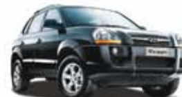
TUCSON GLS 2.7 V6 4x4 09 PL-6105 - COMPL./TETO R$ 44.900,