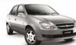
CLASSIC 11 PL-1564 - AR/DH/CONJ. ELÉTR. R$ 19.990,