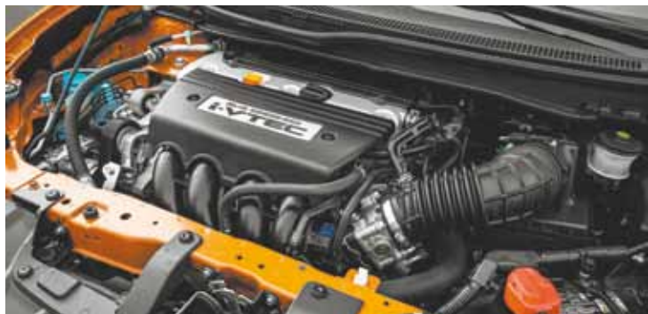
Motor – Tecnologia de variação de válvulas e alta rotação