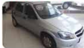
CELTA 1.0 LS FLEX 11.12 PL.4312, PRATA DE R$ 20.990, POR R$ 19.990,