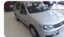
SIENA FIRE 1.0 FLEX 09.10 PL.6490, PRATA DE R$ 24.990, POR R$ 19.990,