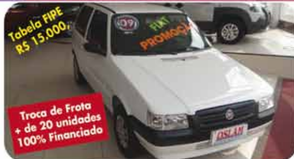
(3) MILLE ECONOMY 2P FLEX 08.09 PL.5893 - BRANCO POR R$ 9.990, ou Entrada + 48x R$ 299, (6)