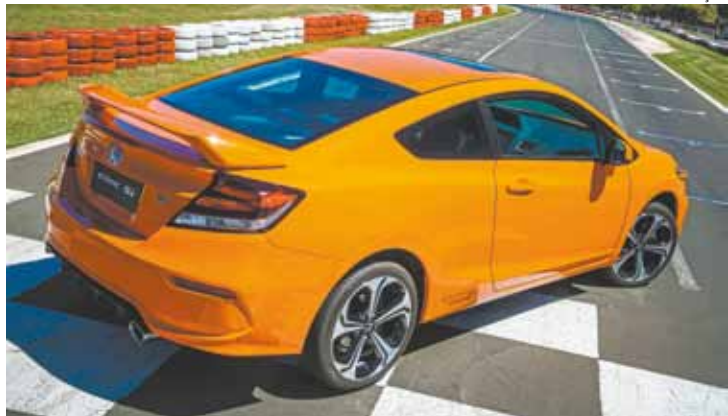
Traseira – Design é marcado por aerofólio, ponteira cromada