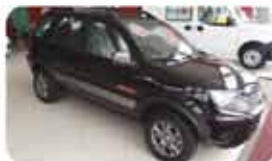
ECOSPORT FSL 1.6 FLEX 10.11 PL.1090, PRETO DE R$ 38.990, POR R$ 36.990,