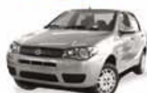
SIENNA FIRE 1.0 08 PL-4344 - COMPL. R$ 15.990,

SEU SEMINOVO COM TAXA DE ZERO OKM SOM MP3 GRÁTIS TAXAS A PARTIR DE 0,99%